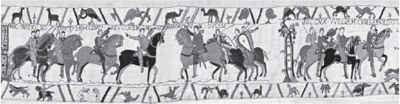
تصویر ۱ - قسمتی از پرده آوین بایو، کتابخانه شهرداری شهر بایو.

ای بودند برای جلوه‌گری هنر شاهنشاهی یا اشرافی. حکومت ساسانی کمابیش این اشیاء هنری را در ضبط خویش داشت و دربار خلیفه در بغداد کلاً هیچ تعصبی علیه پذیرش این گونه هنرها نداشت.