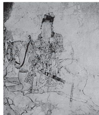
تصویر ۱۲ - قسمتی از پرده بافته بایو، سوارکاران با شاهین در دست.