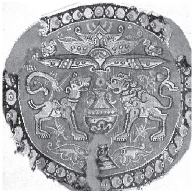
تصویر ۲ - قطعه بافته ابریشمین، متأثر از شیوه ساسانی، قبطی، مصر، قرن پنجم و ششم میلادی.

از قرن چهارم میلادی، نقوش به همراه کالاهای قیمتی و ارزشمند به مصر و از طریق جاده ابریشم به کشورهای حوزه مدیترانه راه پیدا کرد. به عنوان مثال، یکی از نمونه های قدیمی بافته های ابریشمین قدیمی منقوش، اولین کوشش های تکنیک تصویر سازی حیوانات و قرینه سازی حیوانات روبرو، همچنین گلدان با نقوش گیاهی قرینه که همگی بوسیله دایره تزینی در بر گرفته شده را نشان می دهد، که شیوه ای کاملاً ساسانی است. در واقع این اثر متأثر از مدل های ساسانی است (تصویر ۲).