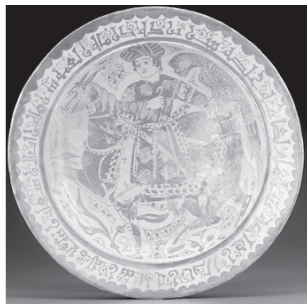
تصویر ۲۰- سینی لعاب دار، سوارکار سلطنتی باشاهین در دست، قرن دوازدهم میلادی، سلسله فاطمی، مصر، گالری هنر فریر.

می شود (تصویر ۱۷) و یا سینی لعاب دار مصری متعلق به دوران فاطمی، که دنباله رو همان اسلوب بازنمائی است (تصویر ۲۰). این شیوه صحنه شکارگری به سرزمین مسلمانان اسپانیا (اندلس) نیز نفوذ کرده و کاربرد فراوانی پیدا نمود. ظرفی از عاج فیل با حکاکی های فوق العاده و بسیار ظریف بازنمائی از طبیعت گیاهی و حیوانی است که در هم آمیختگی آنها تداعی گر فردوس و باغ های بهشتی است. بر روی بدنه این ظرف اشکال دایره ای ساسانی با نقوش تجریدی وجود دارند که یکی از آنها سوارکار با شاهین در دست را نشان می دهد (تصویر ۱۸). شیوه کلاسیک نقش پردازی در آن رعایت شده و حالت اسب، سوارکار و شاهین همانند نمونه های دیگر است.