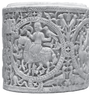
تصویر ۱۸- جعبه نگهداری اشیاء، سوارکار با شاهین در دست، عاج فیل، کنده کاری شده، مدینه الزهراء، اسپانیا، ۹۷۰ میلادی، موزه لوور. ماخذ: (CURATOLA, 2007, 117)