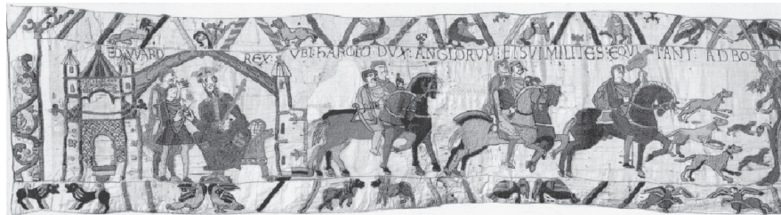
تصویر ۴- پرده آویز (فرشینه) بایو، قسمت هائی از اثر، قرن یازدهم میلادی.

در فرشینه بایو، حیوانات افسانه ای و واقعی در گونه های مختلف در دو ردیف بالا و پائین (حاشیه) نشان داده شده اند. ظروف