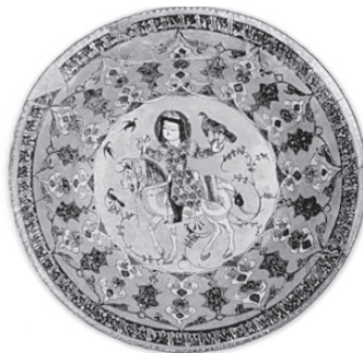
تصویر ۱۷- بشقاب سفال لعاب دار مینائی با نقش سوارکار با شاهینی در دست، قرن ششم و هفتم هجری قمری، ری. ماخذ: (CURATOLA, 2007, 276)

پهنه امپراطوری ساسانی بسیار گسترده و کانونی جهت پیوند بسیاری از فرهنگ های مختلف به هم بود. دامنه تاثیرات فرهنگی، اجتماعی و هنری آن در غرب، شرق و شمال یعنی آسیای مرکزی و تا قسمتی از اروپای شرقی به چشم می خورد. آثار و اشیاء مکشوفه در آسیای مرکزی نشانی از ساسانی بودن را بر خود حمل می کنند. سینی نقره طلا کاری شده، مکشوفه در مجارستان از نمونه هایی است که می توان شیوه نقش پردازی ظروف نقره ای ساسانی را بر روی آن ملاحظه نمود: دایره مرکزی محاط کننده صحنه، سوارکار با شاهینی در دست، اسبی با تزئینات ساسانی بویژه نقوش تزئینی زین و یراق بر روی کفل اسب (تصویر ۱۵). در این بشقاب سوارکار با حالتی شاهانه یک باز در دست دارد. نمونه دیگر نیز سینی نقره