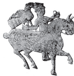
تصویر ۱۵- سینی نقره ای مطلا، سوارکار با شاهین در دست، اروپای مرکزی، مجارستان، قرن دهم میلادی.

ای متعلق با اروپای شرقی است که صحنه شکار را ترسیم نموده است (تصویر ۱۶). سوارکار با شاهینی در دست، در مرکز سینی نقش بسته در حالیکه چند حیوان در قسمت پائین قرار گرفته اند. دایره محاطی جای خود را به فرمی تزئینی دایره گونه نامتناسب داده است.