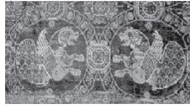
تصویر ۲- پارچه ابریشمین با نقش سیمرغ های روبرو، تاثیر گرفته از شیوه ساسانی، بیزانس، قرن هفتم میلادی، موزه بروکسل.

برای مثال، از سده دوازدهم میلادی تکه پارچه ای در موزه دو کلونی موجود است (تصویر ۱۰) که چند طاووس را در دو یکدیگر نشان می دهد.