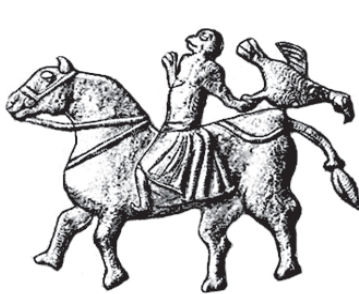
تصویر ۱۶- سینی نقره ای، سوارکار با شاهین در دست، اروپای شرقی، قرن دهم میلادی.