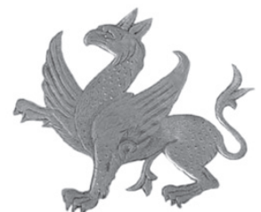
تصویر ۵- کاسه با نقش گریفون در مرکز دایره تزئینی، نقره و طلاکاری، قرن پنجم و ششم میلادی، ساسانی، موزه هنر اسلامی، برلین.