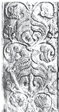
تصویر ۵ - نقش ساسانی. ماخذ: (خزایی، ۱۳۸۱، ۲۱)

- در تصاویر ۵ و ۶ با آنکه بین اجرای آنها چندین قرن فاصله می باشد اما درخت زندگی گویی باید از طرحی ثابت و والا بهره برد، تا در دوره اسلامی به نام درخت طوبی نامیده شود. می توان نمونه هایی این چینی را گاه در فرهنگ ها و هنرهای دیگر ملل عالم یافت اما در دو نکته، نقوش ایرانی ویژگی خاص می یابند. اول در فلسفه وجودی این حرکت که مناسب با رویش و معنای مفهومی آن است. که در نقوش ایرانی در پی یافتن جهانی دیگر بر می آید، یا شاید آن چیزی که "الکساندر پاپادوپولو" "گریز از خلاء" می نامد.