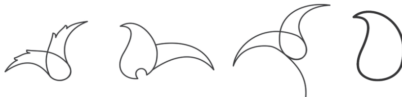
تصویر ۷- در ساختار اصلی تزئینات ایرانی گاهی تکرار همراه با تزئینات و ریزه‌کاری‌ها، نقش رابه شکلی دیگر تشبیه می‌کند. با کمی دقت و تجزیه لایه‌های تزئینات پی به اصل و بن‌مایه‌ی مشترک شکل‌ها خواهیم برد.

نمونه‌ای از نقوش ایرانی را از دوره گوناگون تاریخی در ذیل مشاهده می‌کنیم (جدول ۱) که کلید اصلی طرح آنها بر پایه‌ی حرکتی بته جقه گونه و یا به تعبیری اشک گونه است که همان طرح اولیه‌ی