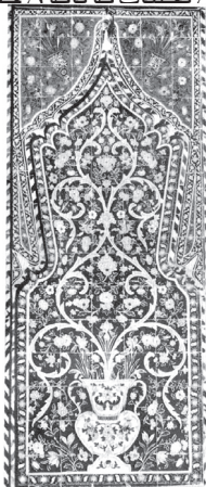
تصویر ۶ - کاشیکاری مسجد دوره اسلامی. ماخذ: (خزایی، ۱۳۸۱، ۵۶)

"تداوم به صرف شباهت ظاهری یا وحدت اسم معلوم نمی شود، دلیل واقعی این است که نوعی اصل حاکم بر رشد، دخالت داشته باشد و این اصل هویت خود را در جریان تحلیلات گه ناگه حفظ کند (پوپ، ۱۳۸۷، ۱۳).