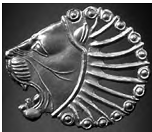
تصویر ۲۳- هخامنشی. ماخذ: (موزه بروکلین)