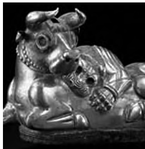
تصویر ۴۸- قالیچی؟.