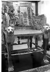
تصویر ۳۳- سریر توت عنخ آمون.