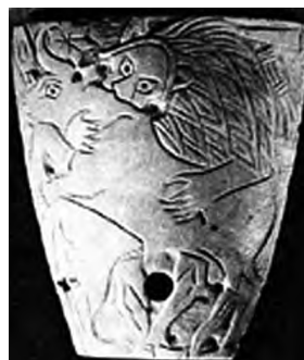
تصویر ۵۲- سومر.