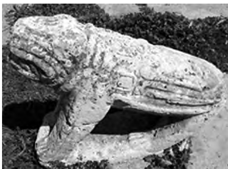
تصویر ۱ - تندیس شیر، گورستانی در اینه.

۱-۴. شیر در آیین مهر: در میان هفت رده دین مهر، چهارمین جایگاه از آن شیر است (Clauss, 2000, 132). به سرشت آتشین شیر در اندیشه مهری نیز اشاره شده است. آب و آتش با یکدیگر مبارزه ای مدام و آشتی ناپذیر دارند. پس سالکانی که به جایگاه شیر رسیده اند برای شست و شوی بدن (غسل تعمید) خود به جای آب عسل به کار می برند (ورمانن، ۱۳۸۳، ۷۵).