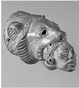
تصویر ۳۲- غلبه شیر بر نوبی.