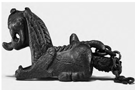
تصویر ۱۱- حسنلو.