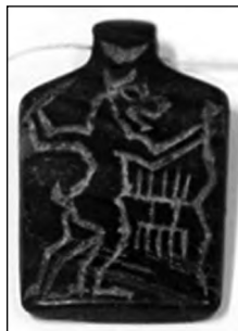
تصویر ۳- ایلامی.