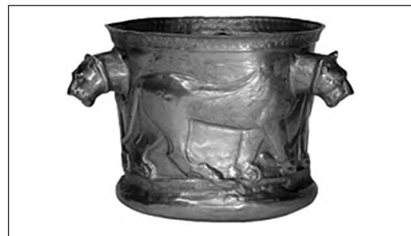
تصویر ۱۲- کلاردشت.

بر دور جام زرین کلاردشت سه شیر چرخان دیده می شوند (تصویر ۱۲). در میانه هزاره نخست پ.م در شمال شرق ایران نیز شیر در آثار گنجینه پازیریک (تصویر ۱۳) حضور دارد. شیر از مهم ترین نمادهای هنر هخامنشی است. تخت شاه همواره پایه هایی بسان پنجه شیر دارد. تخت بزرگی که نمایندگان ساتراپی ها در سنگ نگاره های نقش رستم به دوش دارد نیز چنین است. بر دیوارهای آپادانای شوش یک ردیف شیر غران نقش شده اند (تصویر ۱۴). شیرهای سنگی نگهبان در پارسه نیز حضور داشته اند (تصویر ۱۵). شمشیر زرین شاهی دسته ای از سر دو شیر دارد (تصویر ۱۶) و زیباترین تکوک های هخامنشی از پیکر شیر شکل گرفته اند (تصویر ۱۷). رویارویی دو شیر خشمگین از نمادهای رایج این دوران است (تصویر ۱۸). در یک نمونه بسیار کمیاب سر دو شیر به هم پیوسته و یکی شده است (تصویر ۱۹). یک اثر مفرغی دیگر سه شیر چرخان و چسبیده به هم را تصویر می کند (تصویر ۲۰). شیرهای مفرغی کاربرد وزنه نیز داشته اند. یک نمونه یافت شده از ساتراپی لیدییه حدود ۲۱ کیلوگرم (نزدیک به یک تالنت بابلی) وزن دارد (تصویر ۲۱). شیر را بسان محافظ بر دستبندها، گردن آویزهای سنگی (تصویر ۲۲)، و آذین های لباس (تصویر ۲۳) دوران هخامنشی نیز می توان دید.