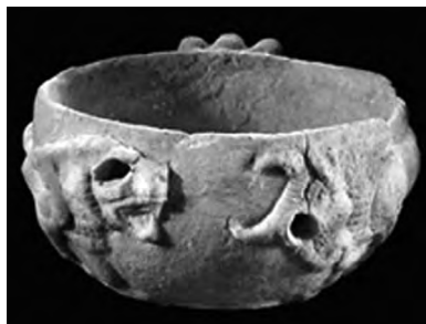
تصویر ۴۶- شوش.