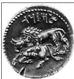
تصویر ۵۷- مازائوس.