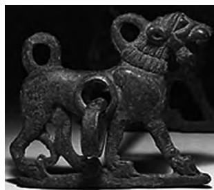
تصویر ۸- لرستان.