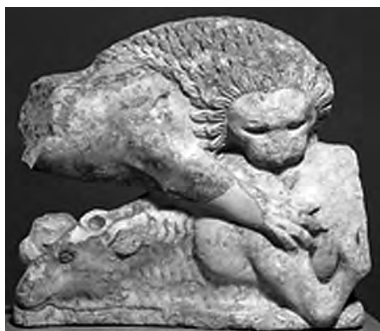
تصویر ۵۵- یونان.