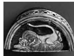
تصویر ۵۳- اور.