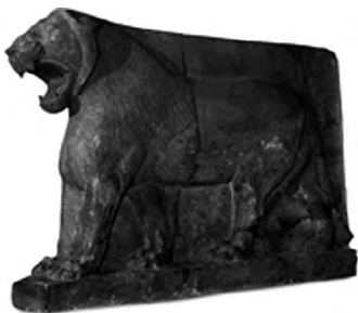
تصویر ۲۵- دروازه ایشتار.