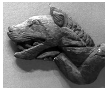
تصویر ۱۳- پازیریک.