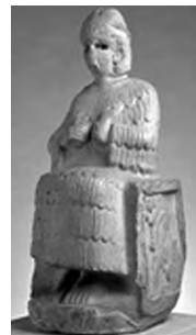
تصویر ۲- ایلامی.

مولانا نیز زمان را به گونه شیر توصیف می‌کند: یکی شیری همی بینم جهان پیشش گله‌ی آهو که من این شیر و آهو را نمی دانم نمی دانم زمین چون زن فلک چون شو خورند فرزند چون گربه من این زن را و این شو را نمی دانم نمی دانم اشاره مولانا به خورده شدن فرزند نیز اسطوره یونانی کرونوس خدای زمان را به یاد می‌آورد.