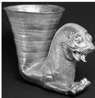
تصویر ۱۷- هخامنشی.

بر دور جام زرین کلاردشت سه شیر چرخان دیده می شوند (تصویر ۱۲). در میانه هزاره نخست پ.م در شمال شرق ایران نیز شیر در آثار گنجینه پازیریک (تصویر ۱۳) حضور دارد. شیر از مهم ترین نمادهای هنر هخامنشی است. تخت شاه همواره پایه هایی بسان پنجه شیر دارد. تخت بزرگی که نمایندگان ساتراپی ها در سنگ نگاره های نقش رستم به دوش دارد نیز چنین است. بر دیوارهای آپادانای شوش یک ردیف شیر غران نقش شده اند (تصویر ۱۴). شیرهای سنگی نگهبان در پارسه نیز حضور داشته اند (تصویر ۱۵). شمشیر زرین شاهی دسته ای از سر دو شیر دارد (تصویر ۱۶) و زیباترین تکوک های هخامنشی از پیکر شیر شکل گرفته اند (تصویر ۱۷). رویارویی دو شیر خشمگین از نمادهای رایج این دوران است (تصویر ۱۸). در یک نمونه بسیار کمیاب سر دو شیر به هم پیوسته و یکی شده است (تصویر ۱۹). یک اثر مفرغی دیگر سه شیر چرخان و چسبیده به هم را تصویر می کند (تصویر ۲۰). شیرهای مفرغی کاربرد وزنه نیز داشته اند. یک نمونه یافت شده از ساتراپی لیدییه حدود ۲۱ کیلوگرم (نزدیک به یک تالنت بابلی) وزن دارد (تصویر ۲۱). شیر را بسان محافظ بر دستبندها، گردن آویزهای سنگی (تصویر ۲۲)، و آذین های لباس (تصویر ۲۳) دوران هخامنشی نیز می توان دید.