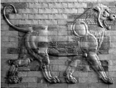
تصویر ۴- هخامنشی.

بازوبند زرینی از مارلیک (ابتدای هزاره نخست پ.م) با سر دو شیر خشمگین آذین یافته (تصویر ۱۰). در همین دوران شیر در عاج کندهای زیویه نیز دیده می شود. بر جام حسنلو دو شیر نقش شده، یکی خوابیده که اژدها و مردی بر دوش دارد و دیگری که ایزدبانویی را بر دوش خود نشانده. در آثار مفرغین حسنلو نیز شیر بارها تصویر گردیده (تصویر ۱۱).