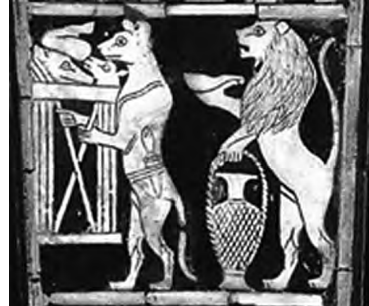
تصویر ۲۸- اور.