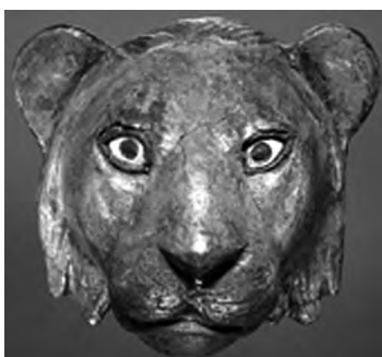
تصویر ۲۷- اور.