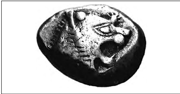
تصویر ۴- لیدی.