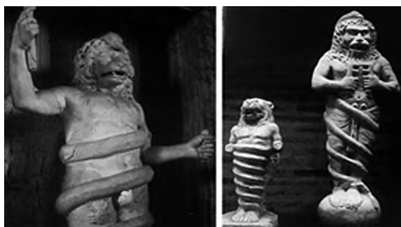
تصویر ۴- خدای شیرسر مهری.

مولانا نیز زمان را به گونه شیر توصیف می‌کند: یکی شیری همی بینم جهان پیشش گله‌ی آهو که من این شیر و آهو را نمی دانم نمی دانم زمین چون زن فلک چون شو خورند فرزند چون گربه من این زن را و این شو را نمی دانم نمی دانم اشاره مولانا به خورده شدن فرزند نیز اسطوره یونانی کرونوس خدای زمان را به یاد می‌آورد.