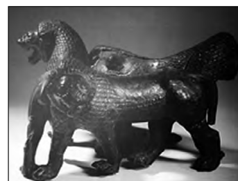
تصویر ۲۰- هخامنشی.