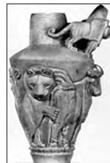
تصویر ۵۱- اوروک.