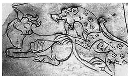
تصویر ۴۹- کردستان.