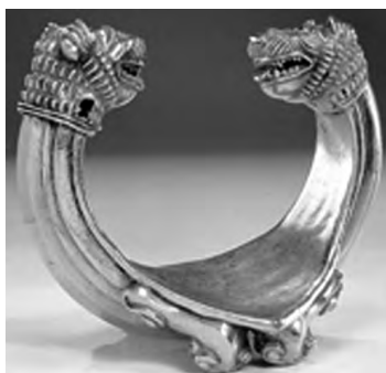
تصویر ۱۰- مارلیک.