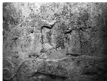
تصویر ۳۹- هیتی.