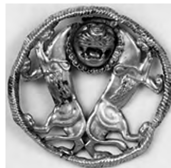
تصویر ۱۹- هخامنشی.