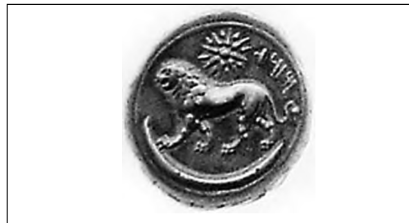
تصویر ۴۱- مازائوس. ماخذ: (موزه کمبریج)

بغبانو به رسم کهن شرقی بر پشت شیری ایستاده و هاله‌ای از پرتوهای خورشید او را در بر گرفته است. این نگاره شاید آغازی بر نشستن خورشید بر دوش شیر در هنر ایرانی باشد. در هنر هزاره نخست پ.م همواره بر ران شیرها مهرانه (گردونه مهر) یا سوآستیکا دیده می‌شود که شاید اشاره‌ای دیگر به ارتباط شیر و خورشید باشد. از جمله بر جام‌های عمارلو، حسنلو و کلاردشت.