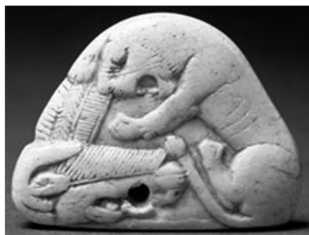
تصویر ۵۰- هخامنشی.