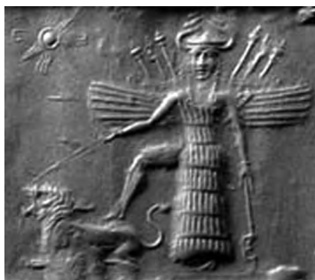
تصویر ۲۶- اینانا.