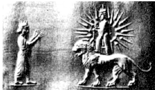
تصویر ۴۲- هخامنشی؟. ماخذ: (موزه بریتانیا)