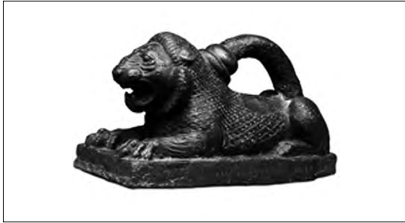
تصویر ۲۱- هخامنشی.