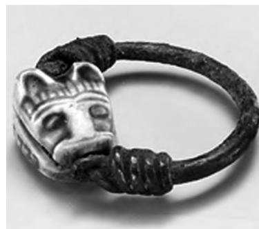
تصویر ۳۸- تبس.

در یک نگاره مصری خدایانو هاتور (یا شاید کادش) مثل ایزدبانوان ایرانی و میانرودانی بر پشت شیر تصویر شده است. شیران نگاهبانی نیز از آستانه گورستان های مصری یافت شده اند، از جمله نمونه ای از دوره هخامنشی در سقاره (تصویر ۳۶). از هورمهب فرعون مصر (۱۳۰۰ پ.م) حلقه ای زرین با نقش شیر باقی مانده (تصویر ۳۷)، انگشتری دیگری نیز با نقش شیر محافظ از تبس ۱۵۰۰ پ.م یافت شده (تصویر ۳۸).