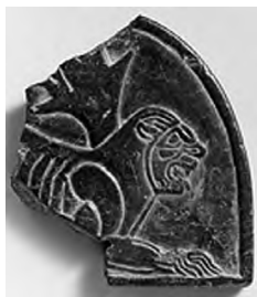
تصویر ۲۲- هخامنشی.