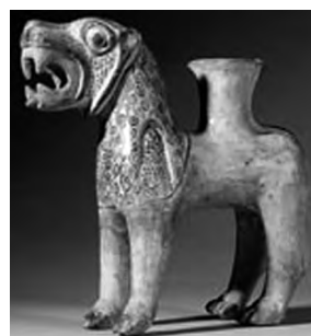
تصویر ۳۰- بابل.

همین رخداد در ایران نیز قابل پیگیری است. میترا (میتره هر سپیده دم خورشید را با گردونه ای چهار اسبه به آسمان می آورد. در مهر یشت آمده: اوست نخستین ایزد مینوی که پیش از خورشید فناپذیر تیز اسب در بالای کوه هرا بر می آید (مهر یشت، کرده ۳، بند ۱۳). مهر یشت در نیایش مهر و خورشید برای خورشید نگاشته شده است. اما به تدریج مهر و خورشید را همسان پنداشته اند.