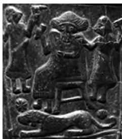
تصویر ۹- لرستان.

در بسیاری از مهر‌آوه‌ها تندیس‌های از موجودی شیرسر یافت شده که ماری به دور او پیچیده است (تصویر ۴). از او در کتیبه‌ها ۴۴ نام آریمانوس یاد شده که شاید همان اهریمن باشد (Jack-son, 1985, 17). درحالی که برخی پژوهشگران او را آیون (زروان یا کرونوس) می‌دانند دیگران بر اهریمن بودن وی تکیه دارند (Barnett, 1975, 467). گرچه هویت راستین این انگاره هنوز در ابهام است اما بسیاری از مهرپژوهان او را با زمان و تغییر فصل‌ها مرتبط دانسته‌اند (Beck, 2004, 194).