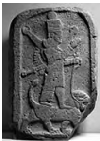
تصویر ۲۴- ایشتار.