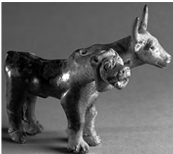
تصویر ۴۴- غرب ایران.