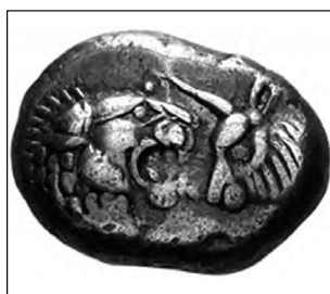
تصویر ۵۶- لیدی.