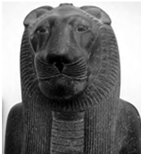
تصویر ۳۴- سحمت.