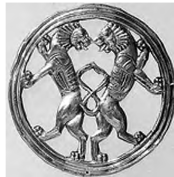
تصویر ۱۸- هخامنشی.