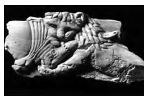
تصویر ۵۴- آشور. ماخذ: (Hermann, 1986: 694)