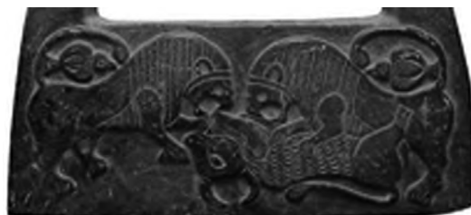
تصویر ۴۵- جیرفت.

در حقیقت در هزاره نخست پ.م، خورشید در فروردین در برج گاو خانه داشته است. اگر ارتباط شیر با خورشید را بپذیریم، می‌توان نشستن شیر بر پشت گاو را رمزی از ورود خورشید به برج ثور و رسیدن نوروز در سرزمین ایران دانست. از این رو نقش کردن این نگاره در پارسه که جایگاه برپایی جشن نوروز بوده است بایسته می‌نماید.