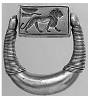
تصویر ۳۷- حلقه هورمهب.