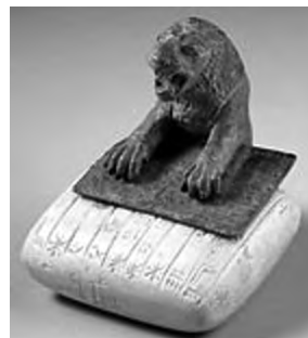
تصویر ۲۹- اور.