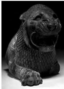
تصویر ۱۵- هخامنشی.