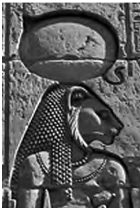
تصویر ۳۵- سحمت.