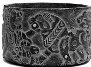
تصویر ۵- جیرفت.