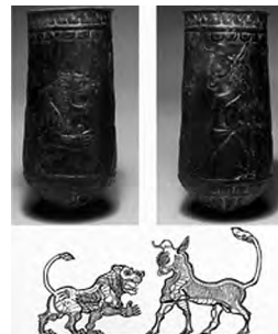
تصویر ۴۷- لرستان.