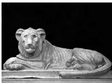
تصویر ۳۶- سقاره.