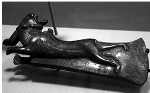
تصویر ۷- لرستان.