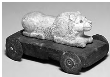
تصویر ۶- ایلامی.