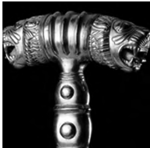
تصویر ۱۶- هخامنشی.