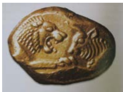
تصویر ۱- سکه ضرب لیدی که تا زمان ضرب سکه شاهی دوره هخامنشی در ایران رایج بوده است. ماخذ: (شهبازی، ۱۳۸۴، ۱۰۹)

سکه‌های پیش از اسلام در ایران موضوع مورد علاقه بسیاری از محققان برای مطالعه بوده است. از جمله "پوپ" در کتاب «سیری در هنر ایران» به معرفی و بررسی سکه‌های آن دوران پرداخته است. از بین محققان ایرانی بیش از همه "ملک‌زاده بیانی" مطالعه تخصصی خود را بر سکه‌های ایران متمرکز کرده است و در این زمینه کتاب ۲ جلدی «تاریخ سکه» را تألیف نموده است. از منابع مذکور و دیگر منابعی که کم و بیش به مطالعه موردی سکه‌ها پرداخته‌اند، هیچ‌کدام به آنالیز طرح تاج شاهان روی سکه‌ها (به غیر از تاج شاهان ساسانی) توجه نداشته‌اند. در این مقاله سعی شده، تا مطالب و موضوعات جدیدتری نسبت به منابع مذکور بیان گردد.