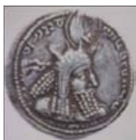
تصویر ۱۰- سکه ای از بهرام اول، پرتوهای خورشید را به وضوح می توان بر روی تاج وی مشاهده کرد. ماخذ: (امینی، ۱۳۸۹، ۱۲۳)