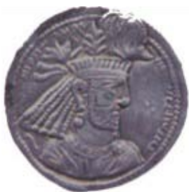
تصویر ۱۱- سکه ای از نرسی با نقوش گیاهی بر روی تاج وی ماخذ: (امینی، ۱۳۸۹، ۱۲۴)