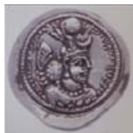
تصویر ۹- سکه ای از یزدگرد اول، تاج وی مزین به نقش ماه است. ماخذ: (امینی، ۱۳۸۹، ۱۲۸)