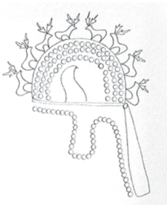
تصویر ۶- طرحی از تاج های مجلل اشکانی

از کلاه نمدی اشراف زادگان پارت به تاج های مجلل و مرصع تحول یافته اند. بنابراین، طبقه بندی تاج شاهان اشکانی بدین ترتیب می باشد: