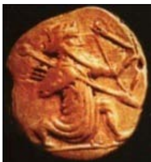
تصویر ۲- سکه از خشایارشا، شاه به صورت کماندار بازنمایی شده است. ماخذ: (هینلز، ۱۳۸۸، ۱۵)

تصاویر کلی سکه‌های هخامنشی: تصویر اصلی محکوک بر روی سکه‌های هخامنشی ۲ عموماً به یک صورت مشخص