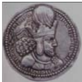
تصویر ۸- سکه شاهپور اول، تاج وی بر روی سکه دارای کنگره‌ی سه گانه است که پوپ به آن اشاره کرد.