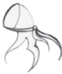
تصویر ۴- طرحی از کلاه باشلق شاهان پارتی.