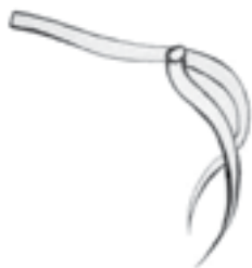
تصویر ۵- طرحی از نیم تاج زرین شاهان اشکانی