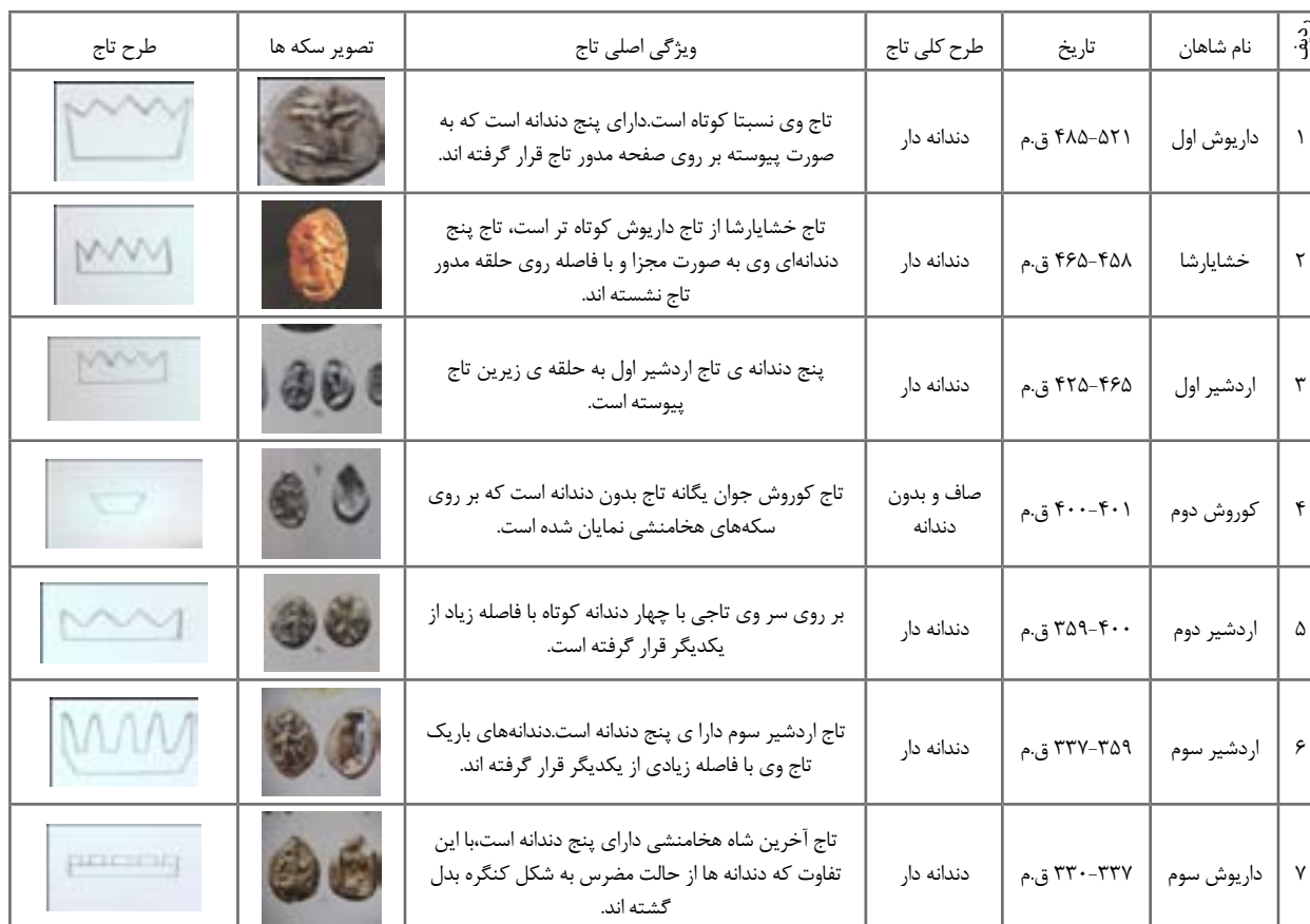
جدول ۱- طرح تاج شاهان هخامنشی.

بر روی سکه‌های هخامنشی غیر از تصویر شاهنشاه نقش دیگری حک نشده، و در پشت سکه‌ها عموماً تصویر خاصی حک نشده است؛ تنها فرورفتگی‌های چهارگوش نامنظمی که شاید نماینده تصویر خاصی باشد، در پشت مسکوکات نمایان شده