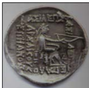
تصویر ۳- پشت سکه درهم مهرداد دوم، ارشک اول بنیانگذار سلسله اشکانی بر پشت سکه حک شده است.

استثنایی در این مورد دیده می‌شود. عموماً تصاویری که پشت سکه های اشکانی حک شده، نقش مؤسس این سلسله، ارشک اول است (تصویر ۳).