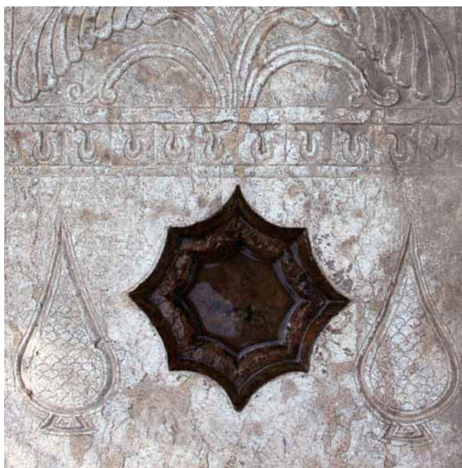
تصاویر ۱۸ و ۱۹- طشت آب و سرو، آرامگاه ارامنه و تخت فولاد.

در قرون اول میلادی) نقش بسته بود، نمونه‌ای از آن در کنار طشت آبها و روی قبور ارامنه اصفهان به دست نیامد.