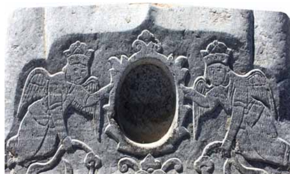
تصاویر ۶ و ۷- طشت آب با فرشتگان، آرامگاه آرامنه و تخت فولاد.