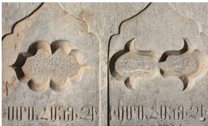
تصاویر ۱۶ و ۱۷- طشت آب های زوجی و قرینه‌ای، آرامگاه ارامنه و تخت فولاد.