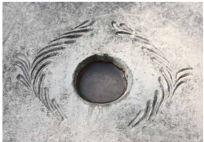
تصاویر ۱۴ و ۱۵- طشت‌آبهای ساده هندسی، آرامگاه آرامنه و تخت فولاد.