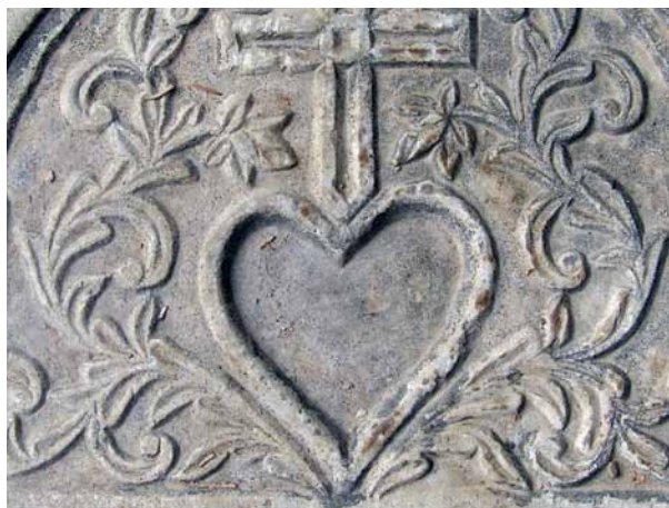
تصویر ۲۱- طشت آب به فرم قلب، آرامگاه آرامنه.