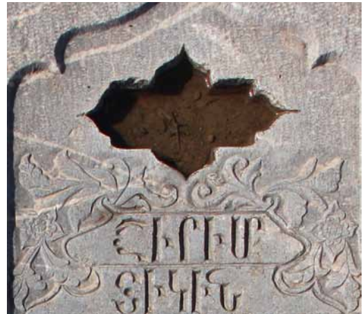
تصاویر ۱۲ و ۱۳- طشت‌آب ترنجی، آرامگاه آرامنه و تخت فولاد.