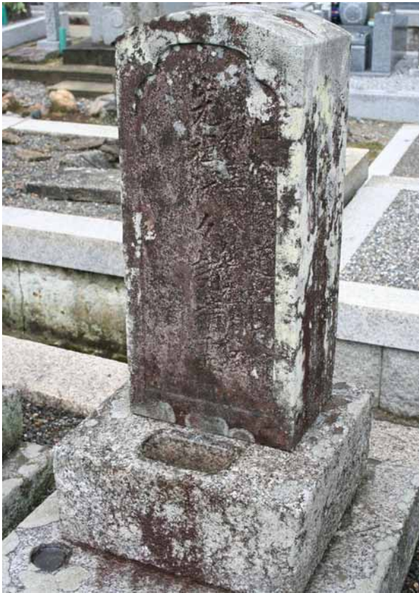
تصویر ۳- طشت آب در ژاپن.