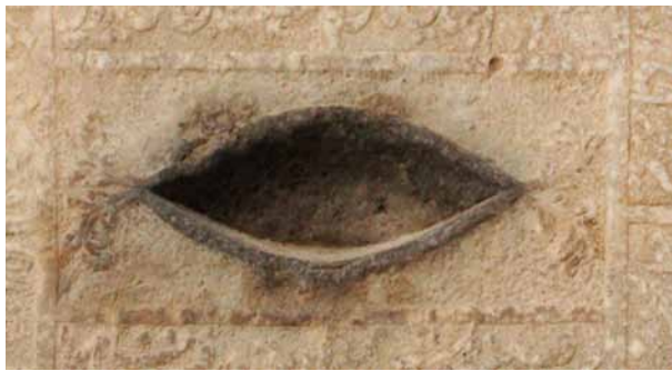
تصویر ۲۲- طشت آب کشکولی، تخت فولاد.