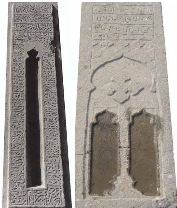
تصاویر ۸ و ۹- طشت آب محرابی، آرامگاه آرامنه و تخت فولاد.

در فرهنگ اسطوره‌ای، آب نماد اقیانوسی بود که کیهان از آن آفریده شد و نیلوفری که روی آب در حرکت بود به مشابیه زهدان آن به شمار می‌رفت (هال، ۱۳۸۰، ۳۰۹). از طرفی نیلوفر در فرهنگ ایران باستان از جایگاه ویژه‌ای برخوردار بود و برای آن جشن برگزار می‌شد. از کنار هم قرار گرفتن آب و نیلوفر دو ایزدمهر و ناهید پدیدار می‌شوند که ارتباط نزدیکی با هم دارند. در اساطیر ایرانی آناهیتا یا ناهید ایزد آب است و نماد آن گل نیلوفر می‌باشد و مهر (ایزد نور و روشنایی) خود از گل نیلوفر یعنی ناهید، زاده می‌شود (بلخاری، ۱۳۸۴، ۷۸-۸۱). در اساطیر ارمنی «آناهید» همان نقش آناهیتای ایرانی را دارد که ایزد بانوی باروری و ثمردهی است. «میهر» یا مهر نیز از دیگر ایزدان مهم ارمنستان است که نماد نیروی حیات بخش آتش است (نوری‌زاده، ۱۳۷۶، ۲۰۳). هنرمندان