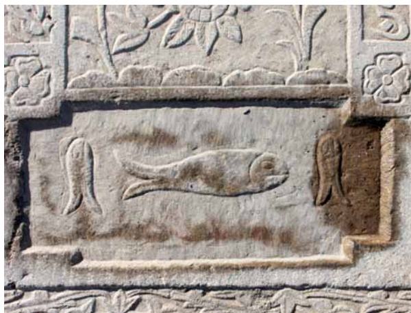
تصویر ۲۰- طشت آب و ماهی، آرامگاه تخت فولاد.