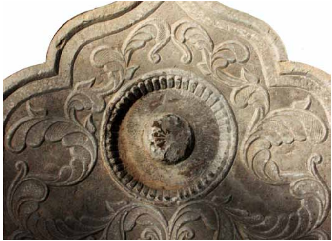
تصاویر ۱۱ و ۱۰- طشت‌آب گل نیلوفر، آرامگاه آرامنه و تخت فولاد.