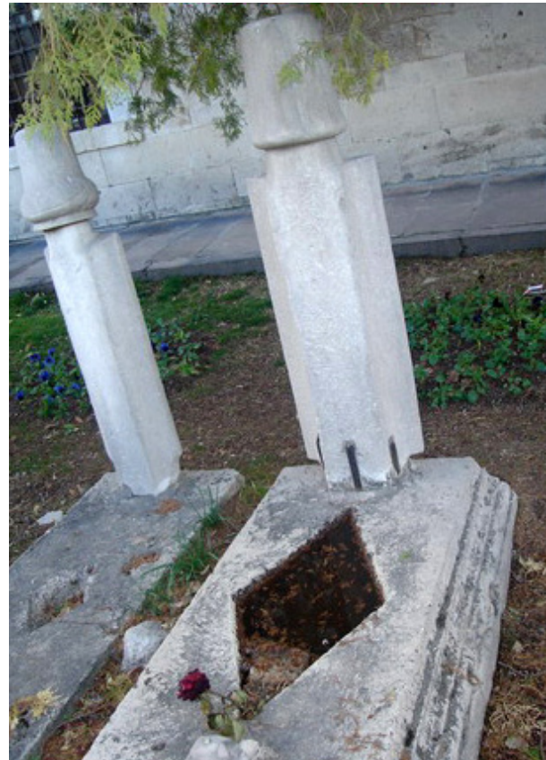
تصویر ۲- طشت آب در ترکیه.

همچنین از توجه و احترام به عناصر اربعه ناشی می‌شود. اما به طور قطع در بستر هنر و آداب ایرانی-اسلامی، طشت آبها به نحو زیبایی تلطیف شده‌اند، به گونه‌ای که هم وجوه مادی و ظاهری و هم ابعاد معنوی طشت آبها به درستی لحاظ شده است.