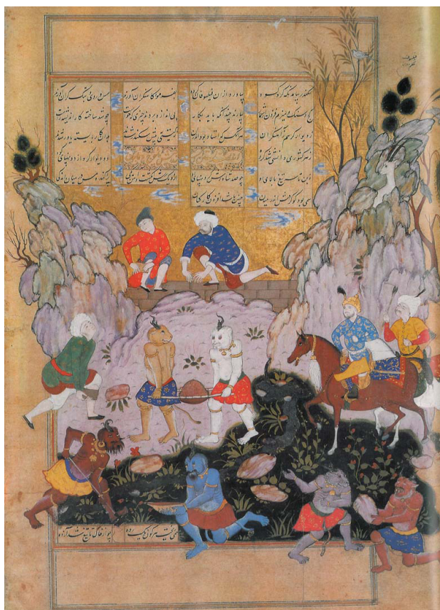
تصویر ۲- سد بیستن اسکندر پیش یا جوج و ماجوج، شاهنامه شاه اسماعیل دوم، احتمالاً قزوین. تصویر ۱- ۲- مأخذ: (سودآور، ۱۳۸۰، ۲۵۳)