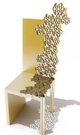
تصویر ۳. صندلی با عنوان موتیف‌های در حال پرواز، اثر حبیبه مجدآبادی، ۱۳۸۸ (www.designboom.com) مأخذ:

صندلی با عنوان «موتیف‌های در حال پرواز» اثر خانم حبیبه مجدآبادی، در تصویر ۳ نشان داده شده است. طراح این محصول، موتیف‌های هنر سنتی اسلامی در گره چینی را به کار بسته و محصولی در خور سلیقهٔ مخاطب امروزی طراحی کرده است.