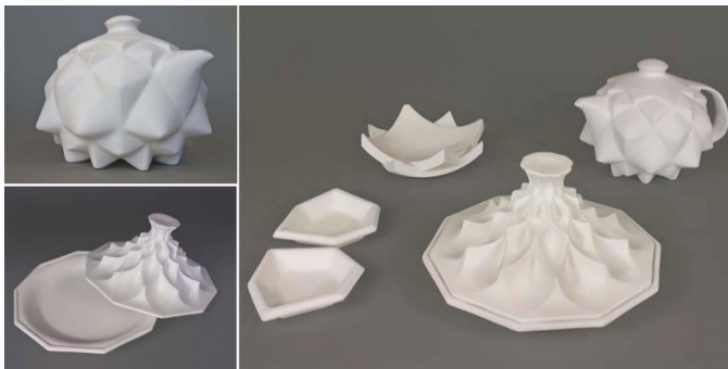
تصویر ۱. سرویس چای‌خوری مراکشی طراحی شده با الهام از عناصر معماری اسلامی. اثر ۲۰۱۱ - Edward Hale.

سرویس چای‌خوری که در تصویر ۱ مشاهده می‌شود، نمونه‌ای از این محصولات است. طراح این کانسپت، آن را مجموعه ظروف مراکشی نام‌گذاری کرده است. بر اساس گفته طراح، عناصر معماری اسلامی در این اثر، در قالبی کوچک‌تر استفاده شده‌اند تا فرم‌های آشنا در هنر اسلامی، برای کاربرد متفاوتی از گذشته به کار گرفته شود و علاوه بر آن، مخاطب به تفکر واداشته شود. همچنین طراح معتقد است ظروف این مجموعه بر مبنای فرهنگ غذایی مردم مراکش طراحی شده و برای نوع غذای مصرفی آن‌ها کاملاً