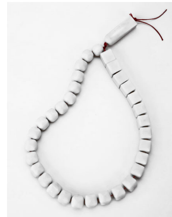
تصویر ۲. تسبیح طراحی شده با رویکرد به یکی از حکمت‌های اسلامی، اثر Erdem Akin-۲۰۱۰ (drtyaprakliyonca.blogspot.com) مأخذ:

اهمیت و جایگاه این صفات در تداعی معنویت برای مخاطب ایرانی بر هیچ‌کس پوشیده نیست. همان‌طور که در گذشته نیز اشاره شد، می‌توان ایجاد روح دینی را در گرو استفاده از اشکال و صور برخاسته از هنر سنتی دانست (نصر، ۱۳۷۳: ۳۹). اما این تنها بخشی از آن چیزی است که بتواند پاسخ‌گوی معنویت در هنر باشد؛ چراکه «یکی از مهم‌ترین مبادی هنر