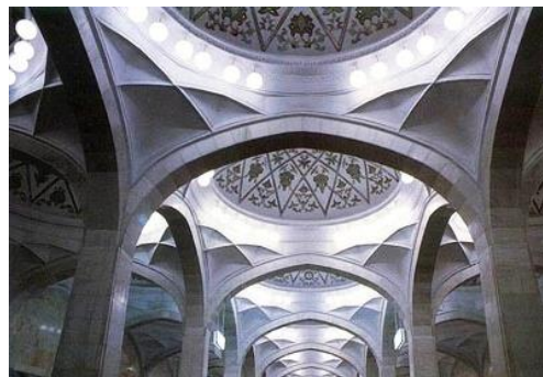
تصویر ۱۴. متروی تاشکند در ازبکستان

اشاره کرد که نقوش کارشده بر روی ستون‌های آن، شبیه به نقوش ستون‌های ایستگاه امام خمینی (ره) است؛ حال با توجه به اینکه این ایستگاه در سال ۱۹۹۴ ساخته شده (۷ سال قبل از ساخت ایستگاه امام خمینی (ره)) می‌تواند این