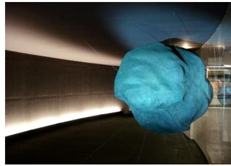
تصویر ۱۲. متروآرت، ایستگاه ناپل، ایتالیا

ایستگاه‌ها، به جز برخی نقش برجسته‌هایی که مضامینی مرتبط با نام ایستگاه‌ها دارند، تلاش درخور ملاحظه دیگری صورت نگرفته است. برای مثال، جای خالی هنرهایی مانند چیدمان، هنر مفهومی، ۱۲ کینتیک آرت (که با فضای مترو هم‌خوانی بسیار دارد) و تلفیق آن‌ها با معماری ایستگاه‌ها در متروی تهران احساس می‌شود که در این راستا می‌شد با توجه به ظرفیت‌های موجود در هنرهای سنتی ایران مثل صنایع دستی و هنرهای تزئینی ایرانی-اسلامی، آن‌ها را در قالبی مدرن و هماهنگ با فضای مترو به نمایش گذاشت و علاوه بر ایجاد فضایی بانشاط، همراه با معیارهای زیبایی‌شناسانه، ایستگاه مترو را به‌عنوان نمادی از تمدن و فرهنگ یک ملت به جهانیان بازشناساند. همان‌طور که در بعضی از متروهای جهان مانند متروی تاشکند در ازبکستان، با اسلیمی‌ها و طاق‌های محراب‌گونه و متروی کازان در روسیه با معماری و دیگر عناصر محیطی، معرف تمدن و فرهنگ سرزمینشان هستند (تصاویر ۱۵-۱۴).