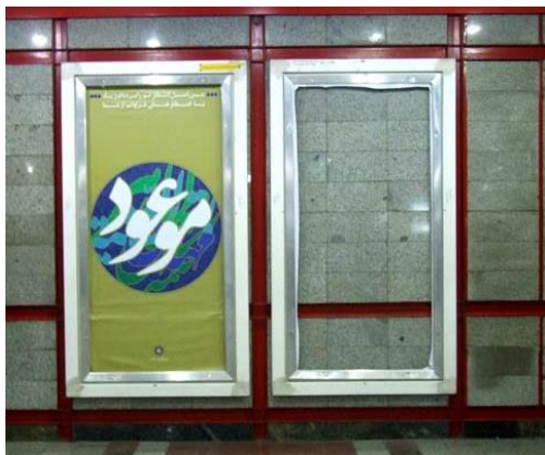
تصویر ۱۱. تبلیغات، قاب خالی، ایستگاه امام خمینی (ره)

ایستگاه‌ها بیشتر احساس شود (تصویر ۱۰). همچنین خالی ماندن بعضی از قاب‌های مخصوص تبلیغات به مدت طولانی، از بی‌توجهی مسئولان ایستگاه‌ها به این امر حکایت می‌کند (تصویر ۱۱).