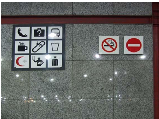
تصویر ۷. ناهماهنگی در کاربرد پیکتوگرام‌ها، سکوی ایستگاه متروی امام خمینی (ره).

تهران از عناصر ثابتی هستند که طراحی آن‌ها در تمام ایستگاه‌ها ساختاری واحد دارند و تنها در بعضی جزئیات مانند رنگ، اطلاعات نوشتاری و بعضاً جایابی آن‌ها در فضا متغیر باشد. از آنجا که این دسته از تابلوها در جهت اطلاع‌رسانی طراحی می‌شوند، وجوه کاربردی آن‌ها بر وجوه هنری و زیبایی‌شناسانه آن‌ها (مانند کاربرد عناصر تزئینی) ارجحیت بیشتری دارد؛ زیرا مخاطب به جهت نیازش که همان مسیریابی صحیح است، خواه ناخواه باید به آن توجه کند. اما این مسئله، دلیلی بر ناکارآمدی عناصر زیبایی بخش در طراحی این دسته از تابلوها نیست. چه‌بسا رعایت اصولی مانند تناسب، توازن و... در ترکیب‌بندی تابلوها و هماهنگی آن با محیط، در خلق اثری زیبا و در عین حال، خوانا مؤثر است و می‌تواند به مانایی و جلب‌نظر مخاطب کمک کند.