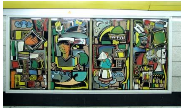
تصویر ۵. نقاشی دیواری، ایستگاه امام حسین (ع)

در ارزیابی تابلوهای اطلاع‌رسانی و جهت‌یابی در محیط‌های عمومی، باید به این نکته توجه داشت که تابلوهایی موفق به نظر می‌رسند بتوانند در رساندن پیام خود به مخاطبی که برای اولین بار وارد آن محیط می‌شود، مؤثر عمل کنند. علاوه بر شکل و رنگ و نوع خط، محل