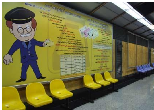
تصویر ۹. نیمکت ایستگاه امام حسین(ع)

نیمکت‌ها در سکوی هر ایستگاه با توجه به رنگ خط مربوطه رنگ‌آمیزی شده‌اند؛ البته به‌جز قسمت‌های ویژه بانوان که با رنگی متفاوت در فضا مشخص شده‌اند. در ایستگاه امام حسین(ع) که در خط ۲ مترو واقع شده است، از رنگ آبی برای نیمکت‌ها استفاده شده و قسمت‌های ویژه بانوان با رنگ زرد مشخص شده‌اند (تصویر ۹).