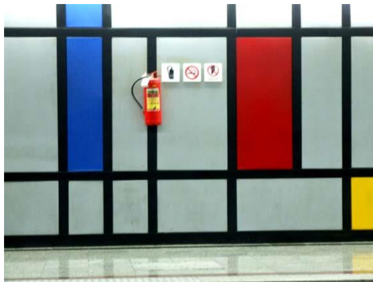
تصویر ۱. کاربرد رنگ در فضا؛ ایستگاه دانشگاه علم و صنعت

۱. سن: از آنجا که مسافران مترو از گروه‌های مختلف سنی تشکیل شده‌اند، ضروری است گرافیک محیطی، پاسخ‌گوی نیازهای همه گروه‌ها باشد. با توجه به آنچه در