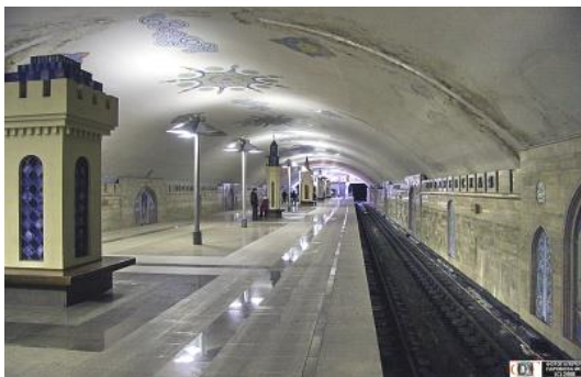
تصویر ۱۵. متروی کازان در روسیه

شبهه ایجاد شود که در طراحی ستون‌های ایستگاه امام خمینی (ره) از این نقوش الهام گرفته شده است (تصویر ۱۶-۱۷).