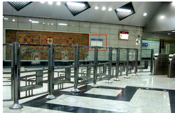
تصویر ۸. سالن اصلی ایستگاه متروی امام حسین(ع)

در این تصویر مجموعه‌ای از پیکتوگرام در سکوی ایستگاه نصب شده است که اغلب این تصاویر ناکارآمد هستند؛ مثلاً کاربرد نشانه نمایانگر کافی‌شاپ یا روزنامه‌فروشی در سکوی ایستگاه، غیرمنطقی به نظر می‌رسد.