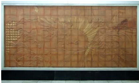
تصویر ۶. نقش برجسته، سفال، ایستگاه امام حسین (ع)

تهران از عناصر ثابتی هستند که طراحی آن‌ها در تمام ایستگاه‌ها ساختاری واحد دارند و تنها در بعضی جزئیات مانند رنگ، اطلاعات نوشتاری و بعضاً جایابی آن‌ها در فضا متغیر باشد. از آنجا که این دسته از تابلوها در جهت اطلاع‌رسانی طراحی می‌شوند، وجوه کاربردی آن‌ها بر وجوه هنری و زیبایی‌شناسانه آن‌ها (مانند کاربرد عناصر تزئینی) ارجحیت بیشتری دارد؛ زیرا مخاطب به جهت نیازش که همان مسیریابی صحیح است، خواه ناخواه باید به آن توجه کند. اما این مسئله، دلیلی بر ناکارآمدی عناصر زیبایی بخش در طراحی این دسته از تابلوها نیست. چه‌بسا رعایت اصولی مانند تناسب، توازن و... در ترکیب‌بندی تابلوها و هماهنگی آن با محیط، در خلق اثری زیبا و در عین حال، خوانا مؤثر است و می‌تواند به مانایی و جلب‌نظر مخاطب کمک کند.