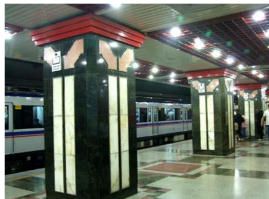
تصویر ۱۶. ستون ایستگاه امام خمینی (ره)