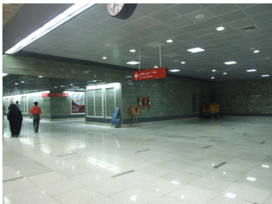
تصویر ۲. ایستگاه قیطریه

۱. معماری و وسعت: در ایستگاه‌های عمیق و بزرگ، امکانات و فضاهای بیشتری برای اجرای طرح‌های گرافیکی وجود دارد. همچنین مسافران زمان بیشتری را در ایستگاه سپری می‌کنند. در برخی از ایستگاه‌های متروی تهران مانند میدان انقلاب و تجریش و قیطریه که از وسعت زیادی برخوردارند، به این شاخصه در طراحی عناصر محیطی کمتر توجه شده و کمبود آثار هنری متنوع و ایده‌های نو در طراحی فضاهای مختلف از جمله راهروها و سالن بلیت این ایستگاه‌ها قابل مشاهده است (تصویر ۲).