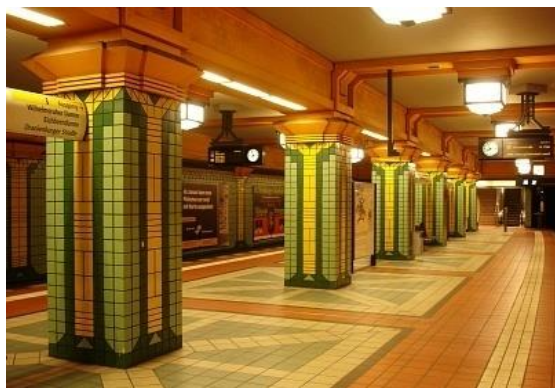
تصویر ۱۷. ستون ایستگاه مترو در برلین