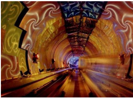
تصویر ۱۳. نئون آرت، ایستگاه شانگهای، چین