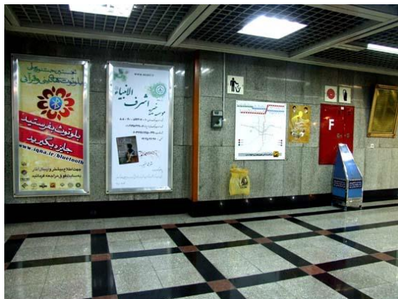
تصویر ۱۰. ایستگاه دانشگاه امام علی (ع)

تابلوه‌های تبلیغاتی در اندازه‌های بزرگ و کوچک در ایستگاه‌های متروی تهران به چشم می‌خورند؛ اما گاهی اوقات حضور بیش از حد و حساب‌نشده آن‌ها در دیواره ایستگاه‌ها باعث شده است جای خالی طرح‌ها و ایده‌های نو در ایجاد فضایی هنری و خلاقانه و متناسب با هویت