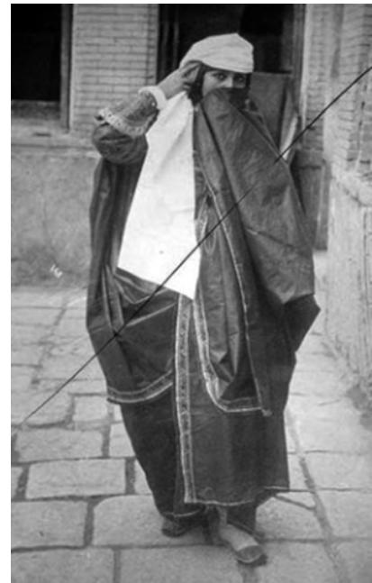
تصویر ۶- زن قاجار به روایت عکس‌های آن دوره.