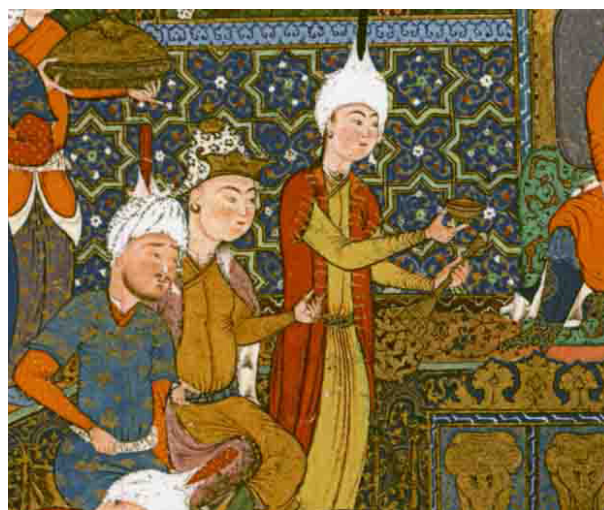
تصویر ۱۰- نمونه ای از چهره های مصور در نگاره های ایرانی عصر صفوی.

استفاده از نقش اسب در آثار اویسی نیز ارتباط تنگاتنگی با جایگاه این حیوان در ادبیات فارسی و فرهنگ ایرانی دارد؛ چنانکه اسب را تربیت شده ایرانیان دانسته اند و خاستگاه و پرورشگاه آن را نیز سرزمین ایران بر شمرده اند (ماحوزی، ۱۳۷۷، ۲۱۱-۲۱۰) (جدول ۱: تصویر ۲). بنابراین هنرمند در اینجا نیز از نقش مایه ای سنتی بهره برده است؛ مطابق تصویر ۷، از نقش این حیوان در تصویرسازی نگاره های شاهنامه ی فردوسی در صحنه های جنگ نیز استفاده شده است که ارتباط این نقش حیوانی با ادبیات فارسی را نشان می دهد. علاوه بر آن، در هنر ایران قبل از اسلام نیز، این نقش مایه حیوانی در هنرهای مختلف به کار رفته است. تصویر ۸، نمونه ای از بشقاب های فلزی دوره ساسانی است که در