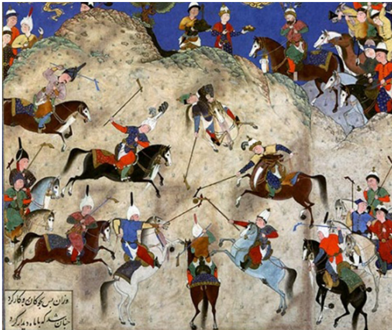
تصویر ۷- نقش اسب در نگارگری عصر صفوی.

شکل می‌گیرد و داشتن زبانی مشترک میان مفسر و متن نیز در این راه لازم است. نقاش سقاخانه با متنی که ترکیبی از عناصر و نقوش سنتی و مذهبی بود و با استفاده از زبانی که ریشه در سنت‌های ایرانی و ملی داشت، در صدد القای هویتی بومی بوده است؛ زبان هنرمند در مقام یک مفسر با سنت‌ها و پیشینه‌ی فرهنگی‌اش گره خورده و این را می‌توان در آثارش به وضوح مشاهده نمود. او در دوره‌ی زمانی خود زندگی می‌کند، اما نقوشی را به کار گرفته است که محصول زمانه‌ی او نبوده‌اند. در واقع این نقوش را از گذشته به دوره‌ی خود منتقل کرده و با تفکر امروزی خود با آن به گفتگو نشسته است. به عبارت دیگر، وی با نوعی فاصله‌ی زمانی روبروست. البته او همراه با این انتقال، از توجه به سنت‌ها نیز غافل نمانده، بلکه از سنت‌ها در جهت معنابخشیدن به اثر هنری خویش بهره جسته