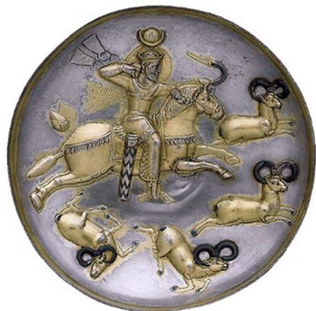
تصویر ۸- نقش اسب در هنر ساسانی.