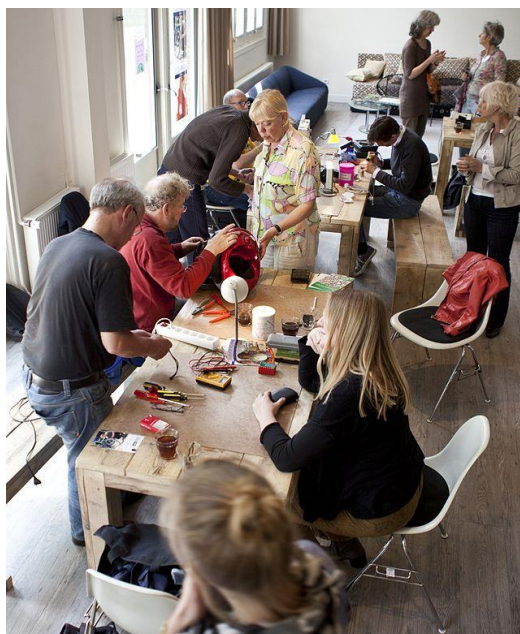
تصویر ۱. نمایی از کافه تعمیرات

دام‌داران)، سیستم خدمات مشترک برای پیشگیری و مراقبت‌های بهداشتی ارزان‌قیمت (با شرکت‌دادن مستقیم شهروندان نیازمند در مراحل تصمیم‌گیری) و برنامه‌هایی در جهت توسعه شهری و منطقه‌ای (با توسعه اقتصاد بومی و شکل‌گیری حالت‌های جدید از سازمان‌های غیرانتفاعی مردم‌نهاد) اشاره کرد (Hatef, 2012: 19-22); برنامه‌هایی که هم‌اکنون در بسیاری از کشورهای توسعه‌یافته در حال توسعه و پی‌گیری هستند. در ادامه، شرح سه نمونه از پروژه‌های موفق جهانی با همین رویکرد، می‌آید. کافه‌تعمیرات: ۱۶ به نظر می‌رسد در زندگی مصرفی امروز، دوراندختن چیزها به عادت نامطلوب تبدیل شده است. مهارت‌های تعمیراتی به فراموشی سپرده شده‌اند و جامعه، ارزشی برای این مهارت‌ها قائل نیست. اولین کافه‌تعمیرات در سال ۲۰۰۹ در آمستردام و با هدف به‌وجودآوردن تغییر در طرز تفکر مردم و همه‌گیرکردن فرهنگ تعمیرات در جامعه به وجود آمد. در کافه‌تعمیرات که محلی رایگان برای همه است،