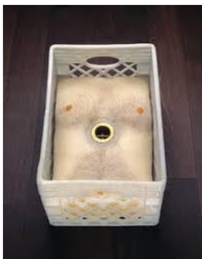
تصویر ۹. رابرت گوبر، بدون عنوان، ۱۹۹۹ (این تصویر، جایگزین اثر مورد بحث شده است)