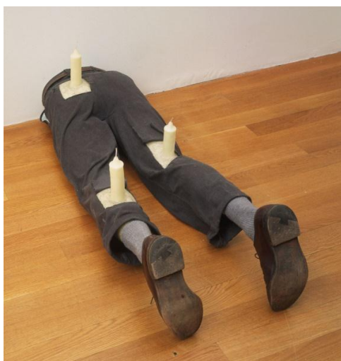
تصویر ۳. رابرت گبر، بدون عنوان، ۱۹۹۱

به عنوان مثال تصویر ۳ که در زمره معروف‌ترین مجموعه هنری رابرت گبر است، پاهای مردانه با لباس رسمی و موی طبیعی انسان را نمایش می‌دهد که در ساختاری سوررئالیستی از دیوار بیرون زده یا در آن فرو رفته است.