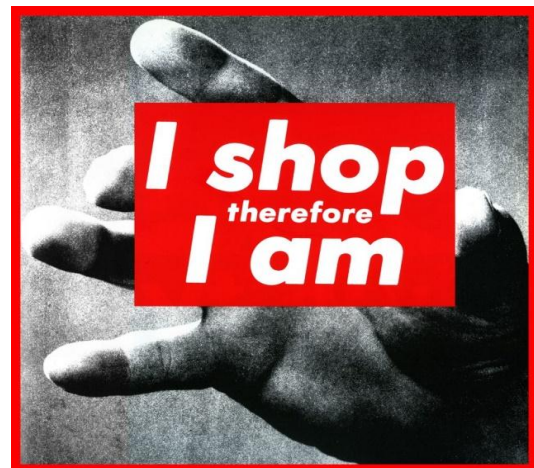
تصویر ۱. باربارا کروگر، بدون عنوان، ۱۹۸۷، ۳۰۴/۸ * ۳۰۴/۸ سانتیمتر

همگی شاهدی بر این هستند که بدن، به موضوع رستگاری تبدیل شده است» (بودریار، ۱۳۹۰: ۱۹۸). بدین‌سان بدن در چنین کارکرد ایدئولوژیک و اخلاقی جدید به تمام معنا جایگزینی برای غایت هستی‌شناختی انسان می‌شود. اثری از باربارا کروگر ۳۲ هنرمند مفهومی معاصر، با نمایش عبارت «خرید می‌کنم پس هستم» (تصویر ۱)، همین مفهوم را به روشنی در عرصه تجسمی بازسازی می‌کند. آثار کروگر با ساختاری کلاژمانند، رنگ‌های محدود، عناصر نوشتاری ساده و بهره‌گیری از عبارات اعتراضی شناخته می‌شود. آثار این هنرمند ضمن سادگی ظاهری، حاوی دلالت‌های چندگانه پساساختارگرایانه است و مفاهیم فکری معاصر را بیانی تجسمی می‌بخشد. اثر مذکور ضمن «از آن خودسازی» ۳۳ و «هجو» ۳۴ کوگیتوی ۳۵ دکارتی بنیاد هستی‌شناختی انسان امروز را معرفی می‌کند.