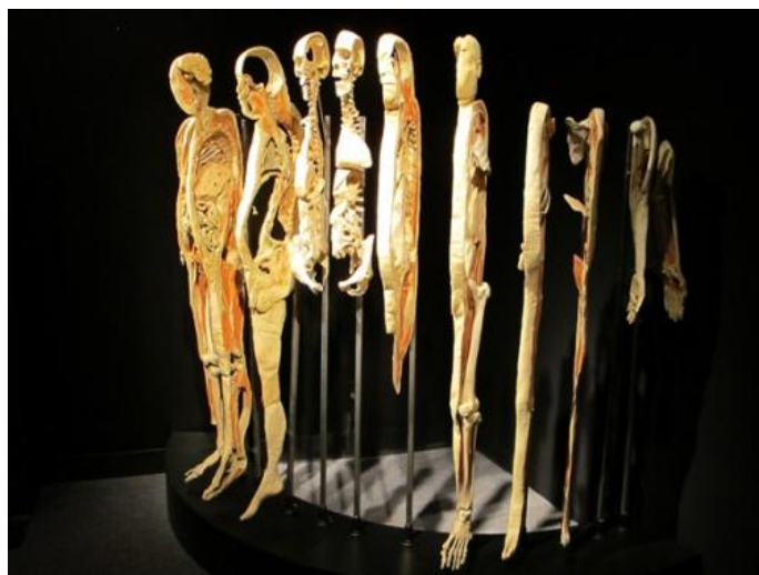
تصویر ۴. گونتر فون هاگنز، دنیا‌های تن، ۲۰۱۳

خارج از جریان رسمی هنر، برخی تجربیات در سایر حوزه‌ها نیز بر شیء‌شدگی تن صحنه گذاشته‌اند. شاید جنجالی‌ترین این تجربیات را بتوان به هاگنز ۴۳ ، پزشک آلمانی و میدع روش پلاستینه‌کردن ۴۴ ، نسبت داد. او توانست روشی را کشف کند که به مدد آن، تن واقعی انسان به ماده ساخت مجسمه بدل می‌شود. در این روش آب و چربی درون بافت بدن مرده با نوع خاصی از پلاستیک جایگزین می‌شود تا از فساد و تخریب در امان بماند. هاگنز با این روش تعداد بی‌شماری جسد و قطعات بدن انسانی را به مجسمه‌های ماندگار بدل کرد و آن‌ها را به‌مثابه اثر هنری به نمایش عموم درآورد. طبعاً انتقادهای