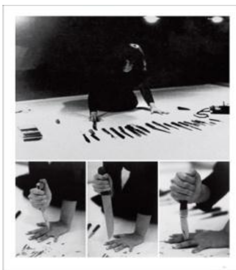
تصویر ۶. مارینا آبراموویچ، ریتم ۱۰، ۱۹۷۳