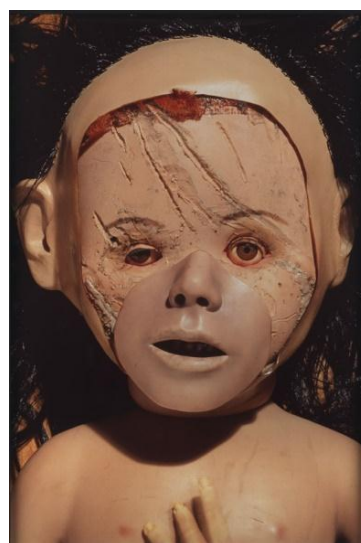
تصویر ۵. سیندی شرم، بدون عنوان، ۱۹۹۵. ۱۲۱/۹ * ۸۱/۳ cm

آگاهانه درحوزه دلالت‌گری رخ می‌دهد که به دگرگون کردن معنا می‌انجامد؛ اما آشنایی‌زدایی به ایجاد گسیختگی در عادات معنایی بسنده می‌کند.