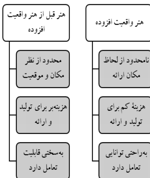
تصویر ۱. مقایسه هنر واقعیت افزوده و هنر قبل از هنر واقعیت افزوده مأخذ: (جرامینکو، ۲۰۱۲: ۴۵۱)

با آنکه آثار هنری ایجادشده مجازی هستند، نمایش آنها به‌صورت عملی واقعی صورت می‌پذیرد و هر مخاطب توانایی بازتولید آنها را دارد. همچنین نباید این آثار را توهمی یا خیالی تصور کرد. در این هنر، هزینه پرداختی به