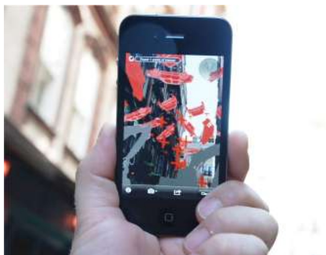
تصویر ۳. استانبول نامرئی: پویایی‌شناسی شهری اثر گروه پاتو

گونه‌ای از توجه و دید کاربر خارج شوند که به تعبیری او را از خواب زندگی بیدار نکنند. به‌منظور تقویت تن‌یافتگی مخاطب اثر واقعیت افزوده، تلاش‌ها برای نامرئی‌کردن این تکنولوژی از دید کاربر آن بوده است. دلیل این تلاش‌ها ایجاد نوعی فهم و دریافت کاربر از این رسانه است که با دریافت طبیعی وی، یعنی همان گونه که در زندگی معمول خود دارد، تفاوتی نداشته باشد. با وجود این، توجه به دو نکته لازم است. نکته اول این است که تکنولوژی باید شفافیت لازم را داشته باشد؛ به این منظور که برای ادراک مخاطب را به‌سمت شیء خارجی هدایت کند. البته منظور تنها شفافیت فیزیکی نیست. برای مثال، شفافیت در عینک‌های شیشه‌ای گوگل؛ بلکه منظور حذف هرگونه عامل مداخله‌گر در جهت‌دهی التفات سوژه است. به این معنا که سوژه باید بدون هیچ واسطه‌ای به ابژه خارجی هدایت شود. بروز هرگونه مداخله باعث تغییرات و تعدیلات در فرایند ادراک می‌شود. نکته دوم این است که ابژه‌ای که به سوژه عرضه می‌شود، باید از نظر نوع‌شناسی برای ادراک سوژه معمول باشد و در تضاد با تجربه‌های سوژه نباشد. ابژه حتی اگر به لحاظ محتوا متفاوت است، باید به‌صورت کاملاً طبیعی در زندگی سوژه مدرک جاسازی شود (لیبراتی ۴ ، ۲۰۱۲: ۱۶). به دیگر سخن، ابژه باید به‌عنوان ابژه معمول برای سوژه قابل تشخیص و تمییز باشد و با نمونه طبیعی آن شباهت کافی داشته باشد.