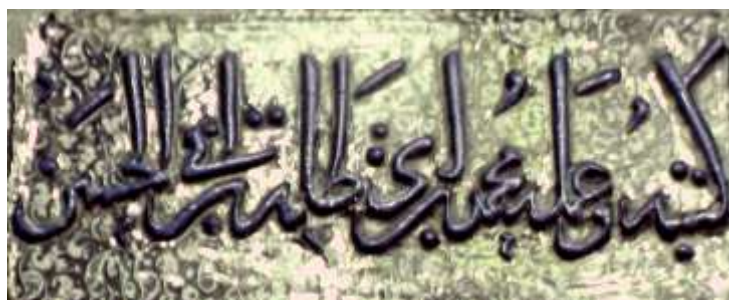
تصویر ۴. رقم سازنده و کاتب کاشی‌های لوح مزار