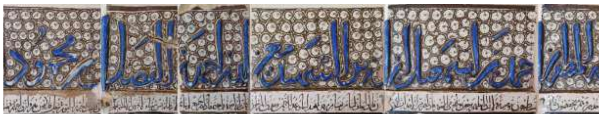
تصویر ۱۰. کتیبه کاشی بانی اثر «المظفر بن احمد بن اسمعیل ابن الوزير الشهيد معین الدین احمد بن فضل بن محمود»

الراحمین کتبه ابوزید امجره ع... فی الثانی من رجب سنه ۶۰۲هـ»