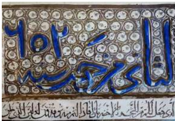
تصویر ۲. کتیبه‌کاشی حرم حضرت معصومه (س) مشتمل بر تاریخ ساخت اثر «رجب ۶۰۲»

«کتبه و عمله محمد ابن ابی طاهر ابن ابی الحسن» ۱۲