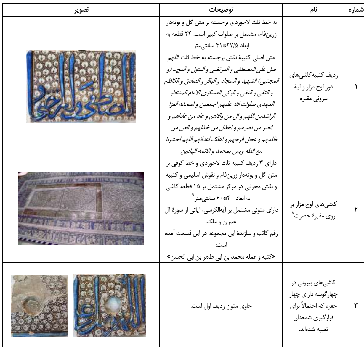
جدول ۱. جدول معرفی قسمت‌های مختلف مزار