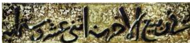
تصویر ۳. کتیبه‌کاشی‌های حرم امام رضا(ع) به تاریخ «ربیع الآخر ۶۱۲» مأخذ: (فغفوری و دیگران، ۱۳۹۳: ۹)