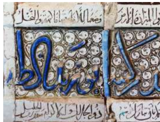
تصاویر ۶ و ۷. دو کتیبه کاشی مزین به نام ابوزید در قسمت‌های بالایی و پایینی دیواره مزار