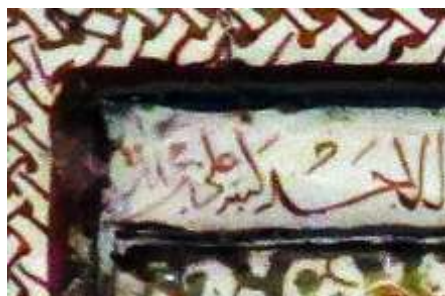
تصاویر ۸ و ۹. رقم علی بن محمد در کاشی‌های کنج مقبره. در تصویر سمت چپ، تاریخ خلق اثر مخدوش شده است.