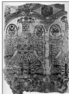
تصویر ۲. پارچه عقاب دوسر، دوره مرابطون

منسوجات مرابطون از نیمه اول قرن دوازدهم میلادی/ ششم هجری، ویژگی و تکنیک خاص خطوط ریز بافته‌شده بین دو رنگ کنار هم و خطوط برجسته را به نمایش