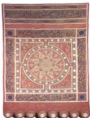
تصویر ۵. پرچم موحدون

پیروز جنگ آلاکوس ۳۰ ، حکم منع لباس‌های ابریشمی فاخر و نهی زنان از استفاده از لباس‌های مجلل را می‌دهد. ابن خلدون معتقد است که در طی یک دوره از سلسلهٔ محافظه‌کار موحدون، شکست در برابر سنن دیرینه رخ داده است و شاهد تولید مجدد منسوجات مجلل، البته با نقوش تزئینی کمتر هستیم (Partearroyo, 1992: 109). از نشانه‌های دیگر، باید از پرچم آنها یاد کرد که با الیاف طلا بافته شده است (بیکر، ۱۳۸۵: ۵۹).