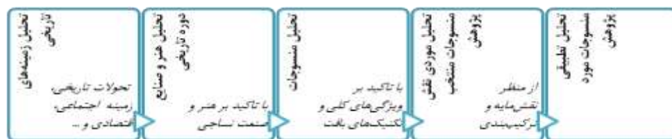
تصویر ۱. چارچوب پژوهش هر دوره تاریخی