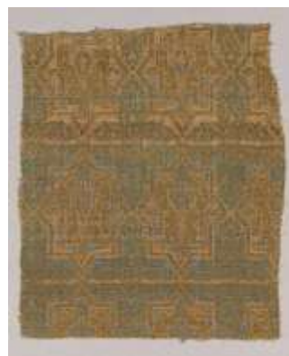
تصویر ۴. ابریشم زربفت قرن ۱۳ میلادی

این مضامین، نقش‌مایه‌های پیشین را چنان با اصول ارزشی پیوند داد که خود زایندهٔ نقش‌مایه‌های جدیدی گشتند و هنر اسلامی ایران را صورت و بیان بخشید. ایران نه تنها سنت‌ها، فرهنگ و هنر خویش را از دست نداد، بلکه در تحول هنر و تمدن اسلامی نقشی بسزا داشت. در این دوره، تجارت ایران با کشورهای اسلامی توسعه یافت که بخشی از آن، همان بازارهای کهن قرار گرفته در حوزهٔ تمدن اسلامی جدید بودند. فتوحات نظامی مسلمانان در مدیترانه و پیشروی آنها تا جبل الطارق، تأثیر مهمی بر گسترش صنعت و تجارت نهاد (معتضد، ۱۳۶۶: ۳۲، ۳۱).