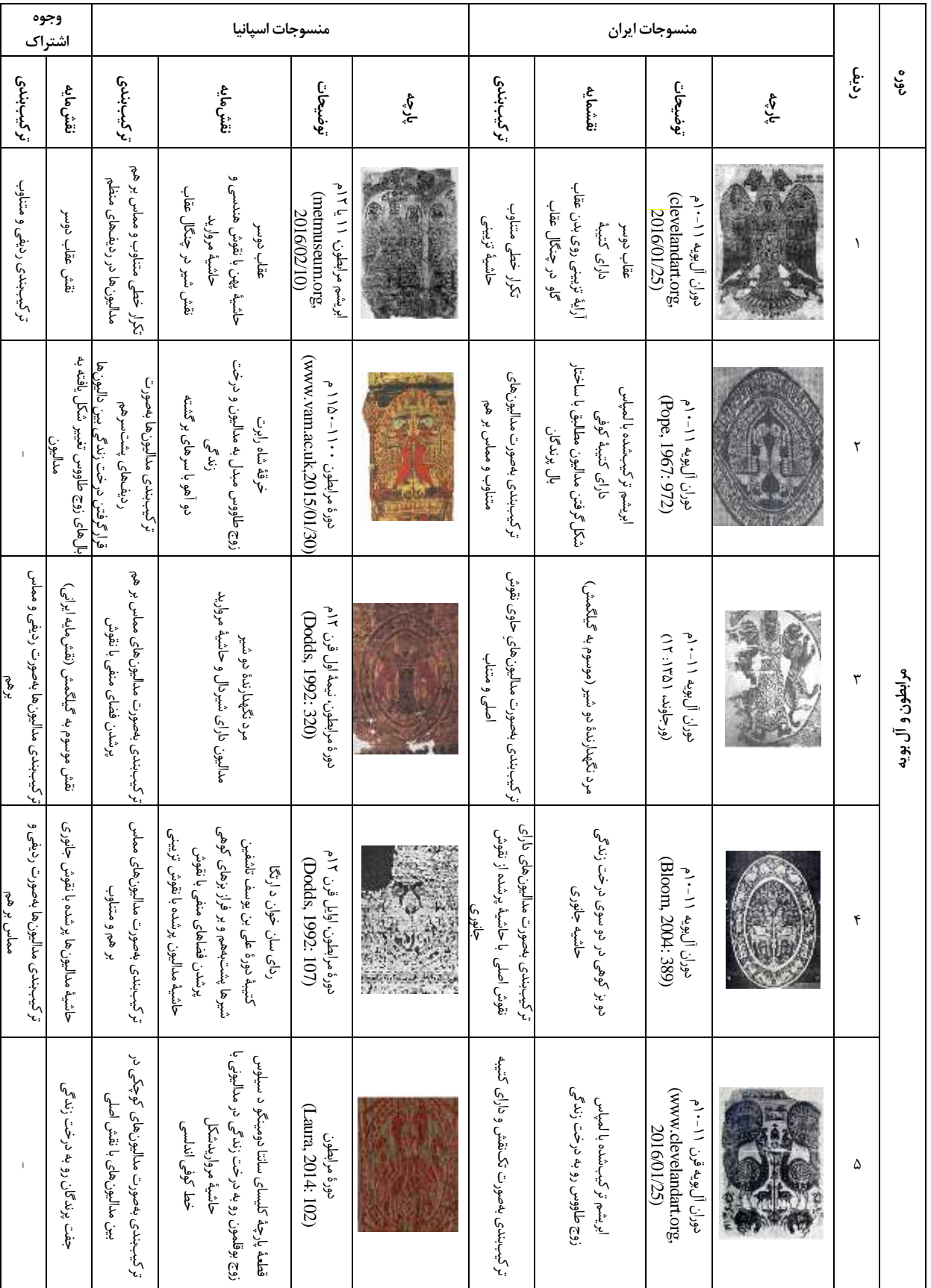
جدول ۱. مقایسه تطبیقی نقوش منسوجات ایران و اسپانیا