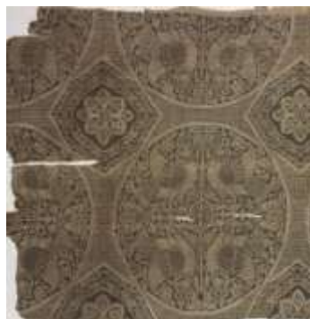
تصویر ۸. ابریشم سلجوقی قرن ۱۲ م

بررسی آثار هنری دوره سلجوقی، نشانگر طیف گسترده‌ای از آثار ماندگار در زمینه‌های نساجی، سفالگری، عاج‌کاری، فلز‌کاری، معماری و... است. این پیشرفت‌های کم‌نظیر در عرصه هنر که آن را حد بلوغ همه‌جانبه هنرهای ایران نیز نامیده‌اند (ویلسن، ۱۳۱۷: ۱۴۲)، همچنان تا زمان حکومت مغولان قابل مشاهده بوده است (حلمی احمد، ۱۳۸۳: ۱۸۶). نوآوری‌های هنرمندان ایرانی در این دوره، بر گستره وسیعی از کشورها تأثیر گذاشت (کاتلی و هامبی، ۱۳۷۶: ۱۰۲). در صنعت نساجی نیز این پیشرفت‌ها دیده می‌شود. تصرف کارگاه‌های نساجی آل‌بویه، نقش‌ونگارهای آنان را در اختیار