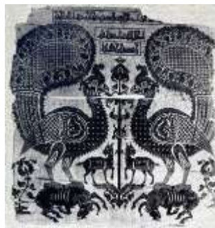
تصویر ۶. ابریشم طاووس‌های بزرگ، قرن ۱۱ میلادی

از ویژگی‌های منسوجات این دوران، می‌توان به تداوم نقوش ساسانی و ترکیب‌بندی آنها به‌همراه تزئینی‌تر شدن نقوش و تفصیلی‌تر شدن جزئیات نقش‌مایه‌های اسلیمی و برگ‌نخلی اشاره کرد که نقوش دارای قاب یا بدون آن را در طرح پارچه شکل داده‌اند (مکداول، ۱۳۷۴: ۱۵۸). ترکیب‌بندی لوزی با زوج پرنده‌هایی که به شکل مدالیون آمده، دارای ظرافت بیشتری از قبل هستند و حاشیه‌های دارای حیوانات متعدد، به‌همراه کتیبه نام مالک و بافنده به این دوران تعلق دارد (Kuhnel, 1960: 3084, 3085). تصویری از پوشش قبری از خاندان امرای حارثی (تصویر ۶) نقش طاووس‌های بزرگی را با پنجه‌های قرارگرفته بر پشت گاو نشان می‌دهد که به‌صورت متقارن رو به درخت زندگی قرار دارد (Shepherd, 1960: 3096). در بین دیگر کشورهای اسلامی، ایرانیان بیش از همه از نقش انسان استفاده کرده‌اند (طالب‌پور و خطایی، ۱۳۹۰: ۴۹). یکی دیگر از نقوش متداول، عقاب دوسر است که در برخی موارد، بر روی بدن آن، تصویر پیکره انسان بال‌داری ترسیم شده و در زیر پنجه‌های آن، حیوانات در حال شکار دیده می‌شود (تصویر ۷) که حاشیه آن را کتیبه ادعیه و نقوش گیاهی یا درختان نخل تشکیل