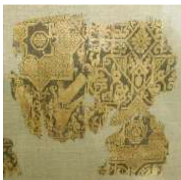
تصویر ۹. ابریشم سلجوقی قرن ۱۲ م

روند رو به تکامل هنر این دوران قرار داد و باعث شد ایران به یکی از مهم‌ترین صادرکنندگان منسوجات به کشورهای مدیترانه بدل گردد (فریه، ۱۳۷۴: ۵۵؛ دیماندا، ۱۳۶۵: ۲۴۴). در این دوران، ابریشم از مهم‌ترین و پرکاربردترین مواد پارچه‌بافی بود و در تولید پارچه‌های زربفت دیبا، مخمل و... به کار برده می‌شد (اتینگهاوزن و گرابر، ۱۳۸۴: ۸۵). رواج پارچه‌های سفت‌تاب و شل‌تاب، باعث تکامل بافت جنافی پارچه‌های نخی شد و رگه‌های اریب را بر پارچه‌ها نمایان ساخت (فریه، ۱۳۷۴: ۱۵۸).