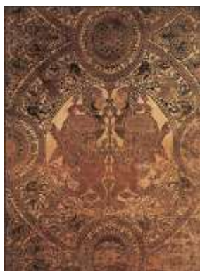
تصویر ۳. پارچه ابریشم، دوره مرابطون

استفاده از دوسری تاروپود برای ایجاد زمینه و طرح روی زمینه و تکنیک به‌هم‌پیوستن نخ‌های نازک چرم زرانودود برای تولید پارچه ابریشم نقش برجسته و لانه‌زنبوری، تنها به این گروه از ابریشم‌های اسپانیای اسلامی اختصاص دارد (Partearroyo, 1992: 106).