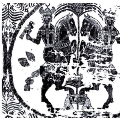
تصویر ۱۲. پارچه با نقش سواران بر اسب

شکل صلیب شکسته بر روی شانه‌ها حکایت از کاربرد نماد خورشید در اینجا دارد (پوپ، ۱۳۸۰: ۲۳۷). فضاهای خالی طرح نیز با نقوش گیاهی پر شده است.