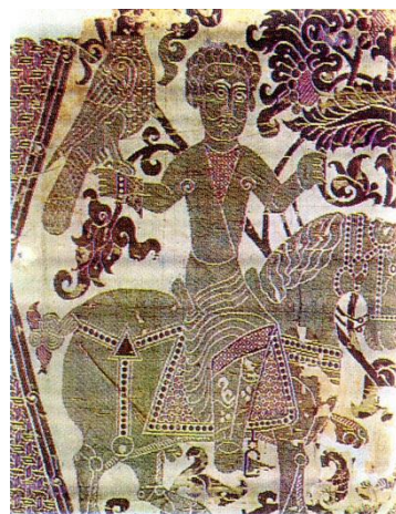
تصویر ۱۴. پارچه با نقش انسانی در کنار نقوش حیوانی و گیاهی، احتمالاً از ری

رسم شکار در فرهنگ ایران سابقه طولانی دارد و به‌عنوان آیینی پهلوانی در شاهنامه ذکر شده است. از سوی دیگر از دیرباز، پرهیز از عناصر پلید و اعتقاد به پدیده‌های خوش‌یمن و بابرکت نیز در شکل‌گیری باورهای ایرانیان نقش ایفا کرده است؛ چنان‌که عقاب پرنده‌ای است که از زمان هخامنشیان به فال نیک گرفته می‌شد. همچنین نقوش گیاهی اطراف پادشاه بر پیچیدگی تصویر افزوده است (تصویر ۱۴).