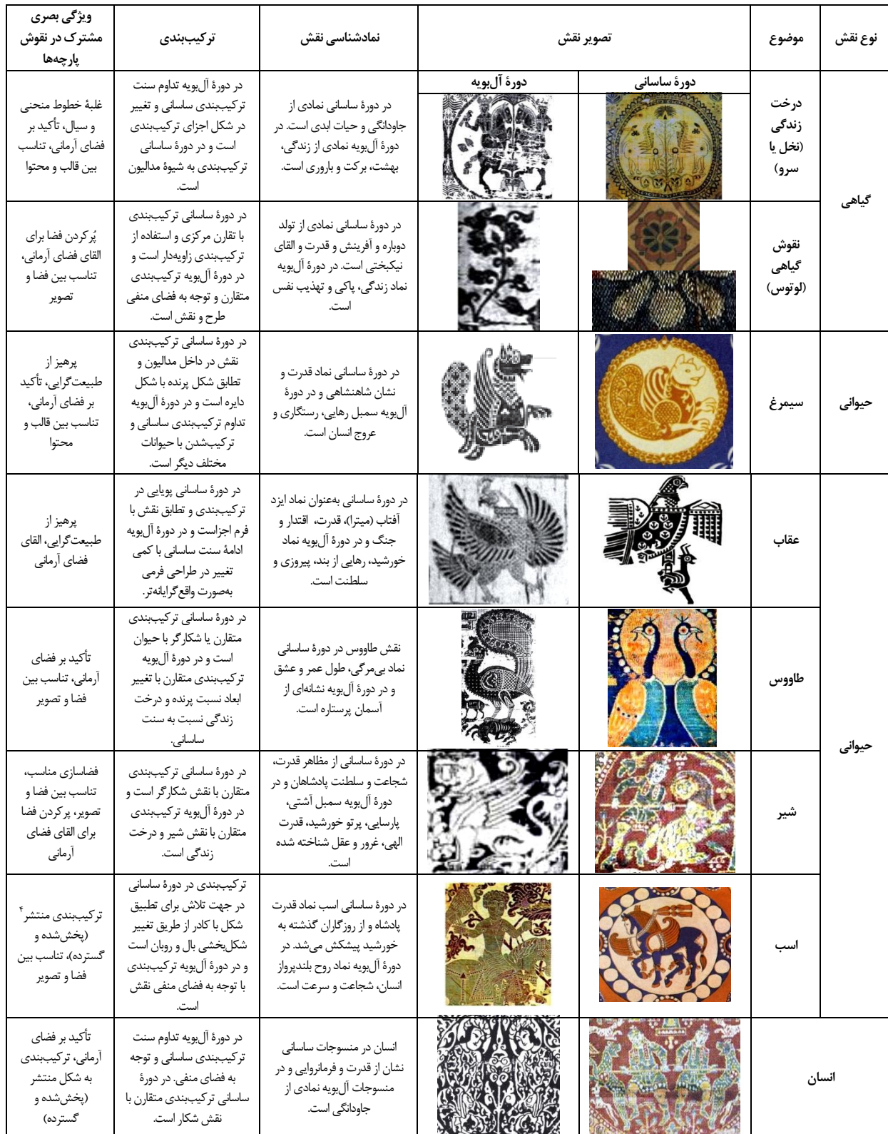
جدول ۱. مقایسه تطبیقی نمادگرایی نقوش مشترک منسوجات ساسانی و آل بویه