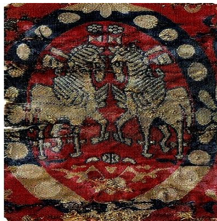
تصویر ۱۱. نقش اسب در منسوجات ساسانی

در تصویر ۱۱ (پارچه ساسانی)، اسب روبان موجی که در فضا معلق است بر گردن دارد که همان دستارشاهی یا دیهیم است. دستار در فرهنگ و ادبیات پارسی به معنای شال و دستمال است که از دو بخش دست و آر تشکیل شده است. در فرهنگ فارسی یکی از معانی دست پیروزی است. بنابراین می‌توان چنین نتیجه گرفت که دست در ترکیب «دست-آر» می‌تواند معنی آورنده پیروزی را در خود داشته باشد و این صفت یعنی آورنده پیروزی از صفات و ویژگی‌های فره ایزدی یا همان فره کیانی اوستاست (سودآور، ۱۳۸۴: ۳۴). همچنین در تصویر ۱۱، در اطراف مدالیون و بالای سر اسب‌ها گل لوتوس یا نیلوفر مشاهده می‌شود که در فارسی گل آزاد یا گل زندگی و آفرینش نامیده می‌شود و در اساطیر ایران جای نگهداری تخمه یا فر زرتشت است. این گل اسطوره‌ای نماد قدرت و القای نیکبختی است که از جانب ایزدبانوی ناهید به شاه و قلمرو شاهنشاهی وی تقدیم می‌شود (سودآور، ۱۳۸۴: ۸۳).