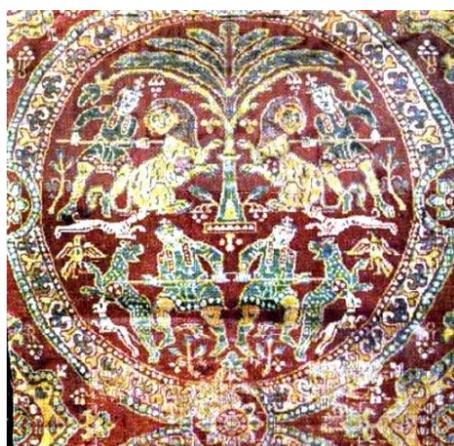
تصویر ۹. نقش شیر در منسوجات ساسانی