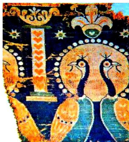
تصویر ۸. نقش طاووس در منسوجات ساسانی