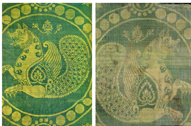
تصویر ۳. پارچه ابریشمی با نقش سیمرغ، سده ۶ میلادی، موزه ویکتوریا و آلبرت لندن

از دیگر نکات مهم در دوره ساسانی و آل‌بویه، قرارگرفتن نقوش در قاب‌های مدور و طراحی در حدفصل قاب‌های مدور است که به نوعی می‌توان از آن‌ها به‌عنوان طرح مکمل یاد کرد. معمولاً طرح آن‌ها عبارت از چهار جفت یا تک‌پرنده یا حیوان است که به دور یک نقطه مرکزی چیده شده‌اند و تزیینات برگ نخلی، آن‌ها را از هم جدا کرده و فضا را پر کرده است (محمدحسن، ۱۳۶۶: ۲۳۱). با وجود این نقش پرنده در منسوجات آل‌بویه، با معانی نمادین و غالباً با مفهوم مرگ یا جاودانگی همراه گشته و بیشتر با مضامین دینی همراه بوده است.