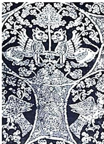
تصویر ۲. نقش درخت زندگی با شیران بال دار و عقاب محافظ در منسوجات آل بویه مأخذ: (فتحی، ۱۳۸۶: ۷۴)