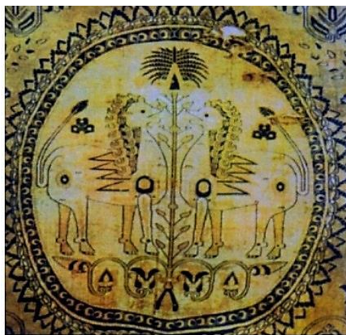
تصویر ۱. نقش درخت زندگی (نخل) با شیران محافظ در منسوجات ساسانی، سده ۸-۹م مأخذ: (ریاضی، ۱۳۸۲: ۴۶)

گاهی درخت با شاخ و برگ گسترده و در برخی موارد کاملاً منسجم، ساده و هندسی دیده می‌شود. در هنر اسلامی نقش درختان یادآور باغ‌های بهشتی است. درخت نمادی از نور و نیروی الهی، دانش، خردورزی و در نتیجه همواره به عنوان تجسدی از اصل خیر مورد احترام بوده است (پورخالقی، ۱۳۸۱: ۹۳). حلقه شبیه دانه‌های مرواریدمانند (مدالیون) اطراف طرح نشان از ارزش فراوان مروارید دارد که در اعماق آب و در دل صدفی نرم شکل می‌گیرد؛ پس می‌تواند نمادی از ایزدبانوی آب‌ها، یعنی آناهیتا فرض شود. دایره مدور و مزین به ردیف مرواریدها نیز می‌تواند نمادی از فره ایزدی این ایزدبانو باشد. دایره نیز نمادی از کائنات است؛ چراکه گیتی و عالم، محصور در دایره است (سودآور، ۱۳۸۴: ۷۹).