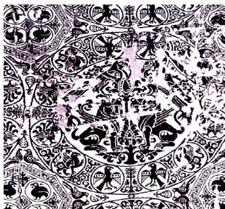
تصویر ۱۰. دو شیر در حال نگهداری از درخت زندگی