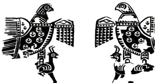
تصویر ۵. نقش عقاب در منسوجات ساسانی

تصویر ۷، پارچه ابریشم با نقش طاووس مکشوفه از شهر ری است که به‌عنوان پوشش قبر کاربرد داشته است. نقش این پارچه، دو طاووس بزرگ متقارن رو به درخت زندگی است که پنجه‌هایش پشت گاو را گرفته است. ۳ مفهوم کتیبه نیز آرزوی بقا و طول عمر برای فرد متوفی است. طاووس در منسوجات آل‌بویه نشانه‌ای از آسمان پرستاره است (گیرشمن، ۱۳۷۰: ۲۳۶). نقش طاووس روی منسوجات ساسانی نماد سلطنت شاهان و نشان عزت و تجدید حیات نیز به شمار می‌رود (تصویر ۸).