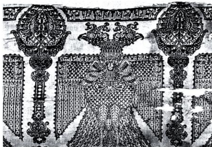
تصویر ۶. پارچه با نقش عقاب و انسان بر کفن‌های آل‌بویه