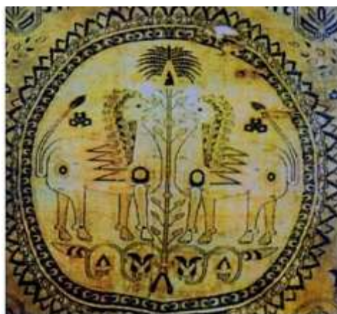
تصویر ۱. نقش درخت زندگی (نخل) با شیران محافظ در منسوجات ساسانی، سده ۸-۹م مأخذ: (ریاضی، ۱۳۸۲: ۴۶)

گاهی درخت با شاخ و برگ گسترده و در برخی موارد کاملاً منسجم، ساده و هندسی دیده می‌شود. در هنر اسلامی نقش درختان یادآور باغ‌های بهشتی است. درخت نمادی از نور و نیروی الهی، دانش، خردورزی و در نتیجه همواره به‌عنوان تجسّدی از اصل خیر مورد احترام بوده است (پورخالقی، ۱۳۸۱: ۹۳). حلقه شبیه دانه‌های مرواریدمانند (مدالیون) اطراف طرح نشان از ارزش فراوان مروارید دارد که در اعماق آب و در دل صدفی نرم شکل می‌گیرد؛ پس می‌تواند نمادی از ایزدبانوی آب‌ها، یعنی آناهیتا فرض شود. دایره مدور و مزین به ردیف مرواریدها نیز می‌تواند نمادی از فره ایزدی این ایزدبانو باشد. دایره نیز نمادی از کائنات است؛ چراکه گیتی و عالم، محصور در دایره است (سودآور، ۱۳۸۴: ۷۹).