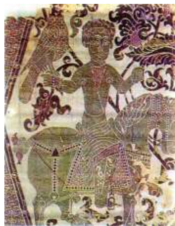
تصویر ۱۴. پارچه با نقش انسانی در کنار نقوش حیوانی و

رسم شکار در فرهنگ ایران سابقه طولانی دارد و به‌عنوان آیینی پهلوانی در شاهنامه ذکر شده است. از سوی دیگر از دیرباز، پرهیز از عناصر پلید و اعتقاد به پدیده‌های خوش‌یمن و بابرکت نیز در شکل‌گیری باورهای ایرانیان نقش ایفا کرده است؛ چنان‌که عقاب پرنده‌ای است که از زمان هخامنشیان به فال نیک گرفته می‌شد. همچنین نقوش گیاهی اطراف پادشاه بر پیچیدگی تصویر افزوده است (تصویر ۱۴).