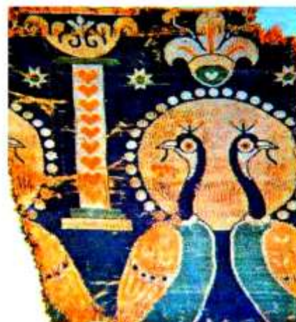
تصویر ۸. نقش طاووس در منسوجات ساسانی مأخذ: (ریاضی، ۱۳۸۲: ۴۷)