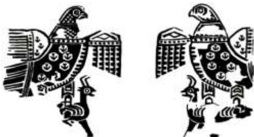
تصویر ۵. نقش عقاب در منسوجات ساسانی مأخذ: (ریاضی، ۱۳۸۲: ۴۶)

تصویر ۷، پارچه ابریشم با نقش طاووس مکشوفه از شهر ری است که به‌عنوان پوشش قبر کاربرد داشته است. نقش این پارچه، دو طاووس بزرگ متقارن رو به درخت زندگی است که پنجه‌هایش پشت گاو را گرفته است. ۳ مفهوم کتیبه نیز آرزوی بقا و طول عمر برای فرد متوفی است. طاووس در منسوجات آل‌بویه نشانه‌ای از آسمان پرستاره است (گیرشمن، ۱۳۷۰: ۲۳۶). نقش طاووس روی منسوجات ساسانی نماد سلطنت شاهان و نشان عزت و تجدید حیات نیز به شمار می‌رود (تصویر ۸).