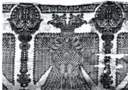
تصویر ۶. پارچه با نقش عقاب و انسان بر کفن‌های آل‌بویه