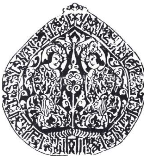
تصویر ۱۵. پارچه ابریشمی با نقوش انسان و گیاه، شهر ری، قرن ۴

این تصویر اهمیت کاربرد نمادها را در آن زمان بازگو می‌کند. برای مثال در کنار آبگیر کیهانی، درخت کیهانی می‌روید و فرشتگان هورتات و امرتات (خرداد و مرداد) وظیفه آسمانی خود را در نگهداری از درخت زندگی که نشانه سپنتیا مینو (روح مقدس) است، انجام می‌دهند (پوپ، ۱۳۸۰: ۱۰۰). در این بافته، دو فرشته به صورت دو انسان نقش شده‌اند که در طرفین یک درخت زندگی که نشانه‌ای از حیات جاویدان است، نشسته‌اند. این دو جوان نمادی از جاودانگی هستند که پادشاه رستگاران در بهشت است (پوپ، ۱۳۸۷: ج ۲، ۱۰۸۵).