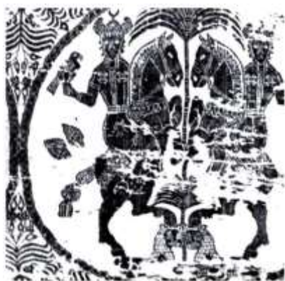
تصویر ۱۲. پارچه با نقش سواران بر اسب مأخذ: (طالب‌پور و خطایی، ۱۳۹۰: ۵۱)

شکل صلیب شکسته بر روی شانه‌ها حکایت از کاربرد نماد خورشید در اینجا دارد (پوپ، ۱۳۸۰: ۲۳۷). فضاهای خالی طرح نیز با نقوش گیاهی پر شده است.