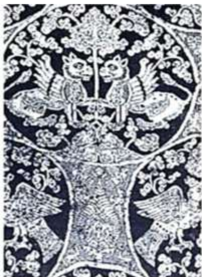
تصویر ۲. نقش درخت زندگی با شیران بال‌دار و عقاب محافظ در منسوجات آل‌بویه