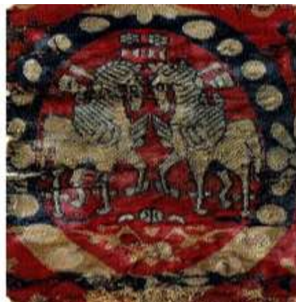
تصویر ۱۱. نقش اسب در منسوجات ساسانی

در تصویر ۱۱ (پارچه ساسانی)، اسب روبان موآجی که در فضا معلق است بر گردن دارد که همان دستارشاهی یا دیهیم است. دستار در فرهنگ و ادبیات پارسی به معنای شال و دستمال است که از دو بخش دست و آر تشکیل شده است. در فرهنگ فارسی یکی از معانی دست پیروزی است. بنابراین می‌توان چنین نتیجه گرفت که دست در ترکیب «دست-آر» می‌تواند معنی آورنده پیروزی را در خود داشته باشد و این صفت یعنی آورنده پیروزی از صفات و ویژگی‌های فره ایزدی یا همان فره کیانی اوستاست (سودآور، ۱۳۸۴: ۳۴). همچنین در تصویر ۱۱، در اطراف مدالیون و بالای سر اسب‌ها گل لوتوس یا نیلوفر مشاهده می‌شود که در فارسی گل آزاد یا گل زندگی و آفرینش نامیده می‌شود و در اساطیر ایران جای نگهداری تخمه یا فر زرتشت است. این گل اسطوره‌ای نماد قدرت و القای نیکبختی است که از جانب ایزدبانوی ناهید به شاه و قلمرو شاهنشاهی وی تقدیم می‌شود (سودآور، ۱۳۸۴: ۸۳).