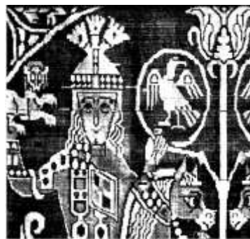
تصویر ۱۳. پارچه با نقش انسانی در دوره ساسانی

بر اساس نمونه‌های موجود و ذکر شده در این پژوهش می‌توان چنین اظهار کرد که در مجموع، منسوجات آل بویه در مقایسه با دوره ساسانی نقوش تزیینی و جزئیات بیشتری داشتند و فضای منفی کمتری در سطح پارچه دیده می‌شود.