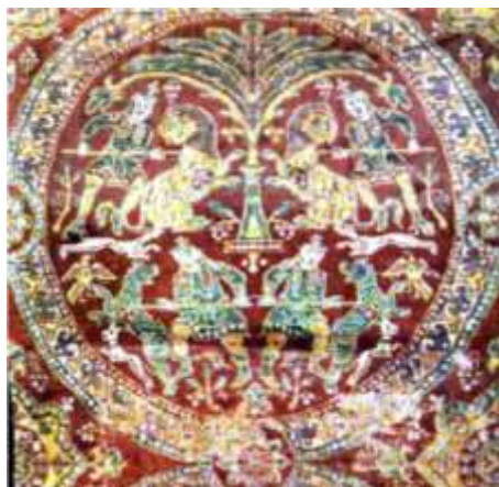
تصویر ۹. نقش شیر در منسوجات ساسانی