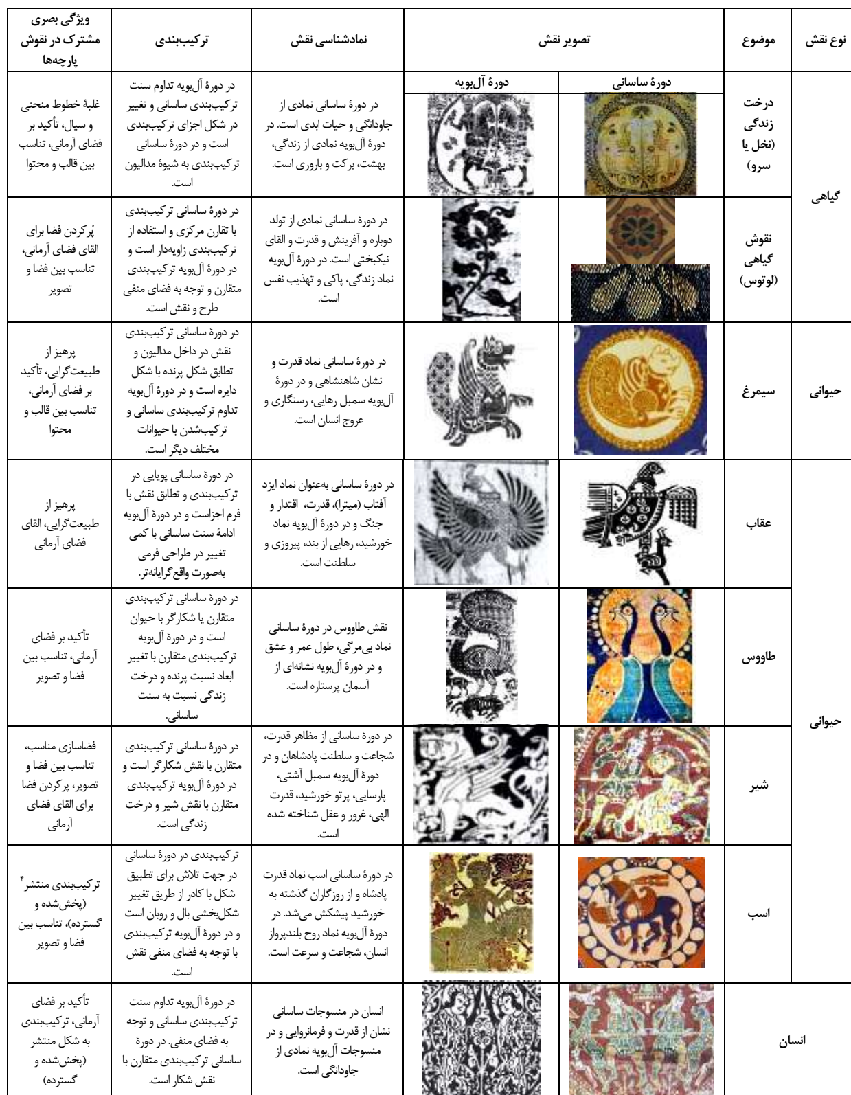
جدول ۱. مقایسه تطبیقی نمادگرایی نقوش مشترک منسوجات ساسانی و آل بویه