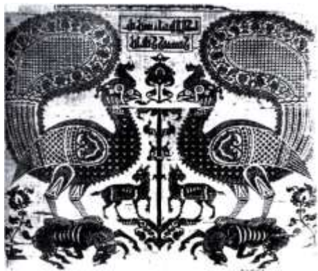
تصویر ۷. ابریشم طاووس بزرگ، شهر ری، ۳۹۳ق مأخذ: (فتحی و فربود، ۱۳۸۸: ۴۵)