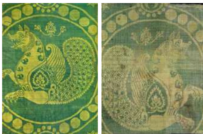
تصویر ۳. پارچه ابریشمی با نقش سیمرغ، سده ۶ میلادی، موزه ویکتوریا و آلبرت لندن

از دیگر نکات مهم در دوره ساسانی و آل‌بویه، قرارگرفتن نقوش در قاب‌های مدور و طراحی در حدفاصل قاب‌های مدور است که به نوعی می‌توان از آن‌ها به‌عنوان طرح مکمل یاد کرد. معمولاً طرح آن‌ها عبارت از چهار جفت یا تک‌پرنده یا حیوان است که به دور یک نقطه مرکزی چیده شده‌اند و تزیینات برگ نخلی، آن‌ها را از هم جدا کرده و فضا را پر کرده است (محمدحسن، ۱۳۶۶: ۲۳۱). با وجود این نقش پرنده در منسوجات آل‌بویه، با معانی نمادین و غالباً با مفهوم مرگ یا جاودانگی همراه گشته و بیشتر با مضامین دینی همراه بوده است.