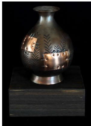
تصویر ۲- «اثر شماره ۲». اثر بهروز سهیلی اصفهانی. ظرف مسی و مفتول آهنی بر پایه‌ی چوبی، ۲۸ × ۱۸ × ۱۶ سانتی‌متر.

• پیرامتن‌های عنوان و عنوان‌بندی به مثابه آستانه متن در سینما با تأکید بر آثار عباس کیارستمی این پایان‌نامه‌ی کارشناسی ارشد پژوهش هنر که در دانشگاه هنر اصفهان در سال ۱۳۹۲ نگارش یافته، با تکیه بر نظریات ژرار ژنت در باب بینامتنیت، «عنوان» و «عنوان‌بندی» فیلم را گونه‌هایی از پیرامتن معرفی نموده که در چگونگی خوانش مخاطب از متن اثر هنری نقش ایفا می‌کنند (معدادیخواه و نامورمطلق، ۱۳۹۲).