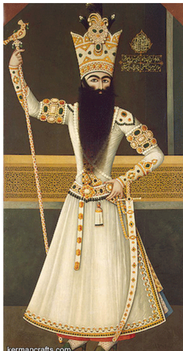
تصویر ۲- تصویر ایستاده فتحعلی شاه، اثر مهرعلی.