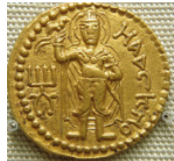
تصویر ۵- کوشان، سکه، هایشکا با عصای مرغ‌نشان در دست راست.