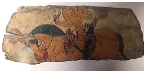
تصویر ۴- سغد، سپر چوبی.

با فروپاشی سلوکیان، حدود سده‌ی دوم پیش از میلاد، سرزمین سغد تحت سیطره‌ی کوشانیان درآمد. حاکمان کوشان را عمدتاً می‌توان از روی سکه‌های شان شناخت، زیرا هر