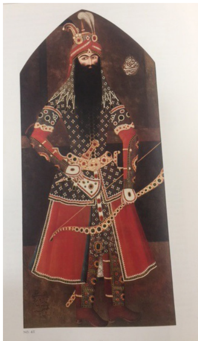
تصویر ۱- تصویر ایستاده فتحعلی شاه، اثر مهرعلی.

مهرعلی، شاگرد میرزا بابا و برجسته‌ترین نقاش دربار فتحعلی شاه بود. مهرعلی در کاربست میثاق‌های زیبایی چهره و اندام، در ساخت و پرداخت تاج، اسلحه، جامه و نیز طراحی و رنگ‌آمیزی، از