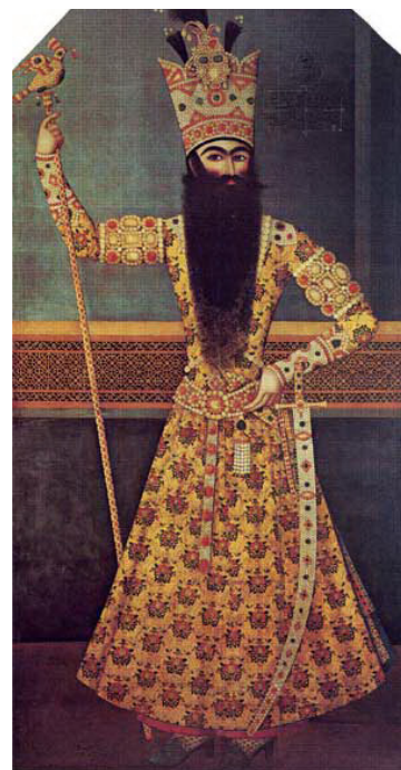
تصویر ۳- تصویر ایستاده فتحعلی شاه، اثر مهرعلی. ماخذ: (آژند، ۱۳۹۲، ج ۲، ۸۴۷).