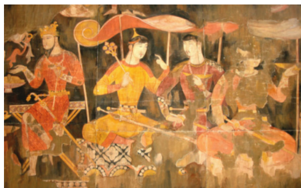
تصویر ۸- پنجکنت، بخشی از نقاشی دیوارنگاری، ضیافت. ماخذ: (آژند، ۱۳۹۲، جلد ۱، ۶۲۰)

۱- عناصر عمودی، افقی، مورب و منحنی، تلفیق نقش‌مایه‌های تزئینی و تصویری؛ رنگ‌گزینی محدود با تسلط رنگ‌های گرم؛ کمر باریک و شانه پهن؛ رخسار جوان؛ تاج؛ عصای مرغ نشان؛ خنجر و شمشیر؛ خفتانی از پوست پلنگ؛ جامه فاخر و مملو از جواهرات بویژه مروراید از ویژگی‌های عینی پیکره‌های انسانی مصور شده در سپر چوبی، سکه و نقاشی‌های دیواری پنجکنت به شمار می‌آیند.