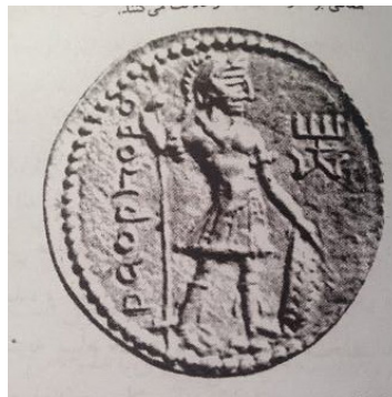
تصویر ۶- سکه کوشانی، خشترویره. ماخذ: (هینلز، ۱۳۹۳، ۷۳)