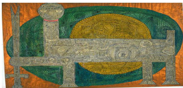
تصویر ۳- مکتب سقاخانه اثر حسین زنده‌رودی.