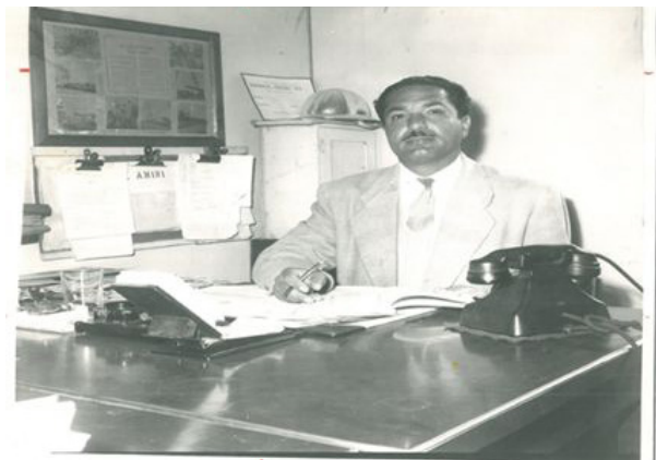
تصویر ۱- درون‌مایه‌ی انضباط.

«جنبش‌های توده‌ای که بر گفتمان بازگشت به اصل استوار بودند، معمولاً در شرایط زیر- که شرایط بیشتر انقلاب‌های قرن بیستم است - پدید آمدند؛ مدرنیزاسیون سریع و از بالا، رواج شهرنشینی از بین سبک‌های سنتی زندگی و بالاخره، مغلوب سلطه نیرومند خارجی شدن» (میرسپاسی، ۱۳۹۲، ۲۵۹). در ایران نیز به دلیل شرایط سیاسی، اجتماعی، فرهنگی که همه معلولان تقابل جامعه‌ی سنتی ایران با پدیده‌ی مدرنیته‌ی غربی‌اند، چنین گفتمان درون‌مرزی شکل می‌گیرد. در واقع، «ظهور دولت نوین و اقتدارگرایی پهلوی، مدرنیزاسیون از بالا و پدید آمدن از خود بیگانگی در میان جماعت مهاجر شهری از عواملی هستند که شرایط اجتماعی- سیاسی را برای ظهور ایدئولوژی "بومی‌گرا"یی که مبتنی بر نظریه "بازگشت" است، مهیا می‌کند» (همان، ۲۰۱). بازتاب