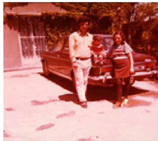
تصویر ۲- درون‌مایه پوشش و کالا.