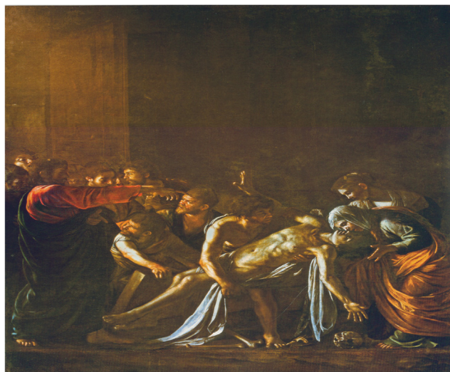
تصویر ۴- رستاخیز العاذر، کاراواجو، ۱۶۰۹، موزه‌ی رجیوناله‌ی مسینا، رنگ روغن روی بوم، ۲۷۵*۳۸۰ سانتی‌متر.

من می‌توانم از آنچه اکنون هستم خارج شوم و نوع دیگری از بودن را زندگی کنم. به این اعتبار انسانیت من، و زنده بودن من وابسته است به این که بتوانم از هویت فعلی خود خارج شوم. بتوانم به سمت بی‌نهایت امکان جهت‌گیری کنم. در واقع به قول باختین من به جای آن که موجودی از جنس «بود» باشم، «رویدادی» در حال شدن هستم. من آن چیزی هستم که «هنوز-باید-بشود» ۲۷ (Bakhtin, 1990, 30). روشن است که متایی که کاراواجو تصویر کرده هم پیش چشم ما از «چیزی که هست» خارج می‌شود تا چیزی باشد که «هنوز - باید- بشود». او از لوی باج‌گیر بودن خارج می‌شود چرا که هنوز باید متای حواری بشود، هنوز باید متی انجیل نگار بشود، هنوز باید متای شهید بشود. مفری برای خارج شدن از هویتی که ممکن است به تصویر نهایی و همیشگی او بدل شود همان تردید آخر است که از آن سخن گفتیم: من واقعا باید باج‌گیر باشم؟ این بود منی که می‌خواستم و باید می‌بودم؟ این جاست که باختین از «تردید» به مثابه یک ارزش صحبت می‌کند (Bakhtin, 1999, 45). تردید است که از نهایی شدن من در چیزی که هستم جلوگیری می‌کند. اگر از چیزی که هستم و کاری که می‌کنم مطمئن باشم، رفتار و زندگی‌ام حالتی خود به خود پیدا می‌کند: بدون فکر و از روی عادت زندگی و عمل می‌کنم. اما تردید من را از زندگی عادی بر می‌کشد: تردید موجب می‌شود تا