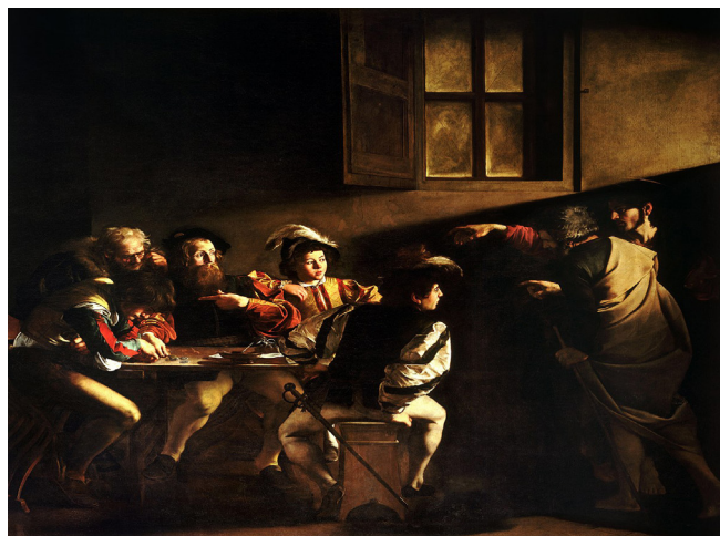
تصویر ۱- فراخوان قدیس متی، کاراواجو، ۱۵۹۹، کلیسای سان لوئیجی دی فرانچزی رم، رنگ روغن روی بوم، ۳۲۲*۳۴۰ سانتی‌متر.

در این مقاله از منابع کتابخانه‌ای و موزه‌ای استفاده کرده و با استفاده از رویکردی تحلیلی به واکاوی نقاشی فراخوان قدیس متی کاراواجو پرداخته‌ایم. و در خلال این تحلیل به دنبال یافتن امکاناتی بصری برای روشن ساختن سویه‌های مختلف تفکر باختین بوده‌ایم.