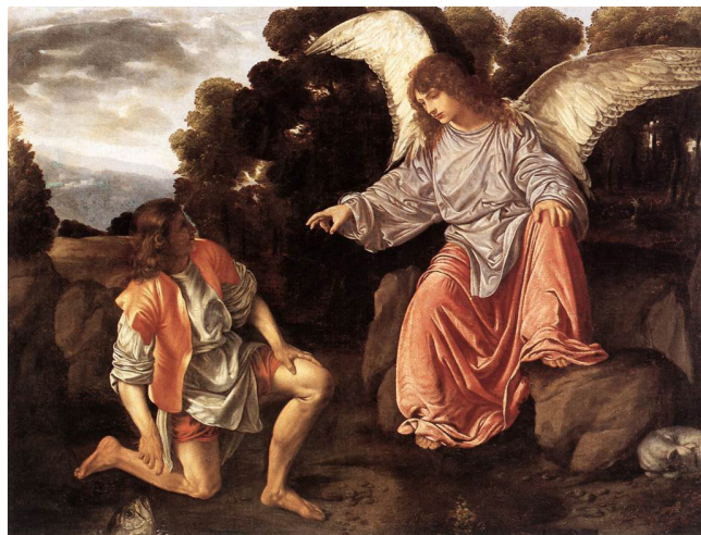
تصویر ۲- طوبیاس و فرشته - گیرولامو ساوولدو، ۱۵۲۲-۲۵، گالری بُرگزه رم، رنگ روغن روی بوم، ۹۶*۱۲۴ سانتی‌متر.