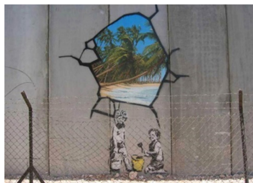
تصویر ۱۰- سوراخ روی دیوار حائل، دیوار حائل کرانه باختری رود اردن، بیت‌لحم. نمونه‌ای از گرافیتی بنکسی روی دیوار.