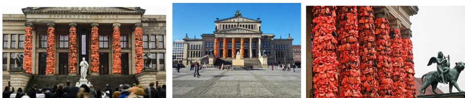
تصویر ۱۳- سالن کنسرت برلین.