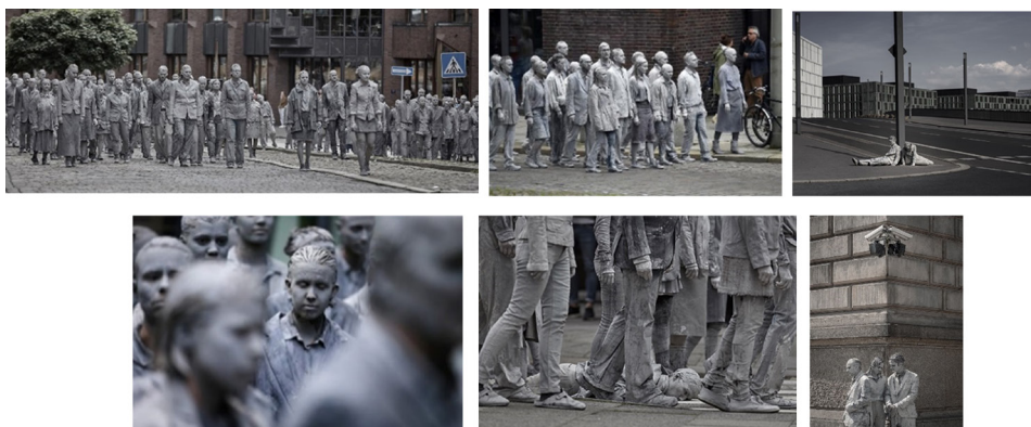
تصویر ۱۱- پرفرمنس رقص مردگان، عکس christian angl. ماخذ: ( https://1000gestalten.de/en/ )