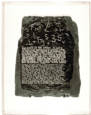
تصویر ۳- سند پس از زایمان، اثر از لوح سنگی و صمغ.

بر اساس گرایش‌های فمینیستی در هنر، هویت سیاسی و اجتماعی را نمی‌توان به یک تصویر کامل و واحد از یک نظام طبقاتی که بر مبنای اقتصاد شکل گرفته است، فروکاست. جنسیت، هویت قومی، سن، گرایش جنسی و غیره، همگی، تصویر طبقه را می‌شکنند و تکه‌تکه می‌کنند و فرومی‌پاشند (وارد، ۱۳۹۳، ۲۳۰)، تا این حد که سیاست فرهنگی مبنی بر اینکه گروه‌های اقلیت چگونه در رسانه‌ها ارائه می‌شوند، ظاهراً اکنون نقش و تأثیر بیشتری نسبت به سیاستی دارد که در امتداد خطوط سنتی تضاد بین بورژوا و پرولتاریا ۳۸ ترسیم شده است. بنابراین کشمکش‌های مربوط به حق مردم در ابزار هویت‌های جنسی و فرهنگی‌شان شدت یافته است. موضوعاتی متنوع