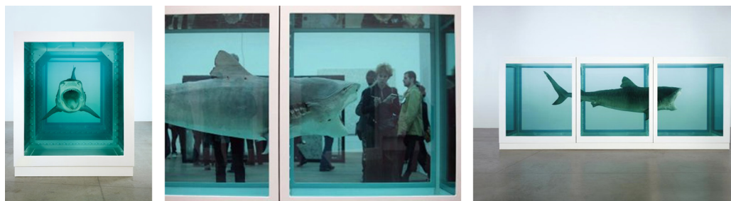
تصویر ۸- کوسه‌ای مرده در محفظه‌ای از جنس شیشه و فولاد در محلول فرمالدئید ۵٪ (۱۹۹۱).