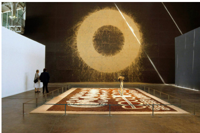
تصویر ۱- ارائه هنر چندملیتی، نقاشی‌های سنتی توسط انجمن بومیان در استرالیا (Yuendumu)، 'دایره سرخ زمین' (Red Earth Circle)، اثر ریچارد لانگ (Richard Long)، ژرژ پومپید، ۱۹۸۹.

نظریه انتقادی در مفهوم امروزی آن نشان می‌دهد که همه انواع دانش، ریشه در منافعی دارند که فعالیت‌های اجتماعی و ارتباطی سوژه‌های متعلق به یک طبقه، جنسیت، قومیت و نژاد را متأثر می‌کنند (مکاریک، ۱۳۹۳، ۳۳۴-۳۳۵)؛ افشار مختلف اجتماع و فرهنگ‌های متنوع را موضوع کارشان قرار می‌دهند. از همین رو برقراری دوسالانه‌ها، نمود انتقادی به موازین هنرنخبه‌گرایی مدرنیسم بود که درهم شکسته شد و چندصدایی همچنین نسبی‌گرایی فرهنگی ۲۶ و تکتگرایی فرهنگی ۲۷ را به‌ارمان آورد؛ براین اساس،