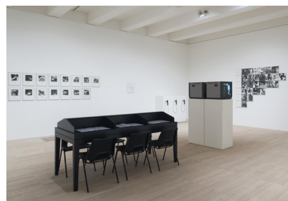
تصویر ۴- سند مربوط به بخش کار در صنعت؛ اشاره دارد به داستان‌های بیش از ۱۵ زن کارگر که در این پروژه شرکت کرده‌اند، داستان خاصی که از ارتباط شرکت‌کنندگان با محل کار و همچنین یک بررسی کلی‌تر از تغییرات در کار و صنعت مطرح کرده‌اند، ۱۹۷۳-۱۹۷۵.