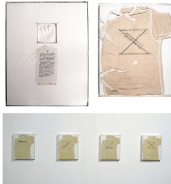
تصویر ۲- سند پس از زایمان، جلیقه‌های پشمی، مداد، جوهر، مجموعه ایلین نورتن، سانتا مونیگا.