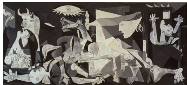
تصویر ۹- گرینیکا، پابلو پیکاسو (۱۹۳۷)، ۳،۵ در ۷،۵ متر، موزه رینا سوفیا، مادرید.

تعاریف زیادی وجود دارد و هر یک از این تعاریف تنها در ارتباط با بازی زبانی خاصی که در آن قرار گرفته، معنادار است. مدرنیسم این سؤال را مطرح می‌کند: «آیا فلان چیز خوب است؟» اما پست مدرنیسم می‌پرسد: «برای چه کسی یا برای چه چیزی خوب است؟» به نظر می‌رسد معنای این سخن در گفتمان پسا مدرن آن است که ایده‌ها و ارزش‌های همه افراد به طور یکسان اعتبار دارند. در نتیجه، دلیلی ندارد فرض کنیم که "باورهای غربی" و "عصر روشنگری" باید هر جهان بینی دیگری را تحت نفوذ یا سلطه خود داشته باشند. "ما"، مبنای اخلاقی والایی نداریم که از آن جایگاه، اعمال دیگران را مورد انتقاد قرار دهیم. نظرات آن‌ها از نظرات ما معتبرتر نیستند. ما هرگز به هنجارها و قوانین پذیرفته و جهانی دست نخواهیم یافت (و نباید هم برسیم، زیرا تنها راه دست یافتن به آن‌ها، زور و اجبار است). بنابراین معیارهای مشترک کنار گذاشته می‌شوند و تکنرگرایایی جای آن را می‌گیرد (وارد، ۱۳۹۳، ۲۶۰-۲۶۱). این گفتمان در هنر، مبنای شکل‌گیری اجراها و پرفرنس ۶۲ ‌هایی در سال‌های اخیر است که در قالب این موضوع با طیف وسیعی از گرایش‌های سیاسی و اجتماعی اجرا شده است و اهدافی همچون رسیدگی به مسائل اجتماعی و سیاسی و تشویق مشارکت مردم برای تغییر و آگاهی اجتماعی را دنبال می‌کند. از جمله این نمونه‌ها، پرفرنس منحصربه‌فرد "رقص مردگان" است که یکی از بهترین و خلاقانه‌ترین راهپیمایی‌های مفهومی و اعتراضی علیه نظام سرمایه‌داری و ترویج سیاست‌های ستیزه‌جویانه است که تا به امروز شناخته شده است (تصویر ۱۱). تظاهرات صلح‌آمیز توسط