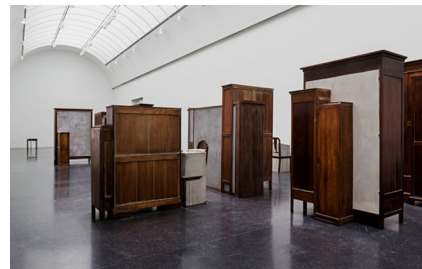
تصویر ۵- مبلمان نامناسب "dysfunctional furniture"، سالسودو، ۱۹۹۵.

در این آثار، حسی از عرق شدن یا فرسودگی بسیار آهسته وجود دارد، نموداری از تأثیر خاطره‌هایی که با خشونت بر ذهن داغ خورده، با سکوت و سانسور مهر و موم شده، و ناخواسته در رؤیاها و افکار بی‌اختیار زنده می‌شود؛ و همان قدر زجرآور در گذر ایام رنگ می‌بازد (استلابراس، ۱۳۸۸، ۳۱). به طور کلی فرآیند آثار این هنرمند، رویه‌ای از زبان جهان وطنی هنر معاصر و نیز واکنش و اظهار نظری در خصوص مسائل سیاسی است. در همین راستا تکیه نظریه انتقادی نیز بر «محتوای حقیقی» آرمان‌های بورژوازی نظیر آزادی، حقیقت، عدالت و... و تعارض آن با تجربیات وحشتناک جنگ جهانی دوم است که بورژوازی آن را به بشریت تحمیل کرده بود و معطوف به تحلیل و دگرگونی اجتماعی است (ن. ک: رشیدیان، ۱۳۹۴، ۶۹۴). از دیگر آثار معاصری که رویکردی انتقادی دارد، اثر دیوید