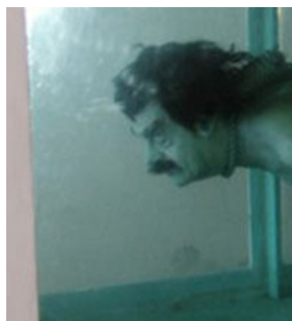
تصویر ۷- بخشی از تصویر صدام حسین کوسه، (۲۰۰۵).

هنر اعتراضی، اصطلاح گسترده‌ای است که به آثار خلاق مربوط می‌شود که توسط فعالان و جنبش‌های اجتماعی مطرح می‌شود. هنر مقاومت از نمونه هنر اعتراضی است که از آن جمله می‌توان هنر مخالف آپارتاید در آفریقای جنوبی را نام برد که ویلی بستر ۵۴ ، یکی از بهترین هنرمندان شناخته شده در این عرصه است. از این رو هنر اعتراضی به عنوان بخشی از تظاهرات یا اعمال نافرمانی