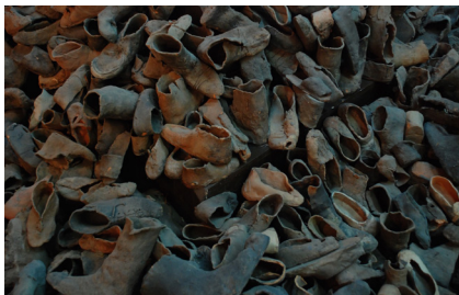
تصویر ۶- موزه تاریخ هولوکاست، اورشلیم.