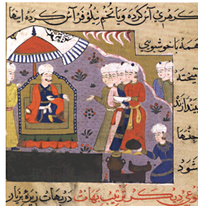
تصویر ۶- طرز تهیه سوپ و ادویه کاری. (Titley, 2005, 44)