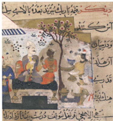
تصویر ۷- طرز تهیه کوفته. (Titley, 2005, 90)

شاه به همراه ملازمان در زیر سایه بان نشسته است. زن در کنار سلطان هند با گوشواره ای آویز نشسته است. در سمت راست سلطان تعدادی خدمه با چهره ایرانی در حال پذیرایی و خدمت به وی هستند. دو زن در حال آشپزی بر روی زمین نشسته و دستور طبخ شربت و حریره را نوشته‌اند. در این نگاره نیز حکومت هند و دربار سلطان غیاث‌الدین به عنوان یک فضای نشانه‌ای در مواجهه با یک نوع غذای ایرانی که از مرز نشانه‌ای عبور کرده و به فضای درون وارد شده است، آن را ضمن سازوکار ترجمه، از طریق استفاده از سبک طبخ ایرانی، مورد جذب قرار می‌دهد.