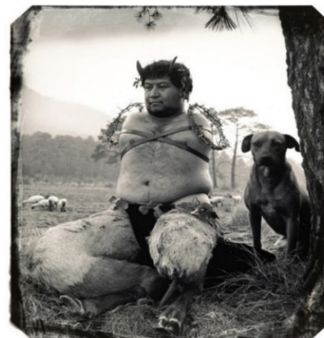
تصویر ۴- جوئل پیترو ویتکین، ساتیر ۱۹۹۲.

«این بزرگ‌الهه مادر، ایزدی زیرزمینی نیز به شمار می‌رفت و با مردگان پیوند می‌یافت» (شوالیه، ۱۳۸۷، ۲۹۰). احتمال می‌رود کشف ویتکین به این اسطوره از این جهت و نیز از جهت ویژگی‌های جنسی برجسته‌اش باشد. «آفرودیت در دوره‌ای از اساطیر یونانی که همه‌ی الهگان مستوری برگزیده و محافظه‌کاری پیشه کرده‌اند همواره عریان بوده و با ناز و ادا و طنای‌های خود نماد یا نشانه‌ای از تمایلات جنسی است» (گزرگین، ۱۳۹۷، ۱۹۱). همه‌ی روایات منسوب به او وجهی به اصطلاح رمانتیک دارند؛ در حالی‌که در واقع خود او بیش از عشق و زیبایی در پی اقتدار و استیلا بوده است. او الهه‌ای است که آدمی را به ارضای تمایلات جنسی خود ترغیب و حتی تحریک می‌کند (گزرگین، ۱۳۹۷، ۱۹۱). این اسطوره کاملاً با ویژگی‌های شکستن تابوها و به نمایش درآوردن آنچه پنهان است همخوانی دارد. اما نکته‌ی جالب این است که ویتکین ونوس را نیز دوجنسه به تصویر کشیده است و با این کار حتی در مورد ونوس که الهه‌ی