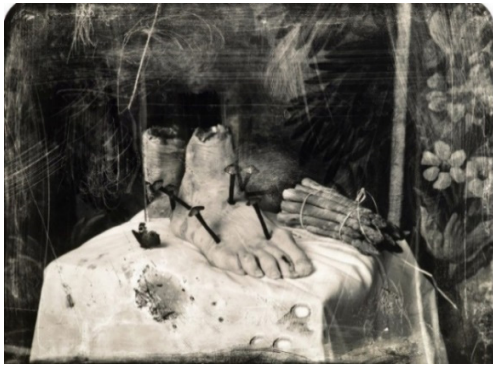
تصویر ۳- جوئل پیتر ویتکین اسب مصلوب ۱۹۹۹.