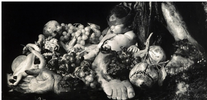
تصویر ۱- جوئل پیتر ویتکین، ضیافت احمق‌ها ۱۹۹۰.