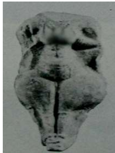
تصویر ۴، سمت راست - پیکرک برهنه، شوش. تصویر ۵، وسط - پیکره برهنه، شوش، عیلام میانی. تصویر ۶، سمت چپ - پیکره برهنه، شوش، عیلام میانی.