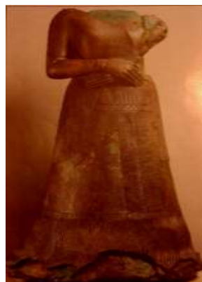
تصویر ۱۲، سمت راست - ملکه ناپیر اسو، شوش، مفرغ. مأخذ: (محمدپناه، ۱۳۸۶، ۴۵) تصویر ۱۳، سمت چپ - الهه نارونته، حدود ۲۲۵۰ ق.م. مأخذ: (آمیبه، ۱۳۸۹، ۸۴)

پیکره سنگ آهکی نارونته که در شوش یافت شده است احتمالاً یک ظرف مقدس و یک شاخه نخل در دست دارد، لباس بلندپیرچین (کاناکه) پوشیده و بر تختی نشست (طاهری و طاووسی، ۱۳۸۹، ۵۶) که دو شیر پشت سر الهه همچون نگهبانان نیزه‌هایی در دست دارند و در کنار در ورودی معبد الهه پاسبانی می‌کنند. بر شانه هر چهار شیر نقش خاصی مانند یک گل روزت به چشم می‌خورد که احتمال نقش مسبک موهای پر پشت و مجعد جانور را آرایه می‌کند. در قسمت جلو پایه پیکره، دو شیر روبه‌روی هم نشسته‌اند و در میان آن‌ها نقش گل روزت ماندنی قرار دارد. این گل شاید یکی از قدیمی‌ترین نمادهای الهه نروندی باشد، اگر این موضوع حقیقت داشته باشد باید بپذیریم که گل‌های روزت روی شانه شیران نیز نشانه الهه نروندی است و