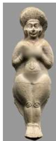
تصویر ۷، سمت راست - پیکره برهنه، شوش، عیلام میانی. تصویر ۸، سمت چپ - پیکره برهنه، شوش، عیلام میانی.