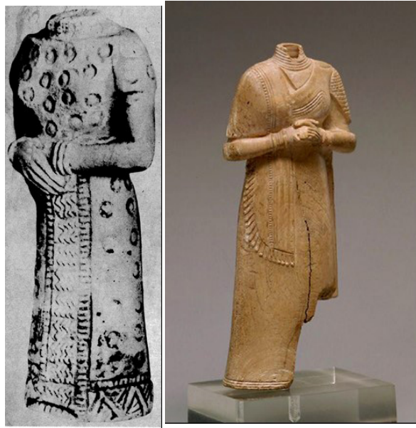
تصویر ۱۴، سمت راست- مجسمه یک زن، جنس عاج، ابتدای هزاره‌ی دوم ق.م، موزه لوور.