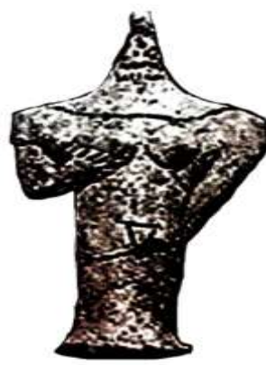
تصویر ۱، سمت راست - پیکرک زنانه، گلی، دوره اوان، شوش. مأخذ: (طاهری، ۱۳۹۳، ۱۱۳)