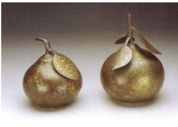
تصویر ۳- «به» فولادی طلاکوب قاجاری، ارتفاع: ۱۵/۷ س.م و ۱۲ س.م، محل نگهداری: مجموعه خصوصی تناولی، مأخذ: (آلن، ۱۳۸۱، ۱۱۷)