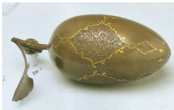
تصویر ۱- ترنج فولادی طلاکوب قاجاری، ارتفاع: ۳۷/۵، محل نگهداری: موزه آمستردام

همانگونه که گفته شد در متون ادب فارسی به وجود میوه‌های فلزی (که عموماً زرین و سیمین و مملو از جواهرات بوده) کراراً اشاره شده است. به عنوان مثال گنج جمشید به شکل دو گاو میشی، که