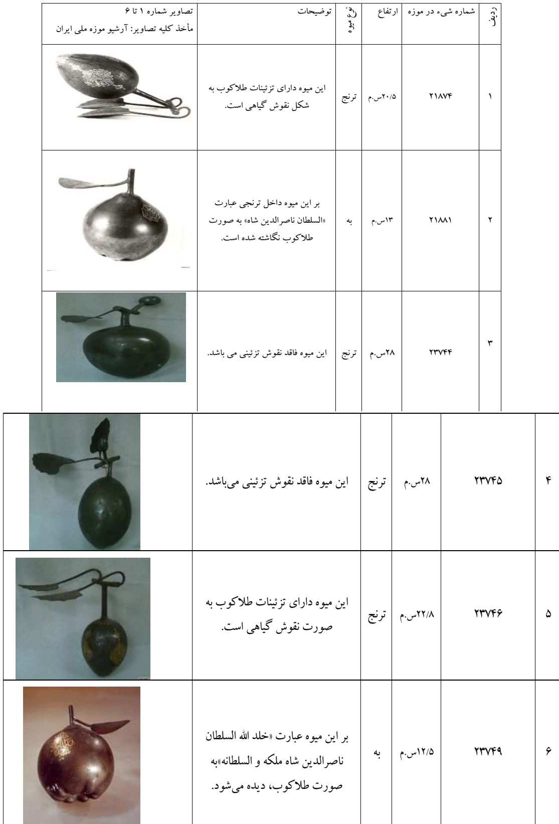
جدول ۱- مشخصات میوه‌های فولادی موجود در موزه ملی ایران.