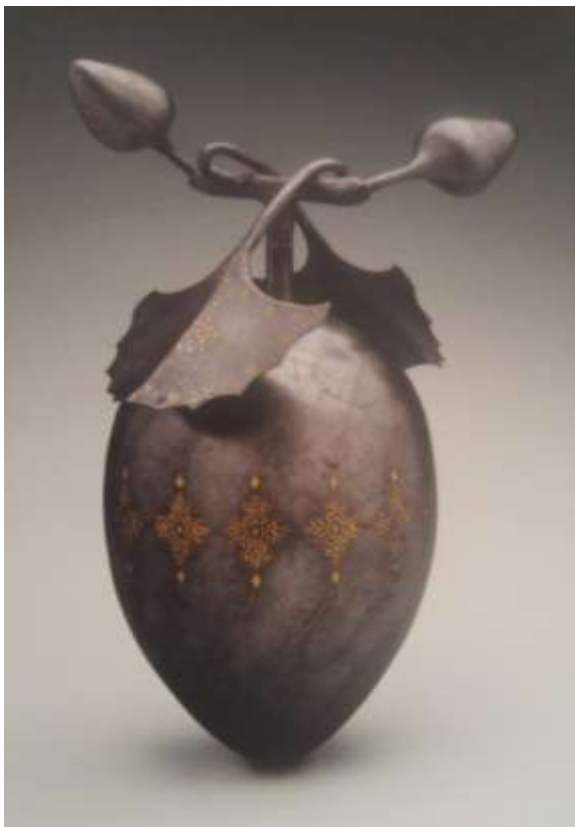
تصویر ۲- ترنج فولادی طلاکوب قاجاری، ارتفاع: ۳۲ س.م، محل نگهداری: موزه هنرهای زیبای بوستون، مأخذ: (Weistein, 2015, 419)

پرویز بهر خوانی زرین تره گستردی / کردی ز بساط زر، زرین تره را بستان پرویز کنون گم شد، ز آن گم شده کم تر گو / زرین تره کو برخوان؟ رو کم تر کوا برخوان (خاقانی، ۱۳۸۹، ۲۴۶).