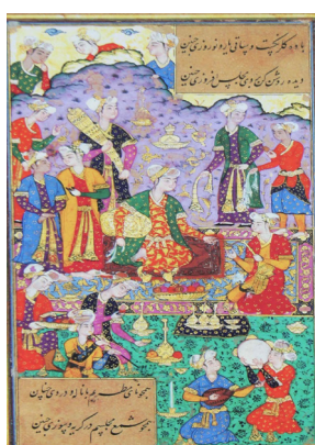
تصویر ۸- باده گل‌رنگ است و ساقی یار و نوروزی چنین. دیوان امیرشاهی سبزواری. مأخذ: (شاهکارهای نگارگری، ۱۳۸۹، ۱۷۷)