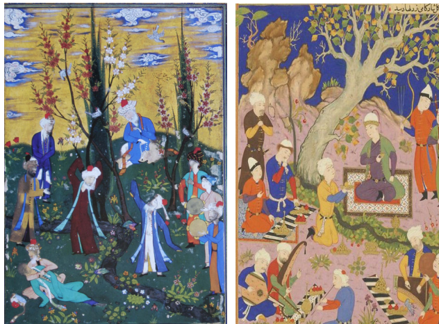
تصویر ۱۳- سرگرمی در فضای باز (حبیب‌السیر، ۹۸۴ ه.ق). مأخذ: (ولش، ۱۳۸۹، ۱۱۵) تصویر ۱۴- سماع دراویش (پنج گنج نظامی). مأخذ: (شاهکارهای نگارگری ایران، ۱۳۸۹، ۱۱۶)

پایه‌های شکل‌گیری و تأسیس تعزیه به‌احتمال زیاد از اواخر دوران صفوی آغاز شده است. در آثار هیچ‌یک از مورخان و نویسندگان ایران سخن از گونه‌ای از هنر نمایشی - موسیقایی به نام تعزیه گفته نشده است. اما در بعضی از منابع اشاره به مراسمی شده است که نشان از شکل‌گیری اولیه این هنر می‌دهد (راهگانی، ۱۳۷۷، ۲۴۵) چنانکه «تاورنیه» در سفرنامه خود می‌نویسد: