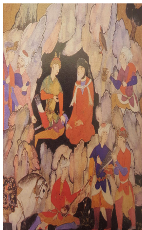
تصویر ۱۵ (راست) - مستی لاهوتی و ناسوتی (دیوان حافظ). تصویر ۱۶ (چپ) - دیدار شاهزاده با مرد مقدس (مطلع الانوار امیر خسرو دهلوی).

در مواردی دیگر عارف، ساز را در نقش واسطه‌ای بین پروردگار و خود می‌داند. در این شرایط چون آدمی قادر نیست همانند پیامبران کلام الهی را بشنود، این نوا به واسطه ساز به گوش او می‌رسد: رباب و چنگ به بانگ بلند می‌گویند/ که گوش هوش به پیغام اهل راز کنید «حافظ» (آزاده‌فر،