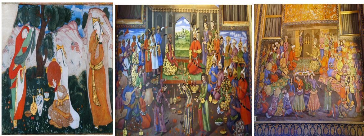
تصویر ۱ (راست) - دیدار شاه عباس اول با ولیمحمد خان ازبک (دیوارنگاره کاخ چهلستون).

در یکی از دیوارهای کاخ چهلستون به تصویر سه زن برمی‌خوریم که یکی از آنها در حالت نشسته به نواختن دف مشغول است و دو زن دیگر در حال دست‌افشانی و پای‌کوبی هستند (تصویر ۳). در مورد مجالس