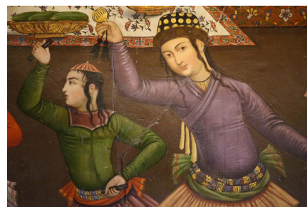
تصویر ۱۰ (راست) - حضور رقصندگان در مجالس بزم دربار (دیوار نگاره کاخ چهلستون).