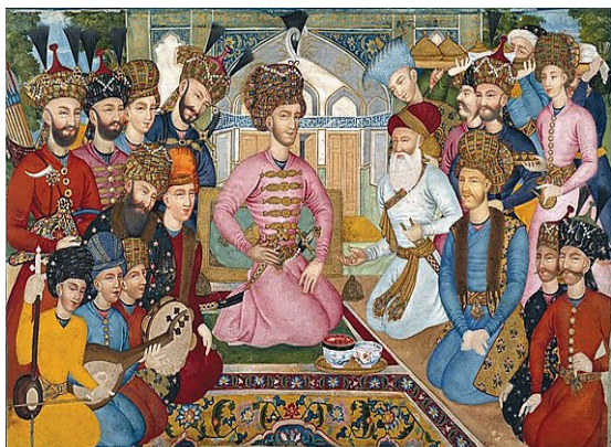
تصویر ۹- شاه‌عباس دوم و سفیر هند. نگاره تکبرگ. محمد زمان.

در مجلس بزم شاه‌عباس و شاه‌تهماسب که بر دیوارهای کاخ چهلستون