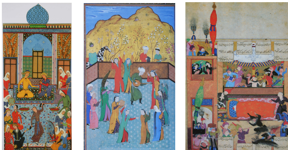
تصویر ۴ (راست) - مرگ اسکندر (خمسه نظامی).