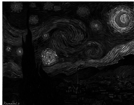
تصویر ۲- تضاد تیرگی روشن.