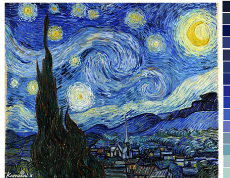
تصویر ۱- تنوع یا واریاسیون رنگی.

اثر از معدود کارهای ونگوگ است که از مشاهده مستقیم طبیعت اجتناب شده است و رنگ‌ها و فرم‌ها از تخیل هنرمند بیرون آمده‌اند تا فضای خاصی را تداعی کنند. یک پدیده‌ی کیهانی نمایشی در آسمان در حال وقوع است؛ دو ابر ماریپیچی غول‌پیکر در هم تنیده‌اند. یازده ستاره به شدت بزرگ با هاله‌ی نور اطرافشان به درون شب نفوذ کرده‌اند. ماه نارنجی رنگ غیرواقعی، گویی با خورشید یکی شده است. یک نوار عریض از نور- شاید کهکشانی راه شیری- در سراسر خط افق کشیده شده و گوی در آسمان آبی، غوغایی بر پاست. انرژی بی‌واسطه و گویای نقاشی، به کمک طوفان فراگیر ضربه‌ی قلم‌مو تقویت شده است. در این تصویر که احتمالاً یک منظره‌ی مکاشفه و شهود است، ونگوگ تلاش می‌کند خود را از هیجانات سیطره‌جو رها کند. از سوی دیگر می‌توان این تصویر را تلاشی برای بیان تصویری میل او به بیکرانگی طبیعت دانست» (اف. والتر، ۱۳۹۱، ۶۸).