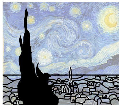
تصویر ۵- فضا، مقیاس.

ابن هیثم از آن سخن می‌گوید: «زمانی که در زیبایی حاصل از همراهی معانی جزئی درنگ شود، این نکته دریافته می‌شود که زیبایی حاصل از همراه شدن این معانی با یکدیگر فقط بر اثر تناسب و هماهنگی میان آن معانی‌ای است که با یکدیگر همراه شده‌اند، چه هر زمان که آن دو یا هر معانی با یکدیگر همراه شوند، آن زیبایی حاصل نمی‌شود، بلکه آن زیبایی فقط در برخی صورت‌ها به دلیل تناسب میان دو یا چند معنی که در آن صورت‌ها گرد آمده‌اند پدید می‌آید. بنابراین، زیبایی، از معانی جزئی حاصل می‌شود، و نهایت کمال و زیبایی تنها همان تناسب و هماهنگی‌ای است که میان معانی جزئی روی می‌دهد. بدین ترتیب، به رای ابن هیثم، وجود تناسب در دیدنی‌ها (مبصرات) به معنای وجود کمال زیبایی در آنهاست» (طباطبایی، ۱۳۹۷، ۲۰۴).