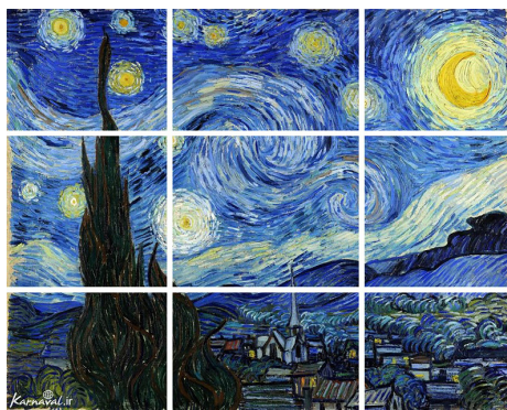
تصویر ۶- ترکیب بندی منسجم.