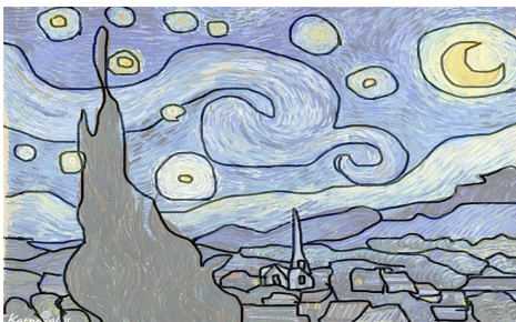
تصویر ۲- تنوع اشکال.

الگوی کنتراست یا تضاد: وجود ساختار دودویی در معانی جزئی‌های مانند نور و سایه، تفرق و اتصال، سکون و حرکت، شفافیت و کدری، زبری و نرمی، تشابه و اختلاف در ادراک شناخت گونه، به‌صورت کیفیت تضاد فهم می‌شود. «در روند سازماندهی بصری، کنتراست نیروی حیاتی در خلق یک کل منسجم است. در تمام هنرها کنتراست ابزار نیرومندی برای بیان و تقویت معنی و موجب سادگی و سهولت ارتباط است. آیا درک ما از گرما بدون سرما، بلندی بدون پستی و شیرینی بدون تلخی امکان‌پذیر است؟ بدون کنتراست ذهن به سمت از بین بردن تمام حواس و بوجود آمدن جو زوال و نابودی پیش می‌رود. آرامش و تعادل مطلق مانند محیطی است