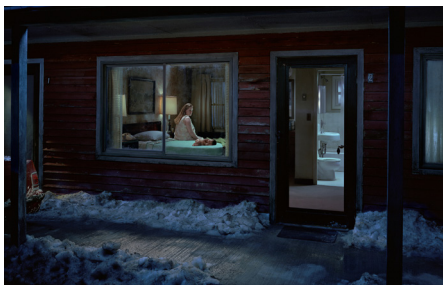
تصویر ۲- کرودسون، از مجموعه زیر بوته‌های رُز، ۲۰۰۷.

بر مبنای نظر لاتور، عکاس را نیز بایستی به‌عنوان کنشگری انسانی در شبکهٔ عکاسی در نظر گرفت. چراکه لاتور تلاش می‌کند تمایز و تقابل میان سوژه-ابژه و مفاهیم مرتبط با آن را نقد نموده و از میان بردارد. در بحث قبل دانستیم که لاتور تقابل میان ابزار و انسان را قبول ندارد و ابزار را به‌عنوان واسطه و کنشگری فعال معرفی می‌کند که نقش تعیین‌کننده و تغییردهنده‌ای در هر شبکه‌ای بازی می‌نماید. بر همین اساس، در فلسفه لاتور، کنشگران انسانی جایگاهی کانونی و برتر ندارند؛ بلکه اتحاد و روابط هر کنشگر، فعالیت‌های او را شکل می‌دهد. چیزی به‌عنوان یک نقطهٔ مرکزی در شبکه وجود ندارد؛ به‌طوری که دیگر نقاط روی آن یا اطراف آن گسترش پیدا کنند؛ بلکه مجموعه‌ای از ارتباطات در کنار یکدیگر، اتحاد بین کنشگر را شکل داده، کنشگرها را می‌سازند (محمدی، ۱۳۹۱، ۱۶۴). از این بابت، باید گفت نیپس ۲۱ هم برای تولید اولین عکس، تنها متکی به‌خود نبود؛ بلکه