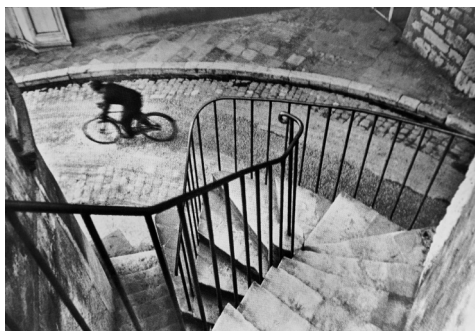
تصویر ۶- کار تیه برسون، فرانسه، ۱۹۲۲. مأخذ: (بلاف، ۱۳۷۵، ۵۷)

باشد یا غیرمادگار، قوی باشد یا ضعیف. همه موجودات و پدیده‌ها یک کنشگرند و باتوجه به موقعیت و روابطشان بر سایر کنشگران تأثیر می‌گذارند و می‌توانند شبکه را دگرگون سازند. یک پشه می‌تواند باعث مرگ یک پادشاه و فروپاشی شبکه امپراتوری شود. ورود پیکسل به دوربین، تغییرات بنیادی و گسترده‌ای بر شبکه عکاسی و کنشگران درون آن گذاشت. نظریه پست‌مدرن، مبانی نظری و روش تولید آثار هنری را دگرگون ساخت. با این تفاسیر، پرسشی که مطرح می‌شود این است که جهان در شبکه عکاسی چه جایگاه و نقشی دارد؟ آیا جهان به صورتی خام و خنثی در مقابل دوربین و عکاس قرار می‌گیرد تا توسط آن‌ها کشف، شناسایی و ثبت شود؟ یا اینکه کنشگری عکاس را محدود و مقید به خود می‌سازد؟