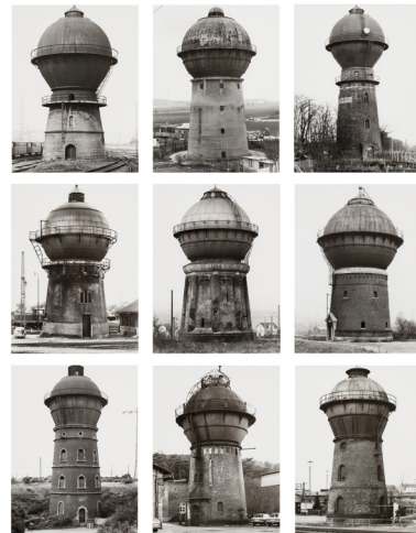
تصویر ۷- برند و هیلا بشر، منابع آب، آلمان (۸۲-۱۹۸۵). مأخذ: (سوتر، ۱۳۹۸، ۶۸)

کودکان کار به‌عنوان گذارده برای هاین، در عکس‌های او از چنان قدرتی برخوردار شدند که به تغییر قانون کار کمک زیادی نمودند. وستون نیز زمانی که با فلفل به‌عنوان یک گذارده یا پیش‌نهاد تماس ایجاد کرد؛ نتیجه این پیوند یعنی فلفل شماره ۳۰ از ابتدا مشخص و آشکار نبود؛ بلکه طی یک تعامل و گفت‌وگوی دوطرفه میان فلفل و عکاس و بازیگران دیگر یعنی قاب و نور، ساخته یا برساخته شد. از این طریق، فلفل هویت جدیدی یافت و از یک شی یا ابژه مربوط به مواد خوراکی و گیاهی به سوژه‌ای قابل تأمل تبدیل گشت؛ مثلاً شبیه پیکر انسان (تصویر ۹). به هر صورت، از ابتدای ابداع دوربین، جهان و عناصرش به‌انحاء مختلف و با کیفیات و جلوه‌های بصری و مفهومی گوناگون از حالتی محو و تار در ابتدای ابداع دوربین تا کیفیتی نافذ، دقیق و با جزئیات بسیار در عصر دیجیتال، در عکس ظاهر شده‌اند؛ زیرا در هر دوره‌ای در شبکه عکاسی، علاوه بر دوربین و عکاس، خود جهان نیز به‌نوعی کنشگری کرده است. از درآمیختن دوربین، عکاس و جهان به‌انحاء مختلف و بر اساس اهداف متفاوت، انواع عکس‌ها و گرایش‌های عکاسی زاده شده است. خلاصه اینکه هر کنش عکاسانه به‌مثابه رخدادی است که به‌واسطه پیوند عکاس با دوربین و جهان رخ می‌دهد و نتیجه‌اش تولید عکسی با خصوصیات ویژه است. در ضمن، نتیجه کنش عکاسانه یعنی عکس به‌هرحال به شیوه‌ای ارائه و عرضه می‌گردد و در این مرحله با واکنش جامعه هنری و عکاسان روبه‌رو می‌شود که اگر مورد توجه قرار گیرد، می‌تواند در درون شبکه عکاسی به‌عنوان یک کنشگر یا بازیگر جدید به ایفای نقش بپردازد و این‌گونه، شبکه عکاسی همواره در حال تغییر، تعدیل و تبدیل است.