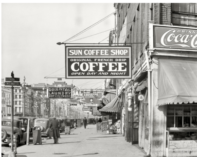
تصویر ۴- واکر اوانز، کافی‌شاپ، ۱۹۳۵.

باتوجه‌به آنچه بیان شد، می‌توان گفت نوع و چگونگی کنشگری عکاس وابسته به سایر کنشگران و بازیگران است. عکاس باید هدف خویش را در گفت‌وگو، تعامل و همراه کردن کنشگران دیگر (از امکانات دوربین تا مفاهیم مختلف) محقق سازد؛ بنابراین، ماهیت، جایگاه و نقش آفرینی عکاس در