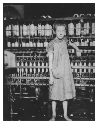
تصویر ۵- هاین، کودکان کار، ۱۹۰۸. مأخذ: (جی و هورن، ۱۳۸۸، ۹۰)