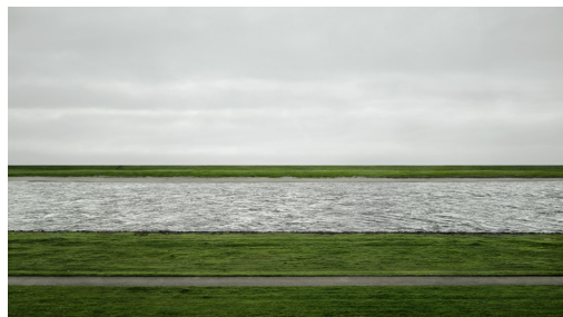
تصویر ۱- گورسکی، راین II، ۱۹۹۹. مأخذ: (لوپس، ۱۳۹۶، ۲۵۵)