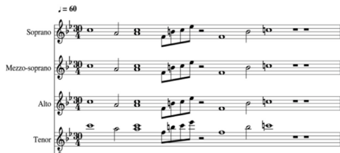
تصویر ۷- سمفونی درختان آبی. مأخذ: (Rahmani, 2019, 9)