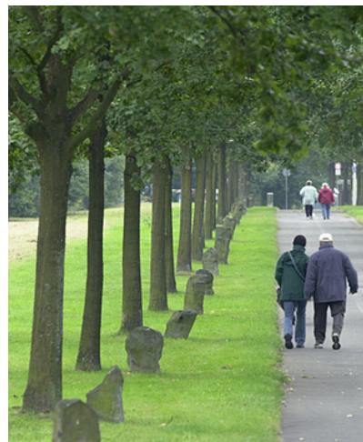
تصویر ۲- ژوزف بویز، کاشت ۷۰۰۰ درخت بلوط برای داکومننتا ۷، ۱۹۸۲-۸۷.