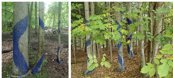
تصویر ۴- اجرای سمفونی درختان آبی، اویوار رحمانی، ایالت نیویورک.

اکسل هانت همچنین در شرح تحقیر فرهنگی گروه‌های اجتماعی همانند تشکلی‌هایی که در برابر نادیده‌نگاری اجتماعی شکل می‌گیرند، بر تأیید ادعای هویت افراد و مجامع تکیه می‌کند. از این رو اذعان دارد افراد و گروه‌ها نه به خاطر اصول اخلاقی انتزاعی بل به خاطر «تجربه تعدی به مفاهیم پیش‌انگاشته شهودی عدالت» (Honnet, 1990/1995, xis) به مقاومت سیاسی مبادرت می‌ورزند. به‌عبارت دیگر احساس می‌کنند مستحق تأیید هستند؛ هنگامی که تأیید نمی‌شوند حس بازی منصفانه را از دست می‌دهند و در برابر کسانی که نسبت به خود بی‌انصاف می‌دانند می‌ایستند. «این امر اساساً تعدی به ادعای فردی یا جمعی در تأیید اجتماعی است که بی‌عدالتی اخلاقی تلقی خواهد شد» (Honnet, 1990, 1995, xv). به این ترتیب ظهور لیبریت تیت و مجموعه اقدامات کنش‌ورزی این گروه مبتنی بر مخالفت با حمایت غیرمستقیم نهاد هنری موزه در تبیین مواضع سیاسی تخریب محیط زیست و نادیده‌نگاری جوامع انسانی است. لیبریت تیت «اقدامات خود را به‌عنوان «نافرمانی خلاق» ۶۸ توصیف می‌کند: آثار هنری که تضاد ایجاد می‌کند و قدرت را به چالش می‌کشد» (Evans, 2015, 144)، بنابراین ایجاد این گروه و کنش‌گری‌های آن، نمونه‌ای از تلاش در بازشناسی در تعارضات اجتماعی به‌صورت اکتیویسم است.