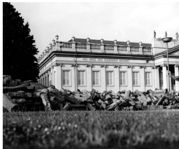
تصویر ۱- جوزف بویز، سنگ‌های بازالت، ۱۹۸۲.