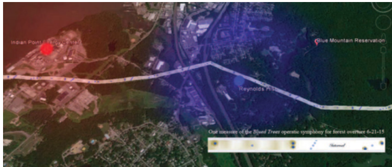
تصویر ۶- تطابق متن سمفونی بر درختان در جغرافیای مسیر خط لوله انتقال گاز طبیعی.