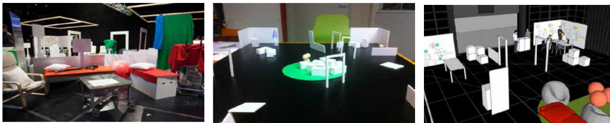
تصویر ۲- کارگاه های مشارکتی برای آزمایش ایده نهایی مرکز سرطانی؛ سمت راست: کارگاه مدل سازی سه بعدی رایانه ای؛ وسط: کارگاه ساخت ماکت در ابعاد کوچک؛ سمت چپ: کارگاه ماکت در ابعاد واقعی. مأخذ: (Kronqvist, Leinonen & Erving, 2013: 296-300)