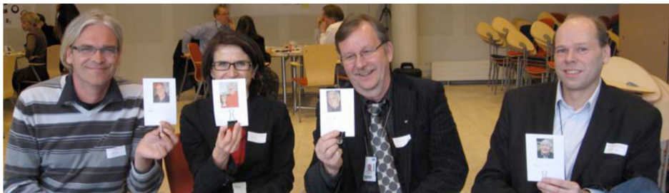
تصویر ۱- مشارکت کنندگان در حال نشان دادن شخصیت های انتخابی خود. مأخذ: (Kaario et al., 2009, 125)