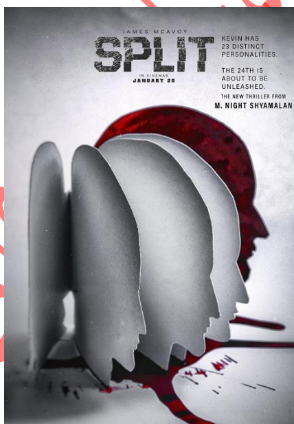
تصویر ۶- پوستر فیلم Split. طراح پوستر: بهنام رنجبر خدیوی.

در تصویر ۶ پوستر Split مشاهده می‌شود که در زبان فارسی به معنای شکاف است. با توجه به معنای این کلمه، درهم شکستگی در پوستر حاضر، با تحول و درک عمیق‌تری در زندگی همراه می‌شود و واقعیت‌هایی که به فراموشی سپرده شده را به شکلی مرموز به چالش می‌کشد. شکاف نام فیلمی روانشناختی است که در سال ۲۰۱۶ میلادی به نمایش درآمد و راجع به مردی است که دارای ۲۴ شخصیت متفاوت است؛ شخصیت آخر آن به هیولا معروف است که در آخر توانایی کنترل ۲۳ شخصیت دیگر را دارا می‌باشد. قهرمان داستان دختری به اسم کیسی است که همراه با دوتا از هم‌کلاسی‌هایش توسط مردی به اسم دنیس (که یکی از ۲۴ شخصیت است) ربوده می‌شوند. دنیس دخترها را در اتاقی زیرزمینی زندانی می‌کند و به آن‌ها قول می‌دهد که برنامه‌ی ویژه‌ای برایشان دارد. به نوعی، دخترها نقش غذای مقدسی را دارند که