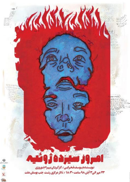
تصویر ۴- پوستر تئاتر امروز سیزده ژوئیه . طراح پوستر: میثم نادری، مأخذ: (URL8).