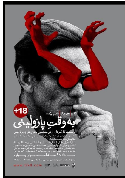
تصویر ۱- پوستر تئاتر به وقت پارولینی. طراح پوستر: مهدی رایگانی، مأخذ: (URL2).