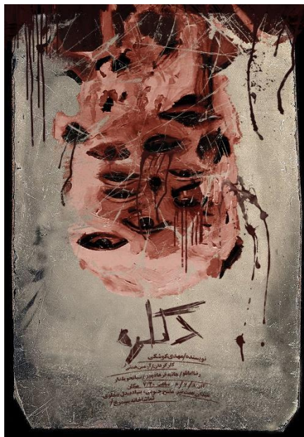
تصویر ۳- پوستر تئاتر دکلره. طراح پوستر: متین خیلیلی، مأخذ: (URL5).