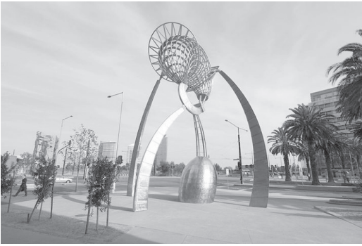
تصویر ۲- جفری بارتلت، ائورورا، ملبورن.

تکمیل طراحی خود از مدل های سه برنامہ ی Auto CAD استفاده می کند. ائورورا، بر نفوذ و پتانسیل فناوری در طراحی پویا، نورپردازی و نیز ارتباط با آب نمای محوطه تأکید می کند (جامی، ۱۳۸۸، ۲۶).