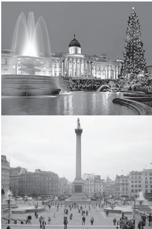
تصاویر ۳ و ۴- میدان ترافالگار، لندن.

میدان ترافالگار (Square Trafalgar) (تصاویر ۳ و ۴) میدانی در مرکز لندن انگلستان است که از جاذبه های توریستی و یکی از معروفترین میداين در بریتانیا و جهان است. میدان همچنین به عنوان یک محل برای تظاهرات سیاسی و اجتماعات محلی، مانند جشن شب سال نو در لندن استفاده می شود (www.wikipedia.org). میدان ترافالگار، در ۱۸۴۵ م ساخته شده و به مناسبت بزرگداشت پیروزی دریا سالار نلسون در نبرد ترافالگار، چنین نام گذاری شده