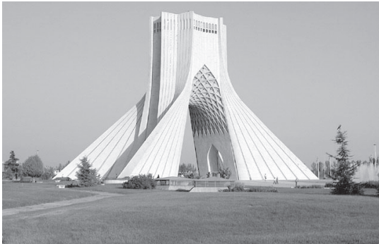
تصویر ۱- برج آزادی، تهران

کمابیش همه نکات مهم که در طراحی یک تندیس بزرگ شهری مورد توجه قرار می‌گیرد، در آن مورد ملاحظه قرار گرفته است و بیش از آنکه عملکردهای درونی آن اهمیت داشته باشد، جنبه‌های یادمانی و همچنین دید شهروندان از زوایای گوناگون به آن مورد توجه بوده است (سلطان زاده، ۱۳۸۷، ۷).