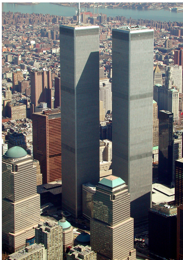
تصویر ۲- فضای مابین برج‌های سابق مرکز تجارت جهانی نیویورک.

این تعریف به دلایلی تعریف مناسبی نیست زیرا واژه منفی همراه با خود یک بار معنایی بد دارد. این واژه از طریق تقابل‌های دوقطبی، فضای خالی را بی‌ارزش جلوه می‌دهد. فضای منفی در مقابل واژه فضای مثبت خفیف و بد تلقی می‌شود. دلیل دیگر