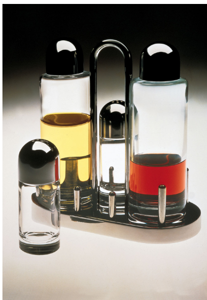
تصویر ۴- جای ادویه رومی، طراح اتوره سوتساس، تشبیه روابط خانوادگی میان وسایل.