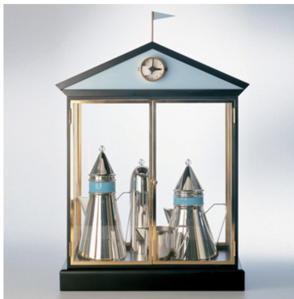
تصویر ۳- رابطه کتری، قوری و سایر وسایل به رابطه یک خانواده تشبیه شده است.

در بعد پنهان علاوه بر نکاتی که هال می گوید - مانند فواصل فرهنگی - روابط ذهنی دیگری نیز وجود دارند که حاصل تفسیر ناظر هستند. اما گاهی خود طراحان نیز این روابط را درک نموده‌اند و آگاه یا ناآگاه این روابط را رمزگذاری کرده‌اند تا مخاطب آن را دریابد. در ادامه پژوهش نمونه‌های بسیار زیادی از وجود رمزگان بعد پنهان شناسایی شد که در ذیل به چند نمونه معتبر آن اشاره می‌شود: