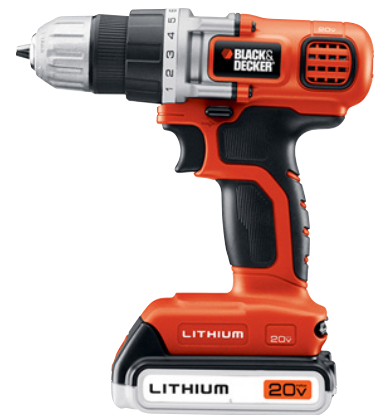
تصویر ۱- محصول شرکت بلک اند دکر: استفاده از رنگ نارنجی (متماثل به قرمز) و سیاه در هویت شرکت.

پیش از پرداختن به فضا باید واژه فرم را تعریف کنیم. فرم یکی از واژه‌هایی است که در گفتمان‌های هنری مترادف‌های بسیار زیادی دارد و به راحتی جانشین واژه‌های دیگر می‌شود و بر عکس. برخی از این واژه‌ها عبارتند از: شکل، گشتالت، ترکیب، حجم، هیبت و پیکره. در پیشینه مطالعات فرم تعاریف بسیار زیادی از این مفهوم ارائه شده است لیکن هیچ کدام یک تعریف مشخص علمی را ارائه نمی‌کنند و عموماً گزاره‌های کلی متافیزیکی هستند. دلیل آن نیز کاملاً واضح است، واژه فرم برای توصیف مفهومی ذهنی بکار می‌رود که نمی‌توان آن را مانند یک پدیده مشخص تعریف کرد. افزون بر این، فرم در زبان‌های مختلف معادل‌های گوناگونی دارد. با نگاهی به فرهنگ لغات دهخدا و عمید، می‌توان به جرأت گفت که این واژه در زبان فارسی معادلی ندارد! از آنجایی که واژه‌شناسی فرم یک بحث تخصصی و خارج از توان و هدف پژوهش است، به تعریف رایجی از فرم اکتفا می‌کنیم. «وسیوس ونگ» معتقد است که «به طور کلی همه چیزهایی