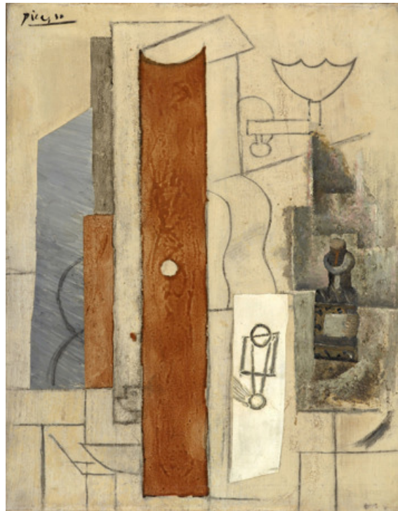
تصویر ۳- گیتار، شیر گاز و بطری، پابلو پیکاسو، ۱۹۱۳، رنگ روغن ماسه و ذغال روی بوم، ۵۳×۶۸،۵، مجموعه خصوصی، لندن.

و تعبیر اوست و هیچ چشمی معصوم و عاری از اشتباه نیست. وی مشاهده را فرآیندی فعال می‌داند و نه منفعل و این فعالیت سبب آن است که در خوانش تصاویر، کلیشه‌ها و الگوهایی که از پیش در ذهن بیننده است در نسبت با واقعیت در اولویت قرار بگیرد. ارنست گمبریچ این دیدگاه را تا بدانجا بسط داده که اساساً قائل به تقسیم قاطعی میان معنای طبیعی و قراردادی آنگونه که پانوفسکی شرح داده است نیست. به زعم وی، آنچه ما به عنوان شباهت‌ها تشخیص می‌دهیم، کلیشه‌ها و شکل‌های شناخته شده در فرهنگ خودمان است. کپینبرگ در مقاله‌ای تحت عنوان شمایل‌نگاری و دین با ذکر مسائل مطروحه در بالا مدعی می‌شود که با در نظر گرفتن نقش و سهمی بیشتر از آنچه پانوفسکی برای بیننده قائل شده است، سؤالاتی رخ خواهد نمود که پاسخ به آنها سهل به نظر نمی‌رسد. برای مثال «چگونه می‌توان نحوه نگاه دیگر افراد به تصاویر خود را توضیح داد؟ چگونه میان تداعی ذهنی و ادراک عینی تمایز قائل شویم؟ در کجا می‌توان خطی میان استنتاج درست و نادرست کشید؟» (کپینبرگ، ۱۳۷۳، ۱۴۲).