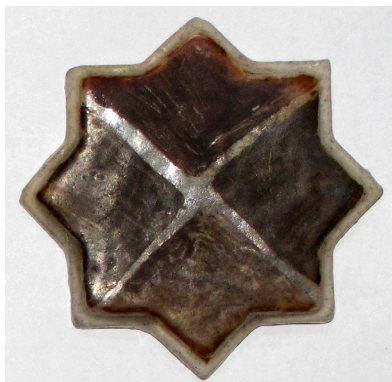
تصویر ۳- نمونه تست احیاء چهارم قسمت بالای تست.