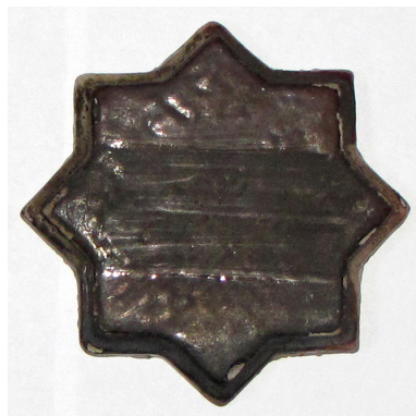
تصویر ۴- نمونه تست احیاء سوم.