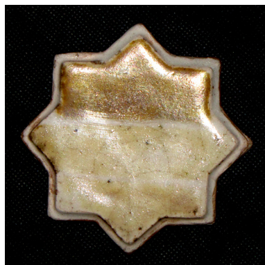
تصویر ۶- قسمت بالای تست شرایط احیاء ششم.