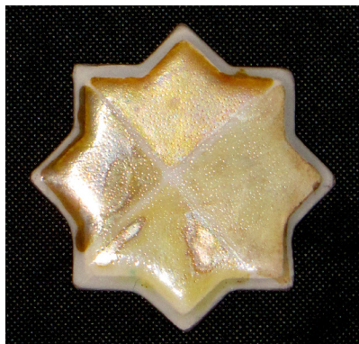
تصویر ۲- قسمت بالای تست شرایط احیاء پنجم.

مینای زرین فام در لعاب پایه کمتر نفوذ کند و تاثیر کمتری نسبت به احیاء ششم، بر لعاب داشته باشد. این نکته نیز در احیاء هشتم، با پایین تر آمدن دما بیشتر دیده می شود (تصویر ۵). در احیاء هشتم نیز کاملاً مشخص است که لعاب به نقطه نرم شدگی نرسیده و مینای زرین فام نتوانسته هیچ تاثیری بر روی لعاب داشته باشد و پس از شستشو به راحتی از روی سطح لعاب پاک می شود بدون اینکه تاثیری چندانی روی آن ایجاد کرده باشد.