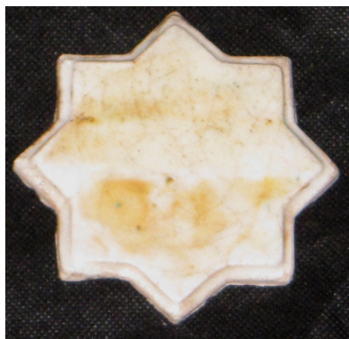
تصویر ۵- نمونه تست احیاء هشتم.