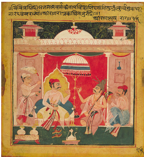
تصویر ۱. نگاره شری راگا راجپوت

نگاره «شری راگا» ۶ یکی از قدیمی‌ترین نقاشی‌های راگامالا، متعلق به سال ۱۶۰۵ و مکتب نگارگری راجستانی است. این اثر در مه‌وار، ۷ در روزگار سخت حملات پیاپی مغول‌ها شکل گرفته است. در این نقاشی، مقام شری راگا در قالب شاهزاده‌ای تجسم یافته که بر تخت خود تکیه زده است و به نوای موسیقی دو نوازنده گوش فرا می‌دهد. این راگا، بر اساس تقسیمات دوآلیسم ۸ مذکر و مؤنث، یک موسیقی مذکر و مردانه محسوب می‌گردد. تجسم یافتن آن به شکل شاهزاده نیز بر صحت این مطلب مهر تأیید می‌زند. هر تم از موسیقی راگا با فصلی خاص و ساعتی از روز در ارتباط است. این تصویر را با فصل زمستان و اواخر عصر هم‌زمان می‌دانند که حس عشق را در انسان بر می‌انگیزد (تصویر ۱).