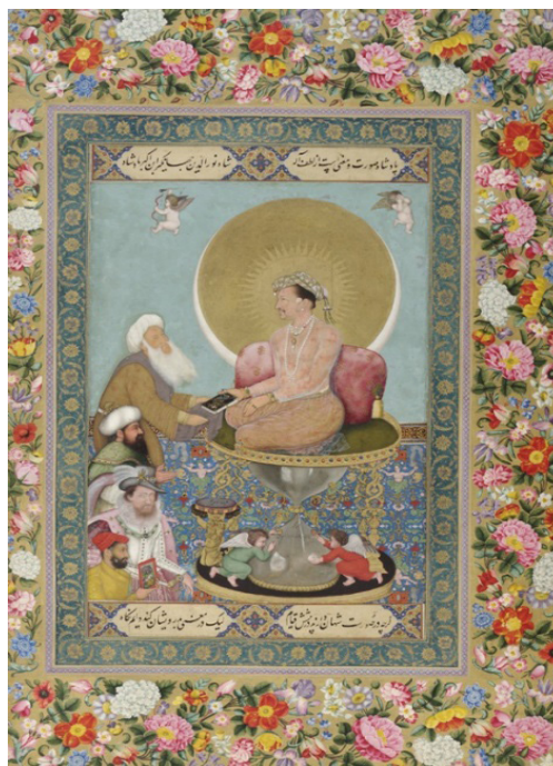
تصویر ۲. جهانگیرشاه بر تختی تمثیلی نشسته است ۱۶۲۵

رنگ‌های ترکیبی در تفسیر معنایی، خصوصیات هر دو رنگ پایه را خواهند داشت. از این جهت، رنگ صورتی روشن به‌کاررفته در نگاره که از ترکیب سفید و قرمز حاصل می‌شود، علاوه بر داشتن خصوصیات تعدیل‌شده رنگ قرمز، نشانی از خلوص، آرامش و پاکی را با خود به همراه دارد. همچنین افزودن سفید، به رنگ‌ها شادی و نشاط می‌بخشد (گوهریان، ۱۳۷۷: ۳۹). در اینجا رنگ صورتی، احتمالاً می‌تواند نشانگر لذت و آرامشی باشد که بر اثر نوای موسیقی در فضا ایجاد شده است. رنگ سفید به‌تنهایی احساسی از سکوت را به همراه دارد که همه‌چیز در آن محو می‌شود؛ مشابه