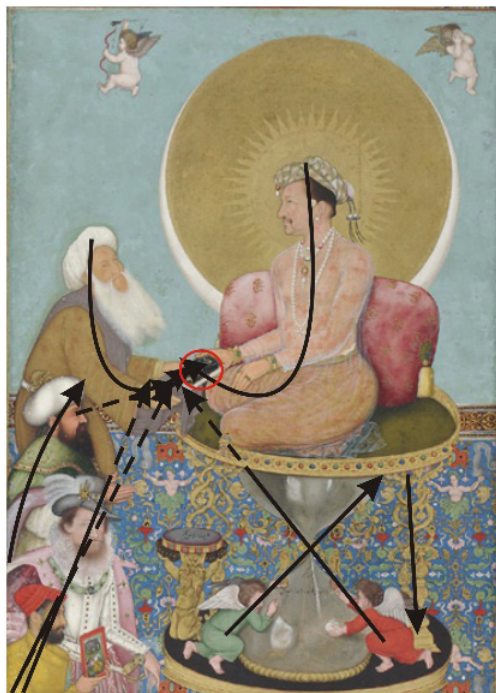
تصویر ۵. نیروهای بصری به کار رفته در نگاره جهانگیر شاه