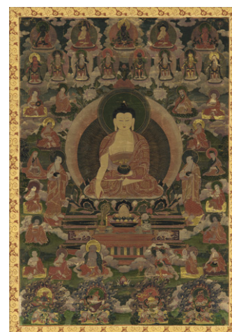
تصویر ۷. ساکیامونی، قدیسین و خدایان مأخذ: (www.asia.edu) 12/28/2013 16:00