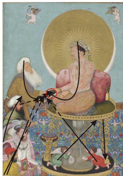
تصویر ۴. جهانگیر شاه بر سر بر ساعت شنی، به تنهایی تصویری کامل است

جدول ۱. تحلیل تطبیقی دو نگاره شری راگا و جهانگیر شاه از نگاه زیبایی‌شناختی