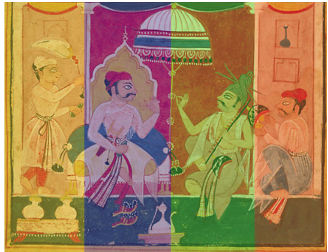
تصویر ۶. تقسیم فضایی اشخاص در نگاره شری راگا بدون پرسپکتیو مقامی

در تصویر جهانگیرشاه، هیچ‌کس مهم‌تر از شخص سلطان نیست. عوامل زیادی از جمله فرشتگان، تخت خیال‌انگیز، هاله مقدس و حتی کتابی که شاه به پیشوای مذهبی تقدیم می‌کند، سعی بر نشان‌دادن مقام والای سلطان دارند. پشت سر او، هاله‌ای بزرگ از ماه و خورشید قرار گرفته که اندازه بزرگ آن، یادآور هاله نورانی بزرگ ساکیامونی است (تصویر ۷). شاید این درخشش ملکوتی با نام شاه، نورالدین،