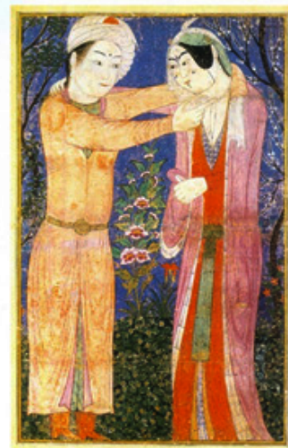
تصویر ۲- دودلداده، احتمالاً کار شیخی، حدود دهه ۸۵۵ هجری، تبریز، موزه متروپولیتن، نیویورک.

از عبارات یاد شده پیداست که سلطان محمد پیش از بهزاد در کتابخانه شاه اسماعیل کار می کرد و بوداق قزوینی از استادان قدیم نام می برد بعید نیست درویش محمد و شیخی بوده باشد که می گفته اند سلطان محمد روش قزلباشی را بهتر کار کرده و بخصوص در کلاه و لباس حیدری (کلاه دوازده ترک) و کشیدن اسب و اسلحه، مهارت و استادی به خرج داده و حتی در تصویر اسب از بهزاد پیشی گرفته است به طوری که قرینه استاد بهزاد شده است و این طبیعتاً در دوران پختگی او بوده است. می توان گفت که جوانی سلطان محمد در دربار سلطان یعقوب و در مجاورت استادان