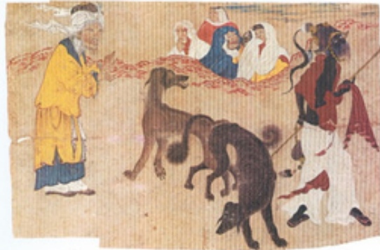
تصویر ۵- سگ بانان، مرقع سلطان یعقوب، کار شیخی، شماره H2153، توپقاپی سرای استانبول.

۲. بین دربار سلطان یعقوب و سلطان حسین بایقرا مناسبات و روابط دوستانه برقرار بود و گاهی بین دو دربار هدایایی رد و بدل می‌شد و حتی برای خرید هنرمندان و سخنوران کارهایی صورت می‌گرفت. بعید نیست که این آثار به عنوان هدیه از دربار سلطان حسین بایقرا برای سلطان یعقوب فرستاده شده و سلطان یعقوب هم دو هنرمند برجسته خود شیخی و درویش محمد را مامور فراهم آوردن این دو مرقع کرده است. بویژه گفتنی است که این آثار مخصوصاً آثار استاد محمد سیاه‌قلم، متعلق به دوره اول مکتب هرات بوده و برای سلطان حسین بایقرا که بیشتر گرایش‌های عرفانی را دنبال می‌کرده، جذابیتی نداشته است. شیخی و درویش