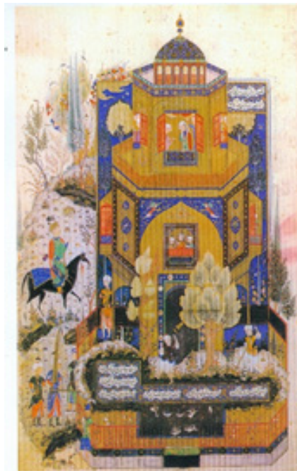
تصویر ۲- خسرو در مقابل قصر شیرین، خمسه نظامی، تبریز، حدود ۸۸۶ تا ۹۱۱ هجری، مجموعه کی‌یر، نیویورک.