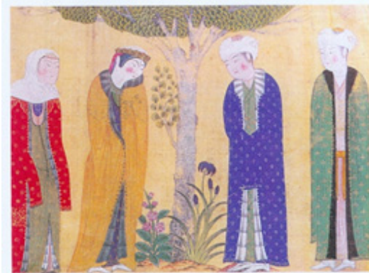
تصویر ۶- دو دل‌داده و ندیمه‌ها، احتمالاً کار شیخی، تبریز، حدود دهه ۸۵۵ هجری، مجموعه خصوصی، پاریس.