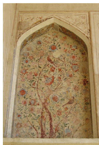
تصویر ۶- نقش مایه گل و مرغ در عمارت.