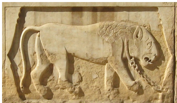
تصویر ۴- شیر حجاری جلو عمارت.