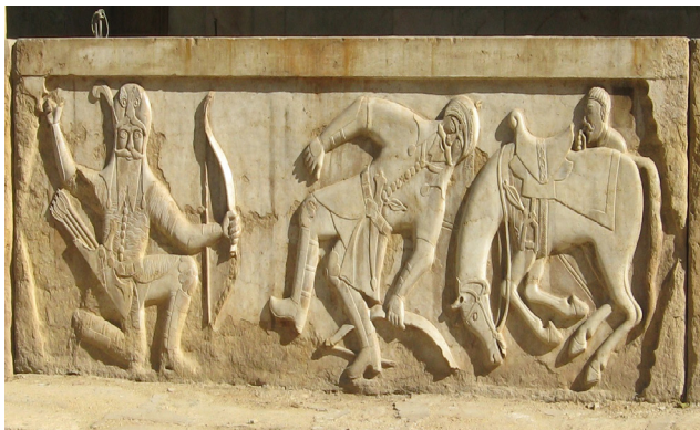
تصویر ۳- نبرد رستم و اشکبوس در نقش برجسته حجاری جلو ایوان.

برجای گذاشته است (حدیدی و دیگران، ۱۳۸۸، ۷). ایرانیان شاهین را خدای طوفان، سرور پرندگان، نماد قدرت، خوش یمن می‌دانستند که حضوری پر صلابت در بیان قدرت و عدالت دارد (همان، ۱۳). عقاب و شاهین در اساطیر دارای یک معنا هستند و در آثار بدون تمایز بررسی می‌شوند (خسروی، ۱۳۹۱، ۷۰) شاهین (عقاب) مبین ادامه زندگی و مقاومت در قبال حوادث نابودکننده ناشی از طوفان است (همان، ۷۱). معانی سمبلیک شاهین عبارت از بینایی، تفکر، خرد و سکوت است (جایز، ۱۳۷۰، ۳۶) و حضور این پرنده در این حجاری نمادی از نگاه تیزبینانه و مقتدرانه در برقراری عدالت در جامعه و احقاق حقوق مردم و مقاومت در برابر ناگواری‌های زندگی تا برقراری آرامش دارد. این نقش برجسته نمونه منحصر به فردی از هنر حجاری است که در دوران زندیه استفاده شده است. کما اینکه هنر حجاری روایتی در ایران پس از سقوط سلسله‌های هخامنشی و ساسانی، در دوران اسلامی از بین رفته است. احیا این هنر در دوره زندیه در شیراز همان بحث بازگشت و ارج نهادن به تمدن و هنر گذشتگان توسط حاکمان زندیه را دارد. اما نقوش و سمبل‌ها در هر ملتی، همانند گنجی هستند که نشانی از تصور بشر در طول حیات خود دارند و نمایش آرزوها، تخیل‌ها و تفکرهای آنان است که در بین بشر سینه‌به‌سینه از نسل‌ها عبور کرده و در این سیطره تحت تأثیر عوامل گوناگونی مانند تفکرات و اعتقادات، نفوذ جریان‌های هنری مختلف، خواست حاکمان و سفارش دهندگان و خلاقیت هنرمندان تغییر و تحول یافته است.