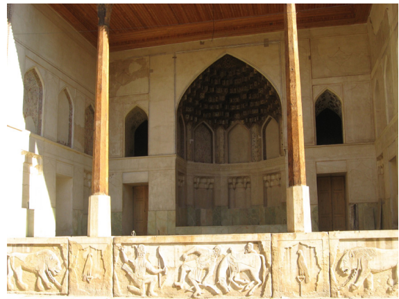
تصویر ۲- حجاری جلو عمارت و فضای شاه‌نشین.

دیگر دوران زندیه به چشم نمی‌خورد (تصویر ۲). اصولاً حجاری‌ها در دوران زندیه در بناها شامل المان‌های ساده هندسی و یا طرح ترنج خاص زندی است که در پلکان‌ها، ازاره‌ها و دیگر قسمت‌های بناها به کار رفته است و این حجاری تنها داستان روایتی است که از شاهنامه برگرفته شده است. این نقش برجسته تصویر نبرد رستم و اشکبوس را نشان می‌دهد که یک داستان عدالت طلبانه در شاهنامه بوده و مورد توجه جامعه فرهنگی آن دوران بوده است (تصویر ۳). در دو طرف این داستان، دو تصویر شیر حجاری شده که به صورت قرینه بوده و در غل و زنجیر قرار دارند (تصویر ۴). شیر نماد قدرت، دلیری، عدالت و قانون و از طرفی نماد بی‌رحمی و جنگ در ایران است (هال، ۱۳۹۲، ۳۲۰). در ادبیات، شیر استعاره شایسته‌ای برای پادشاهان دوستدار جنگ است (همان، ۳۲۲). اما در این نقش برجسته تصویر شیر در غل و زنجیر گرفتار است و می‌توان آن را با توجه به فرهنگ روحی جامعه اینگونه تفسیر نمود که جنگ و ناآرامی از بین رفته و صلح برقرار خواهد بود و یا اینکه هر قدرتی در برابر عدالت یکسان بوده و تفاوتی بین قوی و ضعیف در برقراری عدالت وجود ندارد. قرینه‌سازی تصاویر نیز برابری را در تزئینات عمارت نشان می‌دهد. در دو طرف شیرها دو شاهین حجاری شده است که به فرمی مقتدرانه و با نگاهی نافذ بر روی شاخه‌ای نشسته است (تصویر ۵). در فرهنگ ایران نیز شاهین نماد تیزبینی است. نقش مایه شاهین یکی از نقوش مشترک بین تمدن‌های باستانی است که به دلیل داشتن ظاهری پرصلابت و فیزیکی قدرتمند با عبور از منشور رمزآمیز فرهنگ و هنر ایشان، تعبیراتی مشترک و متقارن