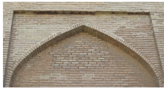
تصویر ۸- آجرکاری عمارت.