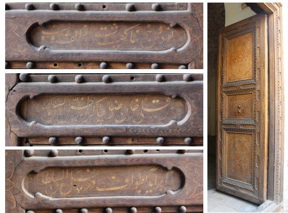
تصویر ۷- کتیبه‌های در چوبی معرق سردر پیاده.

این کتیبه مشتمل بر اشعاری است که پشت شیشه به خط نستعلیق نوشته شده و بر متن کاغذی مطلا و در آیینه‌کاری در کادر