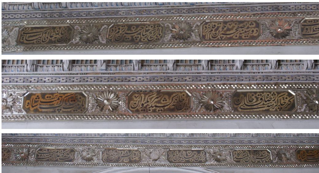
تصویر ۱۲- بخشی از کتیبه‌های سرسرای دیوان خانه.

بر روی جهانیان باعزاز ز آسایش و امن شد دری باز دوشینه بصفحه چون رقم زد تاریخ بنا چنین رقم زد این خانه عالی کیانی برپا ماند و جاودانی بخش غربی مشتمل بر چهار بیت و هشت قاب: بخ بخ ز سرای ظل السلطان وین سردر و این بلند ایوان مانند بنا عشق محکم همچون دل شاه خالی از غم پهلوی زده است آسمان را آرایش از آن بود جهان را رضوانش سزد بخاکروبی کز خلد سبق برد بخوبی بخش جنوبی مشتمل بر هفت بیت و چهارده قاب: طوقش ز تفرج جهان به طاقش ز رواق آسمان به سرمایه از آن خزانها را رب النوع است خانها را بردرگه این بلند طارم روی همه خاصه من هم چون روی همه بود به سوبش محراب کسی شد است کوبش بی واهمه شاید ار در اسلام خود کعبه ثانیست نهم نام اسکندر اگر که زنده ماندی آئینه سقف آن نشاندی