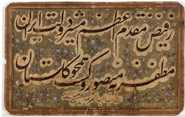
تصویر ۱۳- قطعه خطی عبدالحسین زرین قلم در سال ۱۳۱۸ ه. ق.

عبدالحسین زرین قلم که نام او در انتهای کتیبه سردر اصلی پیاده، بر فراز مقرنس مشتمل بر هشت لوح کاشی آمده است، از خوشنویسان دوره ناصرالدین شاه قاجار بود. تاریخ تولد و فوت ایشان در کتب و اسناد تاریخی مشخص نیست، اما با توجه به آثار بازمانده از این هنرمند که از سال ۱۲۹۵ ه. ق. تا سال ۱۳۱۸ ه. ق. را در برمی‌گیرد، می‌توان به مدت زمان فعالیت حرفه‌ای ایشان پی برد. به گفته مرحوم بیانی در کتاب احوال و آثار خوش نویسان، کتیبه‌ی سردر ورودی صحن و کتیبه‌ی پیشانی ایوان شمالی مزار حضرت عبدالعظیم در شهری، به خط وی است که به قلم پنج دانگ کتیبه‌ی خوش نوشته و رقم «... السلطان ناصرالدین شاه قاجار... کتبه عبدالحسین الخوانساری زرین قلم» دارد (بیانی، ۱۳۴۶، ج ۲، ۳۷۰؛ سرمدی، ۱۳۸۰، ۳۸۱). نگارنده اول به بررسی