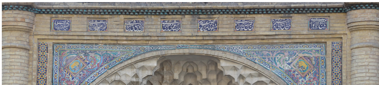
تصویر ۵- کتیبه سردر پیاده، بر فراز مقرنس و مشتمل بر هشت لوح کاشی.

تاریخ سال و بانی او جستم از خرد این بنا مرتفع که ندیده است آسمان مسعودیه نهاد مرا این قصر را بنام یا باب شهر علم نبی مرتضی علی دار این بنای عالی مفتوح و منجلی بحریست در عطا و بر هر دریست پلی