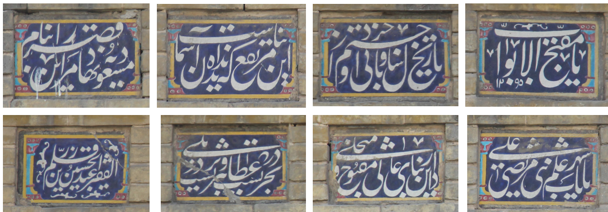
تصویر ۶- کتیبه سردر پیاده بر فراز مقرنس مشتمل بر هشت لوح کاشی.