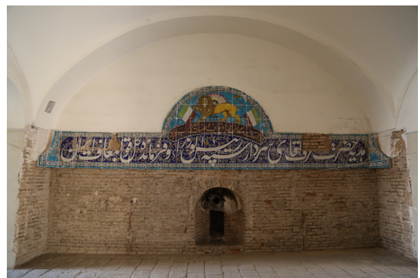
تصویر ۳- وضعیت کنونی کتیبه اولیه سردر کالسکه رو، واقع در زیر زمین.