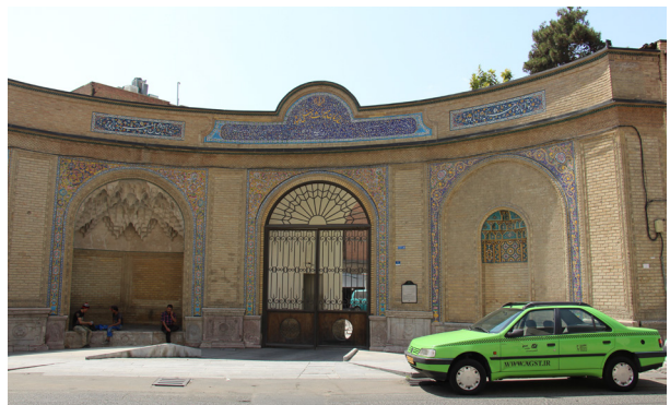
تصویر ۲- وضعیت کنونی کتیبه‌های سردر کالسکه رو.