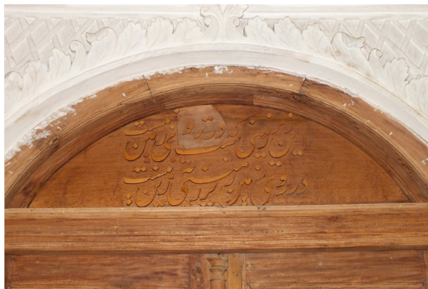
تصویر ۱۰- کتیبه زیرزمین پس از مرمت.

بعهد دولت جمجاه ناصرالدین شاه که بر شده ز فلک صیت عدل و احسانش به یمن دولت شاهنشاه جهان مسعود که خوانده شاه جهاندار ظل سلطاننش بنا نهاد بری این عمارت عالی که برگزیده برفعت ز عرش ایوانش الله محمد علی فاطمه حسن و حسین به کامرانی و اقبال بنده درگاه رضاقلی یکی باشد از غلامانش نمود جهد به پایان رساند این خدمت که باد ایمن ز آسیب دهر بنیاننش