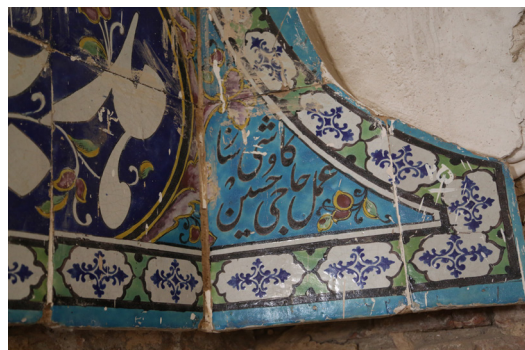
تصویر ۴- کتیبه اولیه سردر کالسکه رو، واقع در زیر زمین، نام کاشی‌ساز و کتیبه‌نگار.