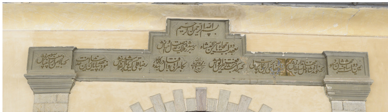
تصویر ۱۱- کتیبه های سردر ورودی سنگی دیوان خانه.

با طالع سعد و بخت سرمد بد پنج کم از هزار و سیصد کز چاکر شه رضاقلی خان این خانه کشید سر به کیوان با نیت پاک همت شاه بر چرخ زد این بلند خرگاه