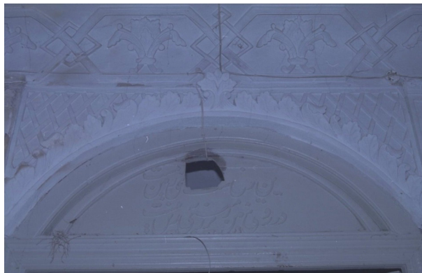
تصویر ۹- کتیبه زیرزمین پیش از مرمت.

بر هلالی سردر چوبی شرقی زیرزمین عمارت مشیرالملکی، کتیبه‌ای منبت‌کاری شده به صورت برجسته به خط نستعلیق به شرح زیر موجود است که کاتب آن نامشخص است (تصاویر ۹ و ۱۰). این زیرزمینی است [که در روی زمین نیست در روی زمین زیرزمینی به [ ] زمین نیست