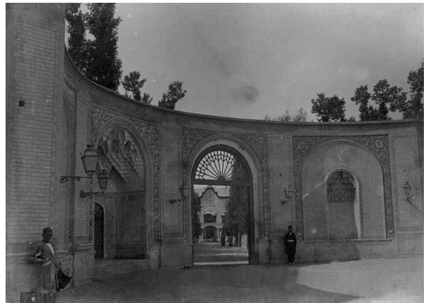
تصویر ۱- تصویر سردر کالسکه رو در زمان قاجار.

کاشی‌کاری و نقاشی روی کاشی‌های سردر باغ ملی تهران نیز از آثار استاد حاج حسین کاشی‌پز است. استاد حاج حسین تا سال ۱۳۲۰ ه. ش. فعال بود و پس از آن فرزندان او را ادامه دادند (مکی نژاد، ۱۳۸۸، ۸۱). از آنجایی که این کتیبه حدود ۴۸ سال