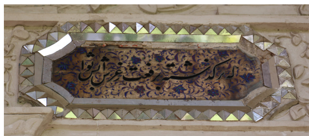
تصویر ۸- بخشی از کتیبه‌های ایوان شرقی ساختمان مشیرالملکی.