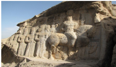
تصویر ۶- شاپور اول در نقش رجب.

شاپور اول در نقش رجب (تصویر ۶) در سه کیلومتری شمال تخت جمشید نقشی از شاپور اول و همراهان او با کتیبه‌ای که تنها