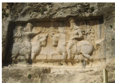
تصویر ۴- نقش بهرام اول در بیشاپور.