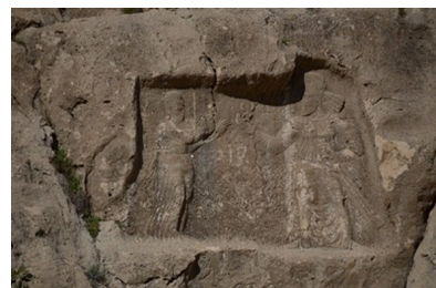
تصویر ۳- نقش برجسته برم‌دلک.