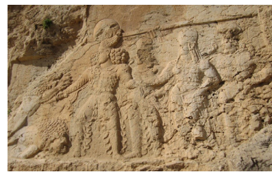
تصویر ۷- نقش بهرام دوم در حال کشتن شیر.