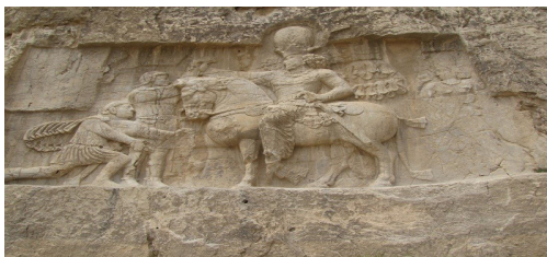
تصویر ۸- پیروزی شاپور اول بر امپراتور روم.