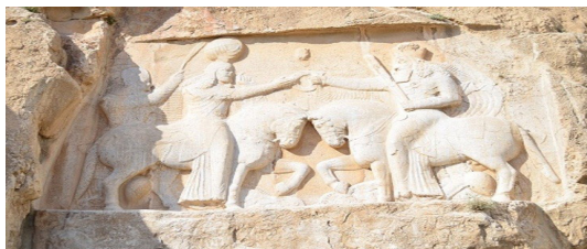
تصویر ۱- نقش برجسته اردشیر در نقش رستم.

نخستین نقشی که بررسی می‌شود نقش برجسته اردشیر (تصویر ۱) است که در بخش تحتانی مقبره‌های هخامنشی در نقش رستم قرار دارد. در این نقش اردشیر را همراه با اهوره‌مزدا می‌بینیم که تنها ریش و سرپوش او با اهوره‌مزدا متفاوت است. در نقش برجسته‌های اردشیر اول پادشاه برای نشان دادن مشروعیت خود از تصویر اهوره‌مزدا بهره برده است (Shenkar, 2014, 52). در تصویر اهوره‌مزدا را سوار بر