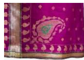
تصویر ۱۳- لباس زربفت زنانه.