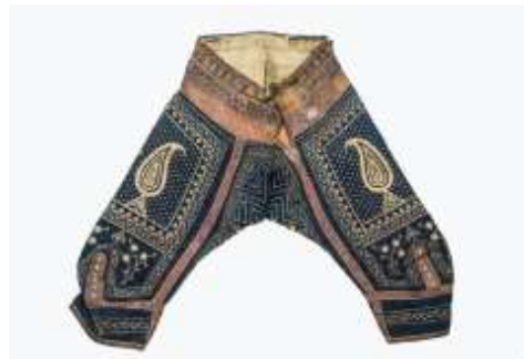
تصویر ۱۱- شلوار پهلوانی.