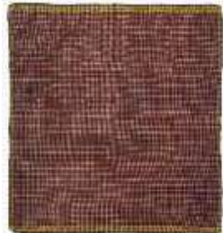
تصویر ۱۷- چادرشب.