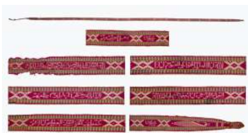
تصویر ۵- نوار آیه‌الکرسی ابریشمی.

بقچه ترمه انگشتی (انگشت‌باف)، متعلق به دوره صفوی و از جنس پشم ۹ است (تصویر ۶). ترمه انگشتی به نوعی از ترمه گفته می‌شود که تار پارچه ترمه از ابریشم تابیده و بود آن از ابریشم، نخ، پشم، کرک و در رنگ‌های متنوع با انگشت بافته می‌شده است. در این بقچه، حاشیه نیز به روش انگشتی و به صورت جدا بافته شده و با تکنیک شیرازه‌دوزی به متن پارچه الصاق شده است. شیرازه‌دوزی روشی از دوخت است که لبه یا به اصطلاح شیرازه دو پارچه را به هم می‌دوزند. این روش، در دوخت شلوارهای زنان زرتشتی نیز کاربرد دارد. رنگ‌های به‌کار رفته در پارچه عبارتند از: مشکی،