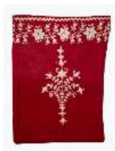
تصویر ۲۰- کیسه پول.