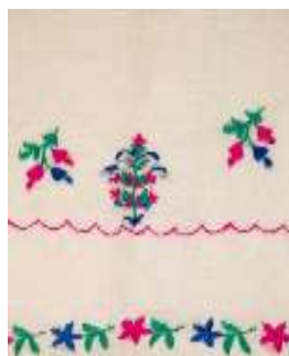
تصویر ۱۴- الف. چادر کتان رودوزی شده. تصویر ۱۴- ب. نقوش سطح چادر کتان.