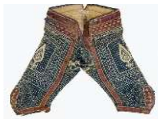
تصویر ۱۰-ب. طرح نام بافنده.