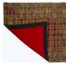
تصویر ۱۹- بقچه ابریشمی.