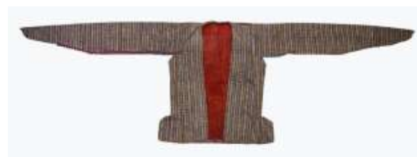
تصویر ۱- الف. ارخالق زنانه.