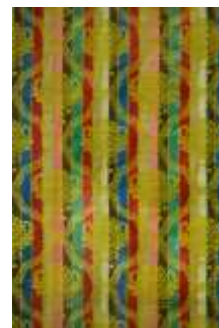
تصویر ۱۵- زیرمنقلی زرینفت.