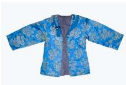
تصویر ۱۲- کت اطلس زربفت زنانه.

چادر سفید کتان و رودوزی شده، متعلق به اواخر دوره قاجار می‌باشد. نقش درخت زندگی در بالای سر قرار گرفته (تصویر ۱۴-الف) و نقش گل‌های تک و دسته‌گل در حاشیه و سرتاسر پارچه با استفاده از تکنیک ساتن دوزی ۱۳ دوخته شده است (تصویر ۱۴-ب). با توجه به نقش درخت زندگی ممکن است این چادر متعلق به عروس بوده باشد؛ اما با در نظر گرفتن مواد ارزان قیمت (کتان)، در تهیه این چادر نمی‌توان بر این نکته