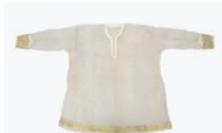
تصویر ۳- الف. لباس تور زردوزی شده.