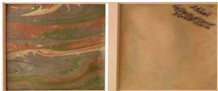
تصویر ۶- ابری اواخر دوره تیموری (۷۷۱-۹۱۱ هـ.ق/۱۳۷۰-۱۵۰۶ میلادی) (کاغذ ابری یک‌رو و قلم‌گیری نشده).