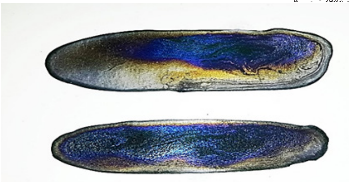
تصویر ۳ - حبر مطوس: استفاده از حبر مطوس به صورت رقیق و ادغام شدن نقوش بدون دخالت دست یا ابزار. مهیج‌تر از رنگ و نقوش ظاهر شده، تفاوت رنگ‌ها و فرم نقوش در زمان‌های مختلف با همان ترکیبات و شیوه‌های ساخت مشابه است (حبر مطوس حبری سیاه است که در قرون اولیه در رنگ‌آمیزی و کتابت کاربرد داشته است. این حبر دارای پس‌زمینه اصلی سیاه است که نقوش رنگین و تابناک روحی شکل بر روی جسم سیاه‌رنگ پس از چند ثانیه نقش می‌بندد).