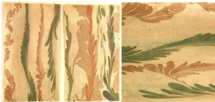
تصویر ۵- ابری‌های اواخر دوره تیموری (۷۷۱-۹۱۱ هـ.ق/۱۳۷۰-۱۵۰۶ میلادی) (کاغذ ابری دورو و قلم‌گیری شده).

۵- قدیمی‌ترین کاغذهای ابری حال حاضر جهان: قدیمی‌ترین کاغذهای ابری حال حاضر جهان دو برگ کاغذ می‌باشد که یک برگ آن از دورو و برگ دیگر تنها از یک رو ابری شده و روی دیگر آن یادداشتی نوشته شده است. این ابری‌ها در اواخر دوره تیموری (۹۱۱-۷۷۱ هـ.ق/۱۳۷۰-۱۵۰۶ میلادی) در ایران ساخته شده و به عنوان پیشکش به خدمت سلطان غیاث‌الدین خلجی از سلاطین ماندوی هند، به سال ۹۰۱ هـ.ق/۱۴۹۴ میلادی داخل کتابخانه شاهی شده است. این جفت کاغذ ابری هم اکنون در مجموعه کرونوس در موزه متروپولیتن نیویورک نگهداری میشود. این دو برگ کاغذ ابری از چند جهت حائز اهمیت بسیار است: قدیمی‌ترین نسخه ابری موجود در دنیاست. قدیمی‌ترین اثری است که مؤید اطلاق واژه «ابری» به این نوع کاغذ و به تبع آن «ابری‌سازی» به هنر ابری کردن کاغذ