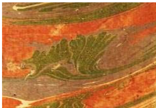
تصویر ۷- بخشی از تصویر ابری اواخر دوره تیموری (۷۷۱-۹۱۱ هـ.ق/۱۳۷۰-۱۵۰۶ میلادی) (کاغذ ابری یک‌رو و قلم‌گیری نشده).