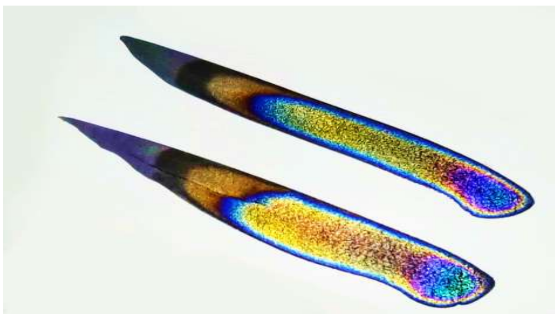
تصویر ۱- حبر مطوس: قلم‌مو پس از آغشته‌شدن به حبر از پایین به بالا حرکت داده شده و پس از چند ثانیه درجات رنگی به شکل بالا بر روی رنگ سیاه اولیه ظاهر شدند.

۱. اولین و اصلی‌ترین شواهد موجود، شیوه‌های پیچیده ساخت رنگ‌ها و حبرهایی است که پیشینه آن‌ها به قرون چهارم تا ششم می‌رسد. (پوریایی، مرآتی، ۱۳۹۷، ۸۶). برخی از این رنگ‌ها ذات رنگین ابری‌شکل داشته و بدون دخالت دست و یا ابزار خاص، اشکال ابری و رنگین به خود می‌گیرند. ابری‌هایی که دارای لایه‌هایی از نور و جلای رنگی هستند و به احتمال بسیار زیاد منشأ ساخت کوه‌های نگارگری و کاغذهای ابری الهام گرفته از همین حبرها و رنگ‌ها می‌باشد. گاهی رنگ‌ها و مرکب‌ها بسته به نوع ترکیبات، بستمان و روان‌روی و گران‌روی آن‌ها و ابزار اثرگذار اغلب به شکل ابری‌های بی‌اختیار ظاهر شده و در هم ادغام می‌شوند. نوع ترکیبات، شیوه‌های ساخت، رقت و غلظت بستمان و ابزارهای مورد استفاده، فرم دهی به اشکال و ایجاد تنوع را به بی‌نهایت می‌رساند. تصاویر زیر نشان می‌دهد حبر (از انواع جوهرها و مرکب‌های رنگین)، با هر ابزار و شکلی که روی کاغذ حرکت داده شود به همان شکل و فرم ظاهر می‌شود. رنگ در این تصاویر یک بار با حرکت قلم از راست به چپ کشیده شده است، در نتیجه درجات رنگی در کنار هم به صورت خطی و با چکیده‌شدن رنگ به