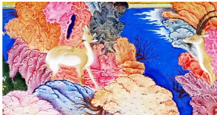
تصویر ۸ - نمونه انسان‌ها و جانوران در ظاهر اتفاقی که در ارتباط با رنگ‌سازی خاص قرون اولیه در گوشه‌ای از نگاره سلطان محمد در شاهنامه شاه تهماسبی دیده می‌شود. مأخذ: (www.metmuseum.org)

آثار نگارگری ذهن بسیاری از پژوهشگران را مشغول کرده است، ارتباط تنگاتنگی با شیوه‌های رنگ‌سازی قرون اولیه دارد. این رنگ‌ها بدون اغراق کیفیت و ویژگی‌های مشابه با عناصر موجود در طبیعت دارند. چنان‌که نمونه‌های آن را امروزه نیز در نقوش طبیعت، کوه‌ها و ابرها می‌توان با قوه تخیل جست‌وجو کرد. اوج زیبایی آثار نگارگری در این جاست که انسان‌ها و جانورانی که با این رنگ‌ها بر روی کاغذ نقش می‌بندند، از رنگ‌هایی کاملاً هوشمند با شیوه‌های ساخت خاص در قرون اولیه ایجاد شده و در نهایت در طراحی تخیلی کوه و صخره‌ها با اشکال جانوری و صورت انسانی تأثیر مستقیم داشته‌اند. نقوش ایجاد شده به ظاهر اتفاقی در این رنگ‌ها گاهی انسانی، گاهی حیوانی، گاهی واقعی، گاه تخیلی گاه در اوج آرامش و یا اوج هیجان بوده و با چهره‌ها و شخصیت‌های تصویر شده صوری و اصلی تصویر متفاوتند. بنابراین وجود هر نقش و نگار، بافت، ترکیب، شیوه و یا سبکی در آثار نگارگری با وجود ساخت این نوع رنگ‌ها امری دور از ذهن نخواهد بود. می‌توان گفت که آثار نگارگری با توجه به شناخت کلی از علم و شیمی رنگ‌سازی گذشته می‌تواند مجموع تمامی سبک‌ها و فن‌های بسیاری باشد که در حال آمدوشد در قرون معاصر هستند. تأمل و تعمق در تنوع جانداران موجود در تصویر نشان می‌دهد که این تنوع می‌تواند کاملاً غیرارادی باشد و مختص حرکت، ادغام و در هم پیچیدن رنگ‌هایی است که هنرمند با قوه تخیل خود آن‌ها را از دل کوه‌ها بیرون کشیده است. (تصویر ۸).