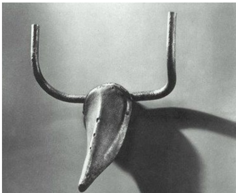
تصویر ۳- پابلو پیکاسو، سرگاو ۱۹۴۲، زین و فرمان دوچرخه، ۳۳ × ۴۳ × ۱۹ سانتی‌متر. مأخذ: (دراشتن، ۱۳۸۸، ۱۳۱)