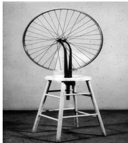
تصویر ۲- مارسل دوشان، چرخ دوچرخه ۱۹۱۳، چرخ نصب‌شده روی سه پایه، ارتفاع ۱۲۲ سانتی‌متر در قطر ۶۵ سانتی‌متر.