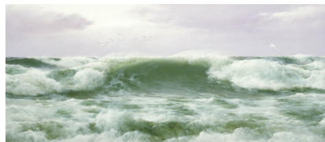
تصویر ۵- بر باد دمیده شده، دیوید جیمز، ۱۸۹۸.

غناي رنگ و فرم در آن وجود دارد. دریا فقط متشکل از یک نوع سبز نیست. اثر، علاوه بر غنای پالت رنگی، ترکیب‌بندی مستحکمی نیز دارد. یک‌سوم بالایی کادر را آسمان تشکیل می‌دهد. پرنده‌های دریایی، به‌عنوان نمادی از زندگی و خوش‌بینی، در آسمان و نزدیک به امواج پرواز می‌کنند.