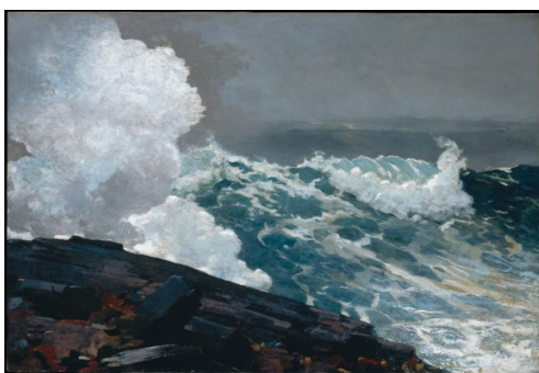
تصویر ۲- نورث/ایستر، وینسلو هومر، ۱۸۹۵.