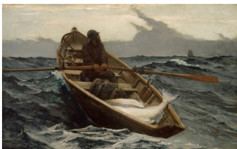
تصویر ۳- هشدار مه، وینسلو هومر، ۱۸۸۵.

مکان خاصی اشاره ندارد، بلکه نامی است که به نوع خاصی از طوفان که در غرب اقیانوس اطلس شمالی رخ می‌دهد، داده شده است. واضح است که این عنوان در اینجا برای توضیح امواج متلاشی‌کننده که در پیش‌زمینه به صخره سنگی ساحل برخورد می‌کنند، استفاده شده است. قدرت و ویران‌گری طبیعت، نیروی محرکه هومر برای خلق اثر بوده است. تاریخچه قابل توجهی برای این اثر وجود دارد. طبق آنچه نقل شده است، اثر در ابتدا دارای عناصر فیگوراتیو بوده است که تجهیزات مناسب برای این شرایط آب و هوایی را با خود به همراه داشته‌اند. اثر به‌خوبی مورد توجه و استقبال قرار گرفته و حتی به فروش رفته بود، اما بعدها برای ایجاد منظره دریایی ناب و جلوه قدرتمند امواج مهیب، که در این بخش مورد توجه است، عناصر فیگوراتیو به‌طور کامل حذف شد. تمرکز ویژه بر ایژه دریا و امواج، بنیان شکل‌گیری اثر جدید قرار گرفت.