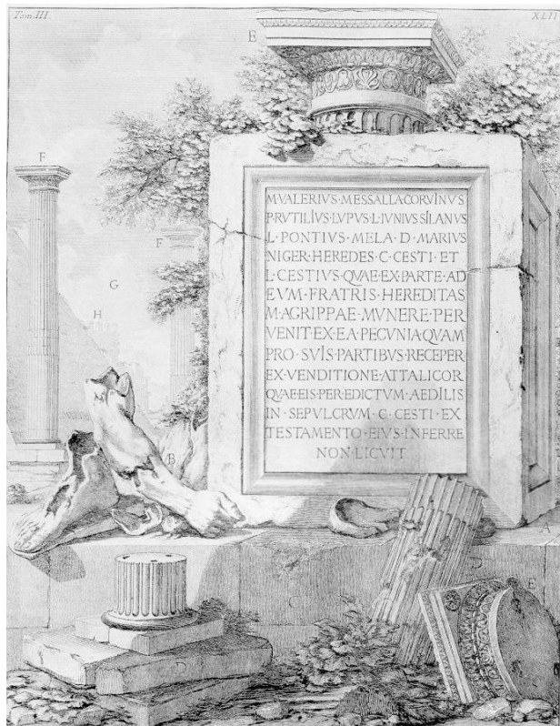
تصویر ۱. تصویر شمارهٔ چهارم از دو جلد سوم کتاب عتیقه‌های رومی، جیووانی باتیستا پیرانزی، رم، نسخه سال ۱۷۸۴ میلادی. مأخذ: (Ficacci, 1999, 251)

توجه پیرانزی از میانه‌های دههٔ چهل تا اوایل دههٔ شصت قرن هجدهم میلادی به شکل فزاینده‌ای به باستان‌شناسی معطوف شد و از این جهت او آثارش را برای تعداد بیشتری از پژوهشگران طراحی می‌کرد. در این دوره بود که کتاب چهارجلدی عتیقه‌های رومی منتشر شد. تصاویر در این کتاب‌ها راهنمای بینندگان و خوانندگانی بودند که به گردش در رم باستانی و حومه آن می‌رفتند. این تصاویر نشان‌دهندهٔ وسعت نظر پیرانزی در ترکیب شیوه‌های مختلف در طراحی بودند: پلان‌های شمایل‌نگارانه، مقاطع یادمان‌های عظیم، مناظر شهری، جزئیات مربوط به ساخت و تزیین (Dixon, 1999, 184). (تصویر ۱) از جمله آثاری است که در جلد سوم این کتاب آمده است. در پس‌زمینهٔ محو این اثر دیواری کهن، یک هرم و دو ستون دیده می‌شود. سطح مفروش با تخته‌سنگ‌های بزرگی که کنار هم چیده شده‌اند، صحنه‌ای را ساخته که بر روی آن برخی قطعات باقی‌مانده از ویرانه‌ای قرار گرفته‌اند. پیرانزی در تصویر، اشیاء را شماره‌گذاری کرده است و در پی نوشت فهرست دقیقی از آن‌ها را می‌آورد: (A) یکی از دو پایه‌ستون کاملاً مشابه از موزه کاپیتولینه ۱۴ ؛ (B) تکه‌پاره‌هایی از تندیس برنزی عظیم‌الجثه؛ (C) آرایش قطعات سنگی