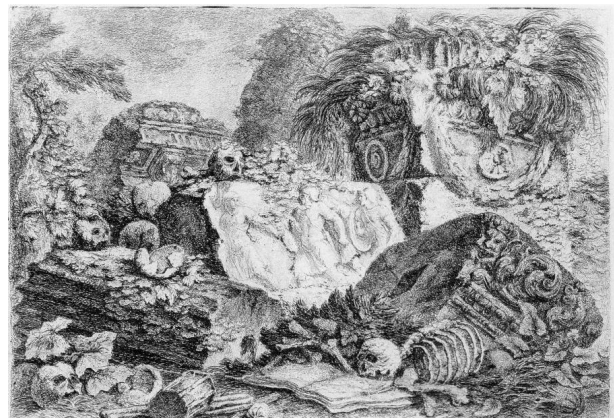
تصویر ۳. مدیج باستانی، حیوانی باتیستا پیرانزی، سال ۱۷۵۰ میلادی.

چنین آثاری از پیرانزی را می‌توان در راستای تجسمی از گفتمان «لذت از ویرانه‌ها» تعبیر کرد که از میانه‌های سده هجدهم به‌ویژه در فرانسه رایج شده بود. از این رو ادعا می‌شود که علاقه پیرانزی به ویرانه‌های رومی الهام‌بخش شاخه‌ای از جنبش بین‌المللی است که نگاهی تاریخ‌گرایانه و احساسی به گذشته دارند (Rosenblum, 1967, 113). در نقاشی همچون ادبیات ویرانه‌ها غالباً جای منظره را در پس‌زمینه یک ترکیب‌بندی می‌گرفتند، تصویری که کارکرد اصلی‌اش گونه‌ای روایت‌پردازی بود؛ اما در ژانر «کاپریس» ویرانه‌ها نه در مقام پس‌زمینه بلکه در مقام موضوع اصلی نقاشی قرار گرفتند (Augustyn, 2000, 433). پیرانزی در کنار نقاشانی مانند جیان - پائولو پانینی ۳۲ ، جیان آنتونیو گاردی ۳۳ در ایتالیا و هوبرت رابرت ۳۴ در فرانسه از مهم‌ترین هنرمندان قرن هجدهم بود که