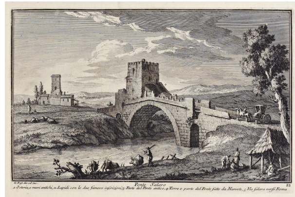
تصویر ۵. پل سالاریو، جزویه وازی، ۱۷۵۵ میلادی.