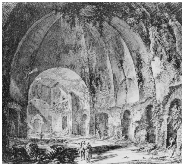
تصویر ۴. فضای داخلی حمام سالوستیوس ۳۱ ، حیوانی باتیستا پیرانزی، ۱۷۵۶ میلادی.

مقایسه دو تصاویر (۵-۶) می‌تواند رویکرد پیرانزی در نمایش یادمان‌های گذشته را آشکارتر نشان دهد. تصویر (۵) اثری از جزوپه وازی ۲۶ است با عنوان پل سالاریو ۲۷ (در حوالی رم) و تصویر (۶) اثری از پیرانزی است با همان موضوع. در حالی که اثر وازی کیفیتی خوش‌منظر ۲۸ دارد اثر پیرانزی تأثیری دیگر را القا می‌کند. وازی خط افق اثر خود را تقریباً هم‌ارتفاع با چشم بیننده‌ای که در این سوی رودخانه در حال نگریستن منظره است در نظر گرفته، به شکلی که سر بیننده با سر پیکره‌ها در افق تقریباً در یک ارتفاع به نظر می‌رسد. این خط افق در امتداد پل و پایه‌های ستون ناظر بر آن قرار دارد. چنین پرسپکتیوی ابعادی انسانی به صحنه بخشیده است. از سوی دیگر نمای کلی اثر وازی حالتی همه‌بین ۲۹ دارد (Ipek Ek & Sengel, 2007, 21). موضوع اصلی اثر یعنی پل و برج در