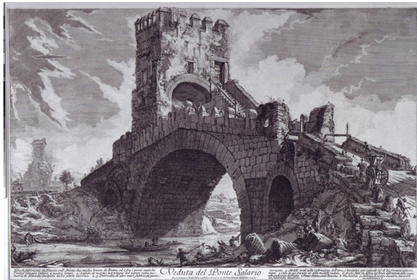
تصویر ۶. پل سالاریو، اثر جیووانی باتیستا پیرانزی، ۱۷۵۴ میلادی.

بنا به مفاهیم کانت در «نقد قوه حکم» چنین تجسمی می‌تواند قابلیت برانگیختن احساس «والایی ریاضی» را داشته باشد. جالب توجه آن است که در «نقد قوه حکم» تنها نمونه‌هایی از «مصنوعات» انسانی که از نظر کانت حالتی از «والایی» را برمی‌انگیزانند، مربوط به همین قسم از والایی و دو بنای معماری است: اهرام مصر و کلیسای پطرس مقدس (کانت، ۱۳۸۶، ۱۶۷). توضیح کانت درباره والایی اهرام در مورد نماهای پیرانزی از ویرانه‌های عظیم رمی نیز صادق است. از نظر کانت برای دریافت کامل تأثیر عاطفی حاصل از بزرگی اهرام باید از نزدیک شدن بیش از حد و نیز از دور شدن بیش از حد اجتناب کرد. در عمل پیرانزی نیز، چنان‌که از جهت شکلی نشان داده شد، تمهیدات متعددی را به کار بسته که این ویرانه‌ها عظیم‌تر به نظر آیند. به عبارتی پیرانزی از نمایش زیبایی این یادمان‌ها گذر کرده و با تأکید بر ابعاد عظیم و بزرگی آن‌ها به سمت نشان دادن والایی آن‌ها حرکت کرده است. از سوی دیگر باید به خود ایده «ویرانی» در این