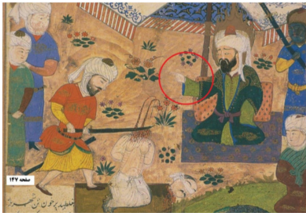
تصویر ۷. تحمیل دین اسلام.

رهبران‌شان، این ادعا دیده شده است (ادعای اینکه روح علی در رهبر این فرقه حلول کرده و برای کشورگشایی و نیت‌های دنیا طلبانه‌ی خویش، خود را علی می‌نامید). از تصویری‌سازی های نسخه خاوران‌نامه در فرهنگ غیر ایرانی و غیر شیعی، از شخصیت علی (ع) به‌عنوان یک فرد متخاصم و جنگ طلب تلقی می‌گردد. همچنین در نگاه مخاطب ایرانی و شیعی نیز این پرسش مطرح می‌گردد که علت تغییر چیست؟ رژیم حقیقت در این گفتمان چگونه عمل کرده است؟ که سبب این گونه نشان دادن حضرت علی (ع) در متن و تصاویر خاوران‌نامه شده است. زیرا مفهوم قهرمان و پهلوان در فرهنگ ایرانی به گونه‌ای کاملاً متضاد با این مفهوم نوساخته است.