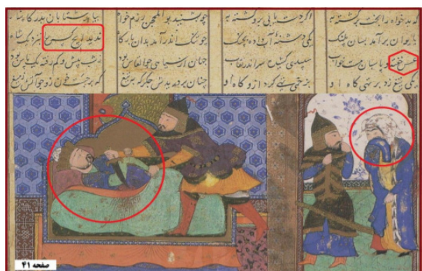
تصویر ۶. قتل غافلگیرانه نوادر.