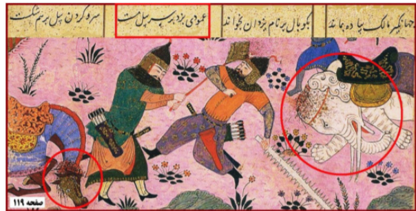
تصویر ۳. کشتار حیوانات.

باتوجه به تأکید فوکو به بر درهم تنیدگی قدرت/دانش، که نه تنها به علت گفتمانی بودن دانش‌ها و شکل گرفتن گفتمان‌ها بواسطه‌ی قدرت، است، بلکه گفتمان‌ها مولد هستند و با اتکاء به مفروض‌ها و ادعاهایی که دانش آن‌ها حقیقی است، با کمک زمینه‌هایی ادعای حقیقت می‌کنند. فوکو این را به عنوان رژیم حقیقت مطرح کرده است (رز، ۱۳۹۷، ۲۶۱). بادقت در جزئیات تاریخی می‌توان بیان کرد که این مفهوم از قهرمان و نمایش این‌گونه از حضرت (ع) یک حقیقت برساخته‌ی تاریخی است. لذا در ابتدای امر با کمک تصاویر موجود به کشف این ویژگی‌های شخصیتی که از حضرت علی (ع) نمایان شده است، پرداخته شد و از توصیف تصاویر به عناوینی مانند: بدرفتاری با اسیران، روحیه‌ی تجاوزگری، شکنجه‌های وحشتناک، زجرکشی، انبوه کشتار انسان‌ها، کشتار حیوانات و تحمیل دین اسلام دریافت گردید. در مواجهه با متن خاوران‌نامه نیز مغایرت‌هایی وجود دارد که از توصیف‌های اولیه آن‌ها به ویژگی بی‌رحمی و سنگدلی، برآشفتگی و عصبانیت، آغازگری جنگ‌ها از خصوصیات حضرت علی (ع) در نسخه خاوران‌نامه برشمرده شد. حال در تمام تصاویر با این مضامین، تصویرگر، صورت‌بندی چهره علی (ع) را بطور کاملاً ملموس ترسیم کرده است؛ نمادهایی مانند: هاله‌ای طلایی دور سر، شمشیر دوزبانه (ذوالفقار) و همچنین اسب مخصوص ایشان بنام دولدل، بهره گرفته است تا بیننده در اولین نگاه به سوزده اصلی داستان رهنمون شود. در گفتمان سیاسی، مفهوم قدرت طلبی و خشونت را می‌توان در انبوه کشتارهای خانوادگی که در میان خاندان‌های تیموری و ترکمانی اتفاق افتاد می‌توان مشاهده کرد. در گفتمان مذهبی، مفاهیمی