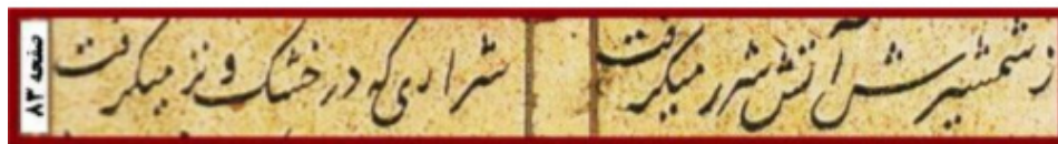
تصویر ۱. متن اشعار خاوران‌نامه. مأخذ: (خوسفی، ۱۳۸۱، ۸۳)

تصاویر موجود در این نسخه شامل ۱۱۵ برگ است، در این میان تعداد ۸۱ تصویر مربوط به جنگ‌های حضرت (ع) و تعداد ۳۴ تصویر مربوط به سایر موضوعات اختصاص دارد. به‌طور تقریبی ۷۰ درصد از تصاویر کتاب خاوران‌نامه محتوای کشتار و خونریزی دارد. حبیب‌اللهی به وجود تناقضات تصویری اشاره می‌کند. هنرمند نقاش به تصویرسازی تعارضات با چهره حقیقی حضرت (ع) در متن نهج‌البلاغه و متن خاوران‌نامه می‌پردازد مانند: تجاوزگری، مثله‌سازی، زجرکشی، قتل غافلگیرانه، کشتار انسان‌ها و حیوانات و اجبار در تحمیل اسلام؛ نسبت دادن هر یک از این صفات ناپسندیده به حضرت علی (ع) کافی است که تعلق این مثنوی به هنر مصطلح شیعی رازیر سؤال ببرد. در آثارالباقیه اثر ابوریحان بیرونی در ۱۱۸