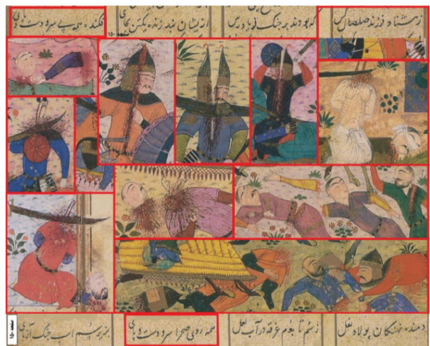
تصویر ۵. مثله‌گری در خاوران‌نامه. مأخذ: (حبیب‌اللهی، ۱۳۹۷، ۷۵)