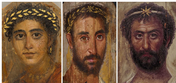
مجموعه تصویرهای ۷. نقاشی‌های مومیایی‌های مصر رومی، فیوم، به ترتیب از راست به چپ: ۱۴۰-۱۶۰ م. بریتانیا، EA74714. مأخذ: (URL7)؛ ۱۵۰-۱۸۰ م. بریتانیا، EA74832. مأخذ: (URL8)؛ ۹۰-۱۲۰ م. متروپولیتن، 09.181.6. مأخذ: (URL9)

و طبیعی در آن‌ها نمی‌توان یافت؛ اما ابن هیثم نقاشی‌هایی را توصیف می‌کند که در آن زبری سطح برگ‌های گیاه، بسیار طبیعی به نظر می‌آید. ۳۴ این ویژگی در شماری از نقاشی‌های مومی که اکنون در دست است، به روشنی دیده می‌شود. برای نمونه همانگونه که در مجموعه (تصاویر ۷) دیده می‌شود، تاج گل‌ها بر سر درگذشته را با ورق طلا یا رنگ طلایی (نماد ابدیت) به حالت طبیعی بازنمایی می‌کردند (Borg, 2010, 9).