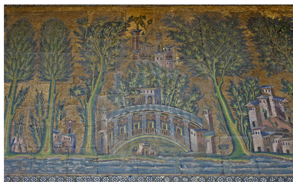
تصویر ۱. موزاییک‌کاری مسجد جامع دمشق، دوره اموی.

نقاشی‌های قُصیرعمره با آن‌که از نظر درون‌مایه‌ها در ارجاع به شکوه زندگی شاهانه: بزم‌های سرگرم‌کننده، رسم پیشکشی، بندبازی، شکار، گشتی، شنا، و جز آن؛ به جریان زندگی روزمره بسیار نزدیک می‌شود، اما در بازنمایی هم‌چنان به شیوه‌های گذشته ایرانی و بیزانسی وفادار است، و صحنه، حالتی تخیلی و آرمانی می‌یابد. آمیختگی درون‌مایه‌های روزمره و این‌چهرانی با مایه‌های آرمانی، که از نظر تکنیکی از یک‌سو، با پیکره‌های انسانی دقیق و ظریف همراه است و از سوی دیگر بازنمایی حیواناتی با طراحی ضعیف (تصویر ۲)، نشانه آن است که در قُصیرعمره (و بازنمایی‌های دوره اموی) چندین سنت نقاشی به هم رسیده‌اند. با این‌همه، «بیشتر پیکره‌ها با چنان خطوط زمختی طراحی شده‌اند که این پیکربندی‌های تنومند را با آن سایه روشن‌ها و یا ترکیب‌بندی فاقد ظرافت