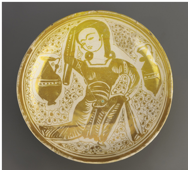
تصویر ۴. کاسه زرین فام، مصر، سده ۶ ق.م گالری فریر، F.1946.30.

بر زمینه تأثیرگذاری سبک سامرا روی تزیین و بازنمایی در سراسر حوزه خلافت، هنر مصر نیز از بار تأثیر آن برکنار نماند. برای نمونه برخی کنده‌کاری‌ها بر چوب در مصر (سده ۳ ق.م) بازنمودی از اوج سبک سامرا است و بیشتر نقش‌مایه‌های آن با نمونه‌های نخستین عراق یکسان است. نقش‌مایه‌های مرغ و حیوانات و تزیین گیاهی از جمله نقش‌مایه‌های سامرا است که در هنر مصر، به حالتی سنجیده و دیرپاب دگردیدی یافته است؛ ولی «این موجودات خیالی چیزی جز عجیب‌الخلقه‌ها نیستند» (اتینگهاوزن و گرابر، ۱۳۸۶، ۱۱۲). سرامیک‌های زرین فام بازمند از اواخر سده ۵ ق.م حاکی از گرایش به بازنمایی طبیعی پیکره‌های انسانی است (تصویر ۴)، با بهره‌مندی از خط‌های پرتوان، حالت‌های نامتوازن و حس حرکت. این ویژگی با الهام از میراث مدیترانه‌ای مصر، در تقابل با «نقش‌مایه‌های نسبتاً ایستای گیاهی و حیوانی آثار نخستین فاطمی» بود (همان، ۲۵۰-۲۵۱). گذشته از آن در سده‌های نخستین هجری، نقاشی در مصر به حرکت مستقل خود از هنر عصر خلافت عباسی ادامه