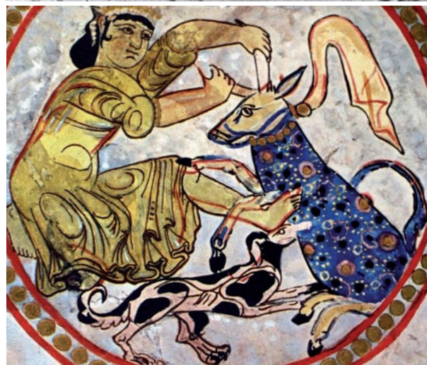
تصویر ۳. زن شکارچی، عکس و بازسازی نقاشی کاخ جوسق الخاقانی دوره عباسی، سامرا. مأخذ: (Hoffman, 2008, 115)

(عکاشه، ۱۳۸۰، ۲۰۹). هم‌چنین در نگاه به ویژگی آرایه‌های دوره اموی، بهره‌برداری از چارچوب‌های هندسی را افزون‌بر کارکردهای گفته شده (اتینگهاوزن و گرابر، ۱۳۸۶، ۴۷)، می‌توان شگردی برای فاصله‌گرفتن از بازنمایی طبیعی تعبیر کرد.