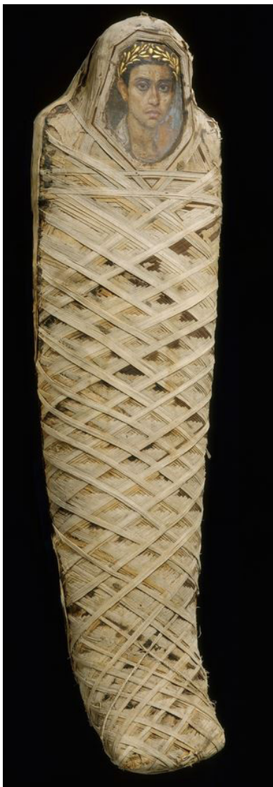
تصویر ۸. نقاشی مومی در نمای کلی و ریزپردازی‌های تزئینی آن، ۱۰۰-۸۰ م. فیوم مصر، متروپولیتن، 11.139.

می‌دهد، ۴. ابهام درباره تأثیر گزارش ابن هیثم را بر نقاشی رنسانس با روشنائی بیشتری همراه می‌کند.