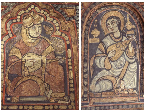
تصویر ۵. نقاشی‌های سقف کاپلا پلاتینا، ۱۲ م.، پالمو، سیسیل ایتالیا.

هرتسفلد به برجستگی حضور پیکره زنان در این دوره اشاره می‌کند. در نمونه صحنه زن شکارچی (تصویر ۳)، پیکره اصلی گویا برگرفته از صحنه‌ای شبیه دیانا است، ولی دگردیدی آن با دماغ عقابی دراز، لپ‌های گوشتالود و دسته‌موی سیاه پشت سر و طره باریک در بناگوش به آن حالتی شرقی داده است (همان، ۱۲۳). در این آثار، شگردهایی مانند اغراق در حرکت، سنگینی، نگاه خیره بی‌انعکاس، و کیفیت تزیینی بدن حیوان و جامه انسان، بر شیوه غیرطبیعی بازنمایی تأکید دارد.