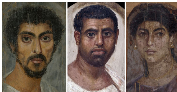
مجموعه تصویرهای ۶. نقاشی‌های مومیایی‌های مصر رومی، فیوم، به ترتیب از راست به چپ: ۷۰-۵۵ م. بریتانیا، EA74716. مأخذ: (URL4)؛ ۸۰-۱۰۰ م. بریتانیا، EA74718. مأخذ: (URL5)؛ ۱۳۰ تا ۱۵۰ م. متروپولیتن، 09.181.2. مأخذ: (URL6)

گذشته از گزارش مسعودی در هماهنگی با سخنان ابن‌هیثم، کاوش‌های باستان‌شناختی نیز، نسبت نقاشی‌ها با هویت افراد مشخص را تأیید می‌کند. در کنار برخی از نقاشی‌ها، نام درگذشتگان را نیز می‌نوشتند؛ نام‌هایی با ریشه‌های واژگانی مصری، یونانی و لاتین. از دید